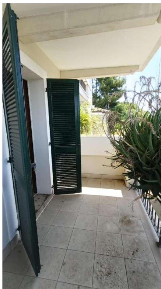
APPARTAMENTO SUB 17 – DISIMPEGNO E BALCONE