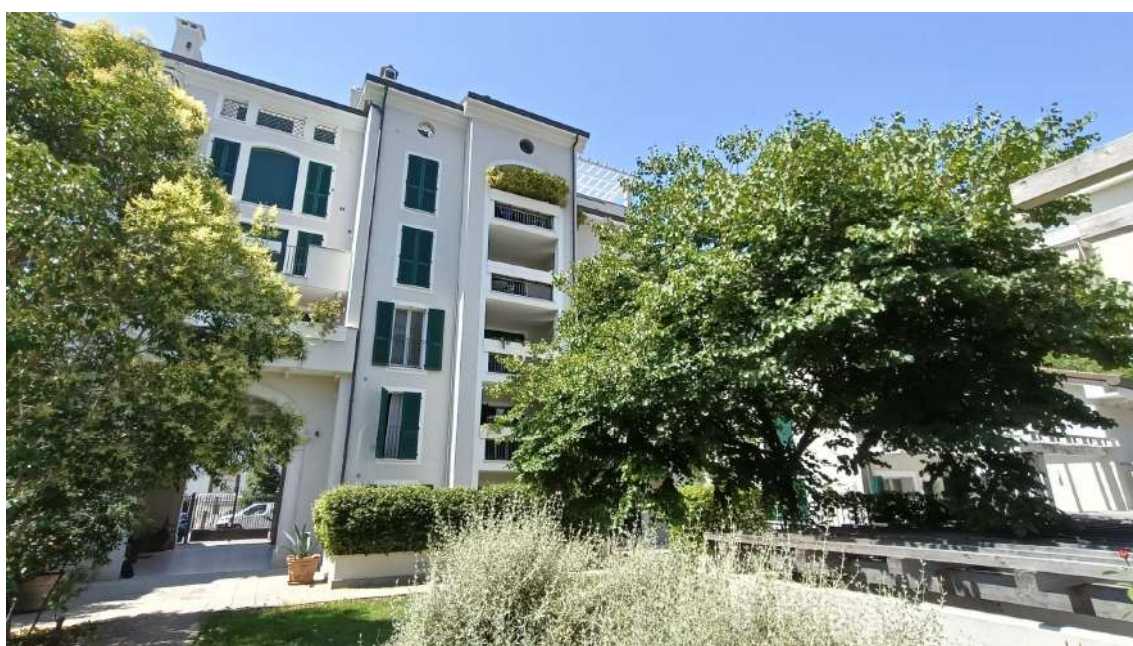
VISTA DEL FABBRICATO DAL CORTILE INTERNO