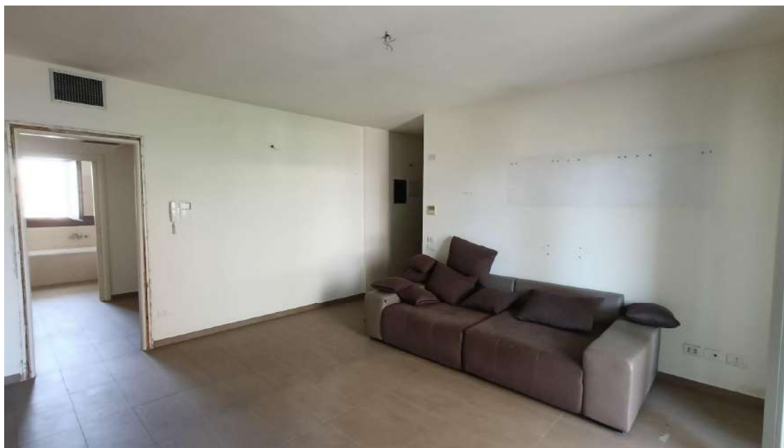
APPARTAMENTO SUB 17 – INTERNI LOCALE SOGGIORNO/PRANZO