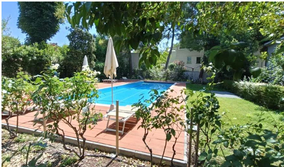
AREA RELAX E PISCINA CONDOMINIALE NELLA CORTE COMUNE