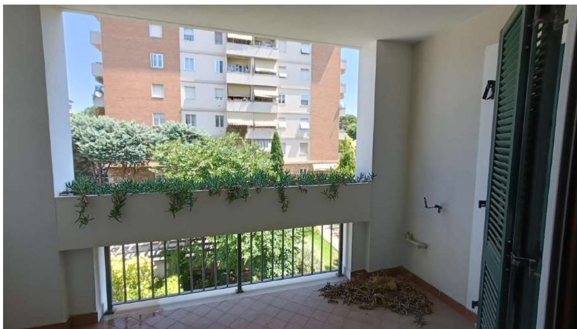
APPARTAMENTO SUB 17 – BALCONE/LOGGIA