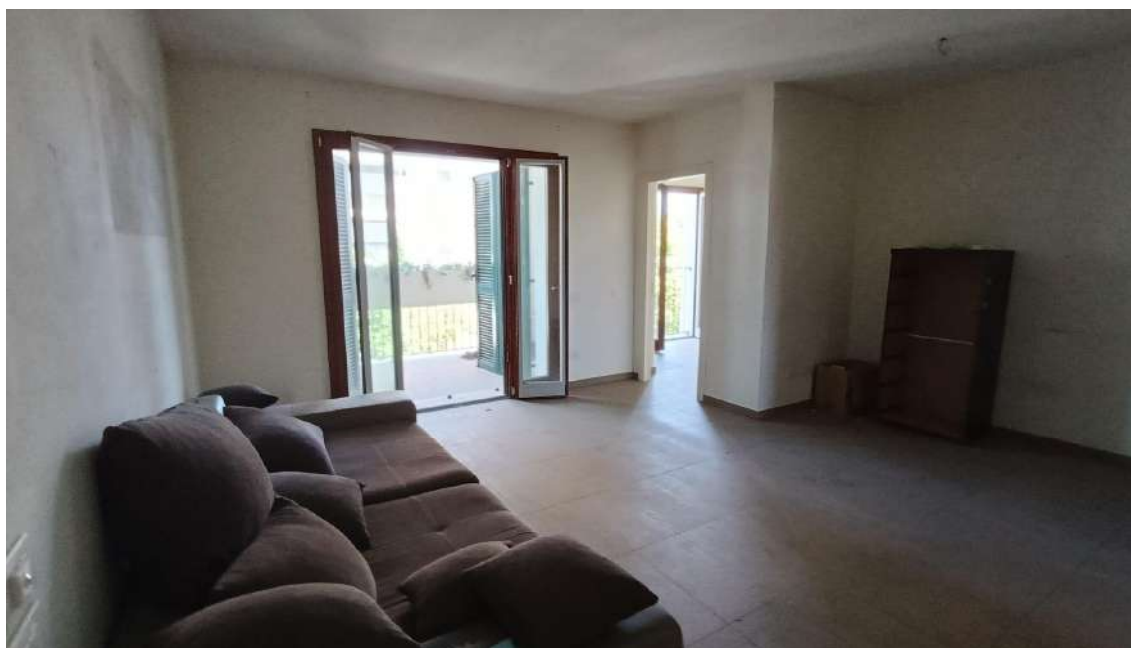
APPARTAMENTO SUB 17 LOCALE SOGGIORNO/PRANZO