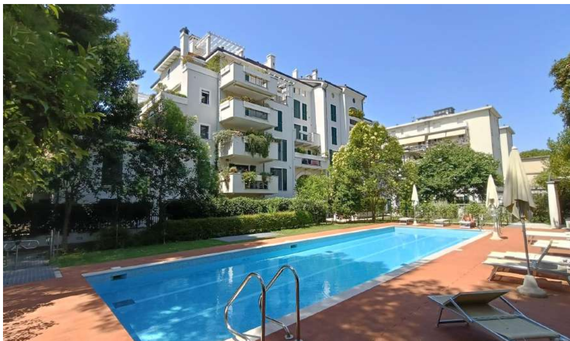
AREA RELAX E PISCINA CONDOMINIALE NELLA CORTE COMUNE