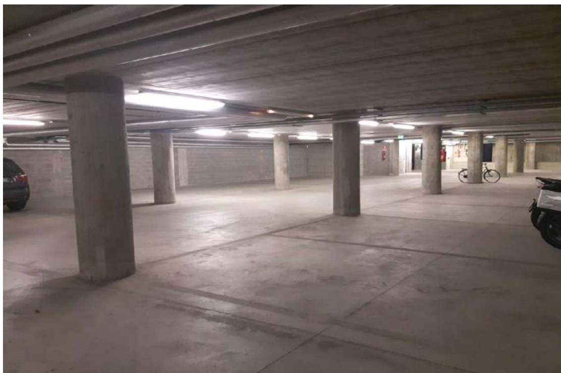
P2° INTERRATO – SUB 78 - POSTO AUTO COPERTO