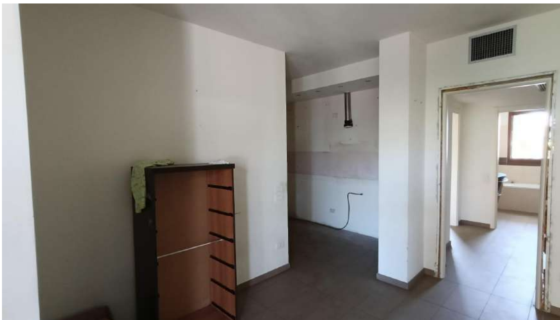
APPARTAMENTO SUB 17: CAMERA