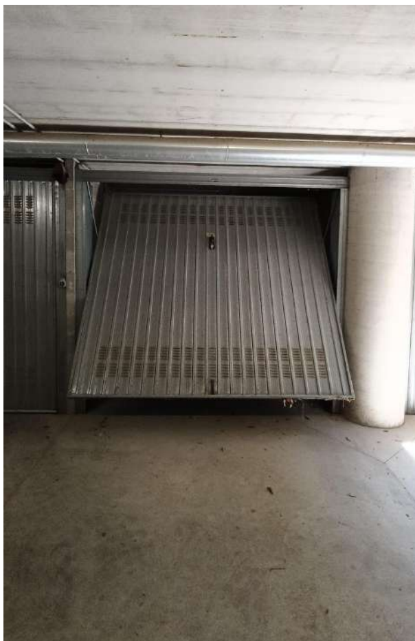
P1° INTERRATO – SUB 35 - GARAGE