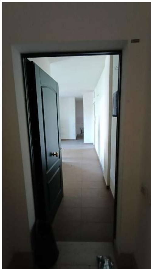
APPARTAMENTO SUB 17 PIANO 2°