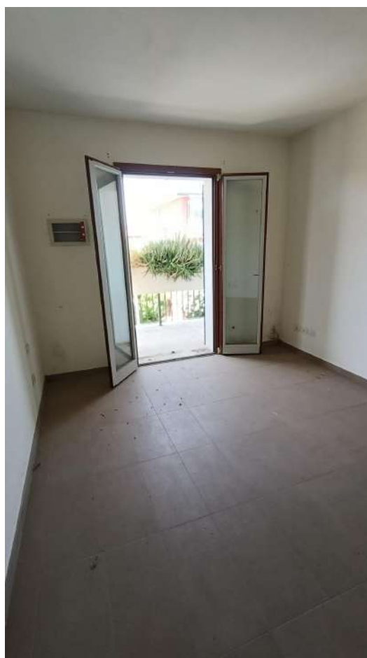
APPARTAMENTO SUB 17: BAGNO E CAMERA