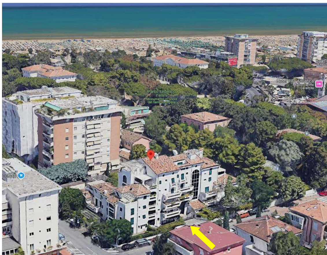
IMMAGINE SATELLITARE 3D – ACCESSO AL FABBRICATO DA VIA RUGGERO BALDINI