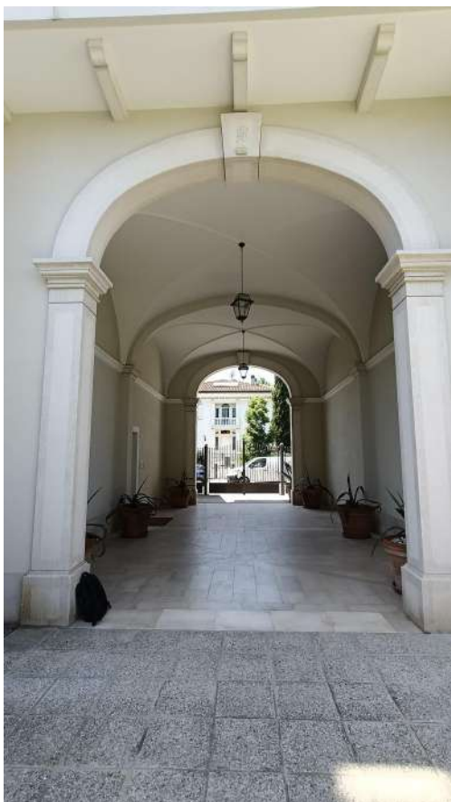
PARTICOLARE INGRESSO CONDOMINIALE "RESIDENCE REX"