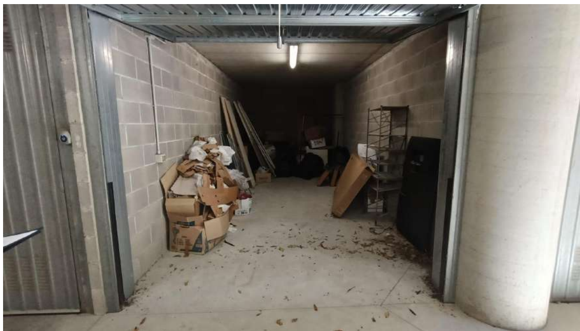
P1° INTERRATO – SUB 35 - GARAGE