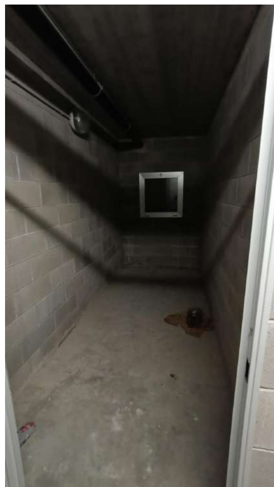
P2° INTERRATO – SUB 17 CANTINA