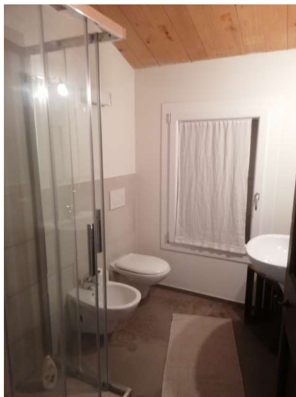
Vista ambienti piano primo