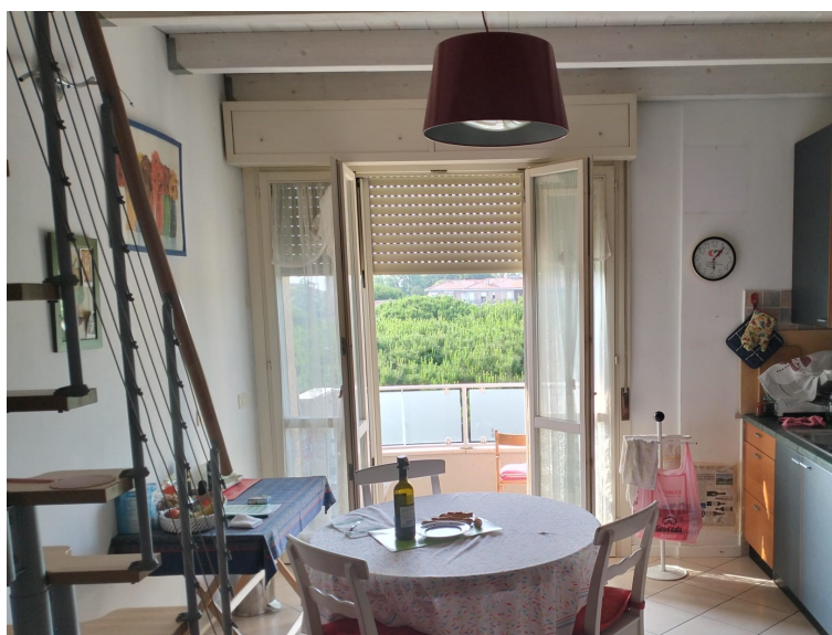
SOGGIORNO CON ANGOLO COTTURA