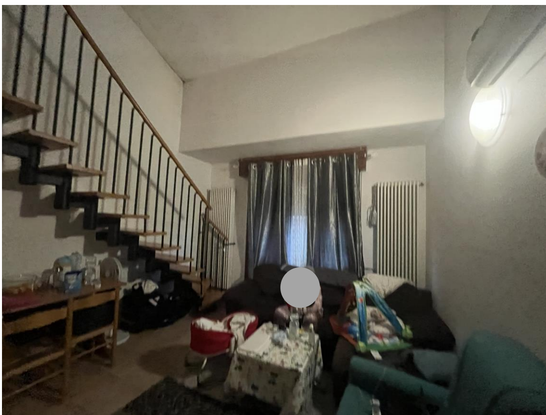
Vano ufficio adibito a soggiorno