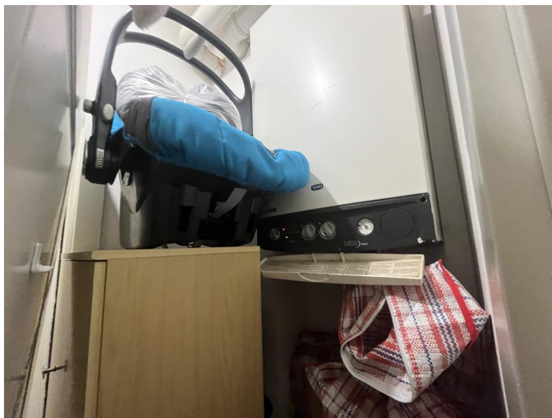
Caldaia posta nel disimpegno