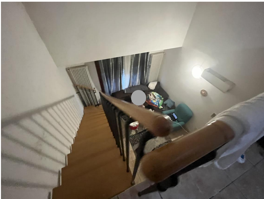
Scala di accesso al sottotetto