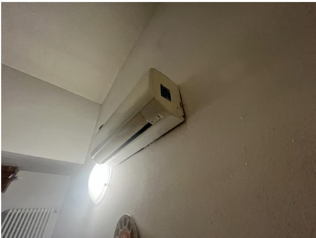
Split condizionamento posto nel vano ufficio