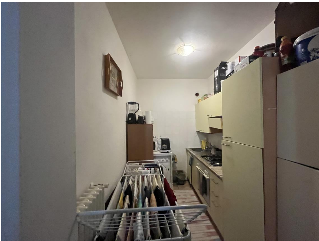
Angolo cottura nel vano ufficio