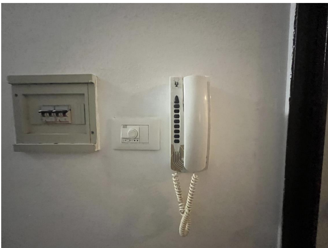
Quadro elettrico, termostato e citofono posti nell'ingresso