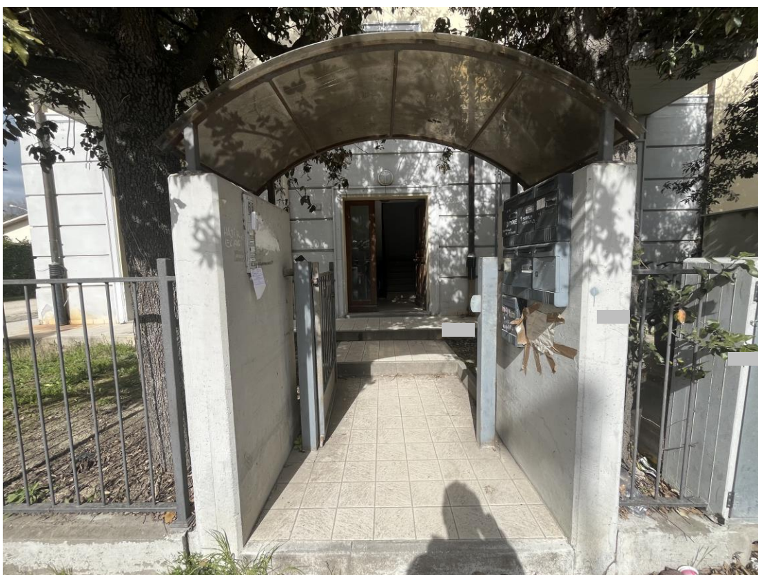
Ingresso pedonale comune