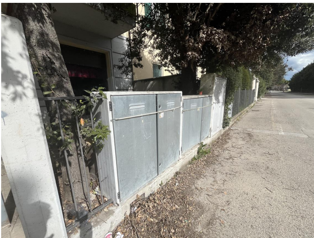
Contatori posti sulla recinzione esterna fronte strada