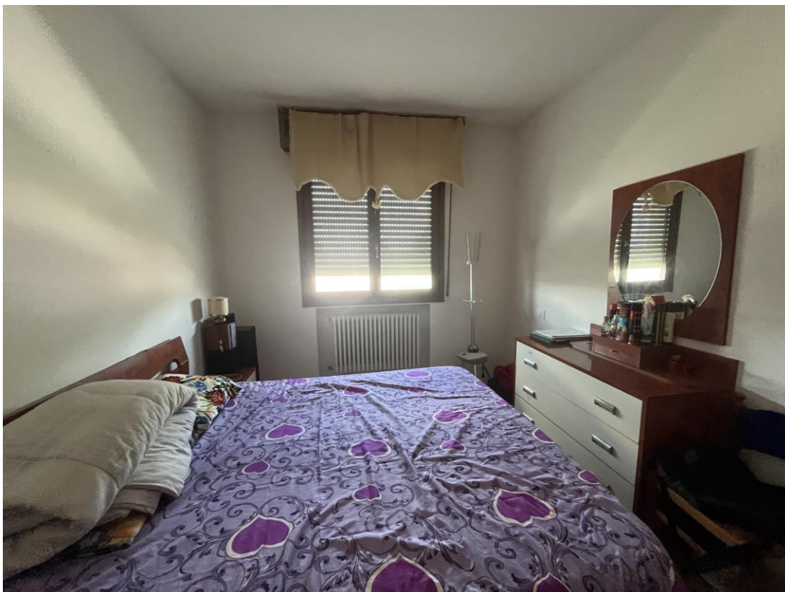
Vano ufficio secondario attualmente utilizzato a camera da letto