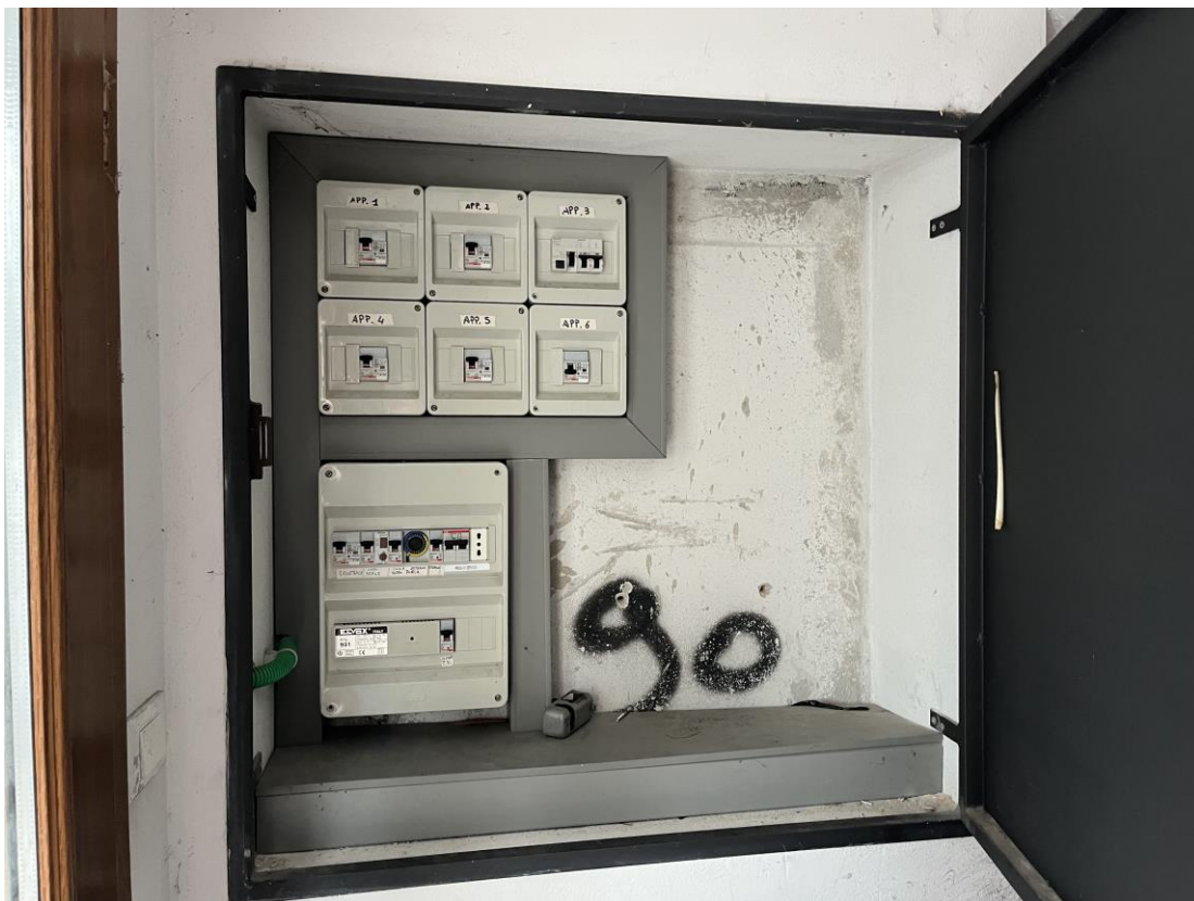
Quadri elettrici posti al piano terra nel vano scala comune