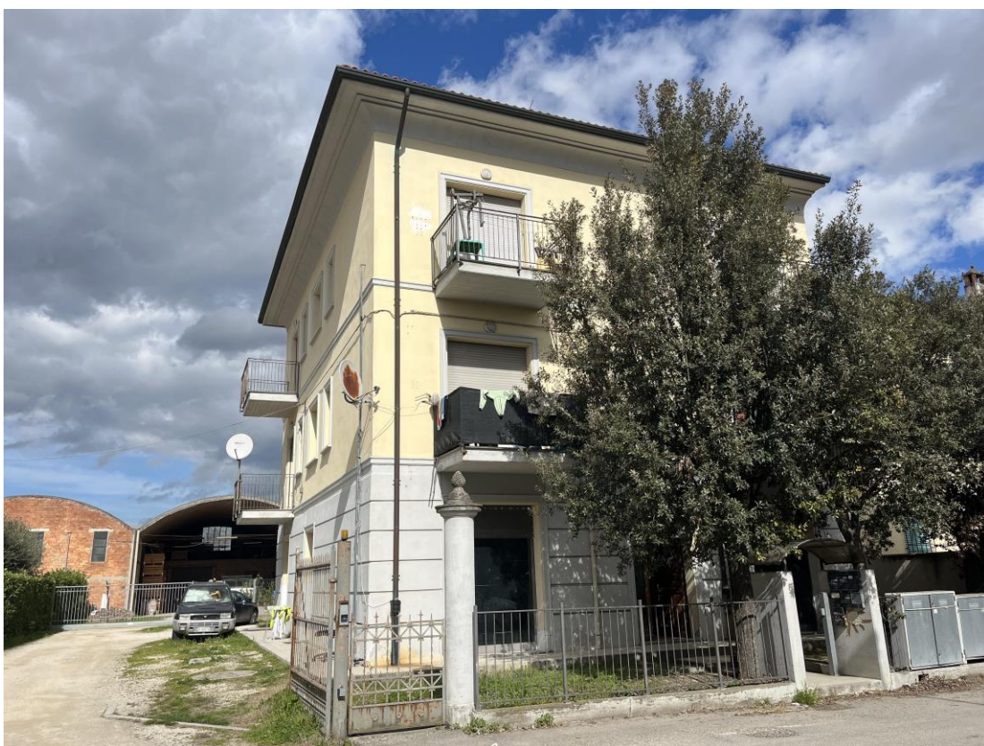
Fabbricato da via della Libertà (fronte sud)