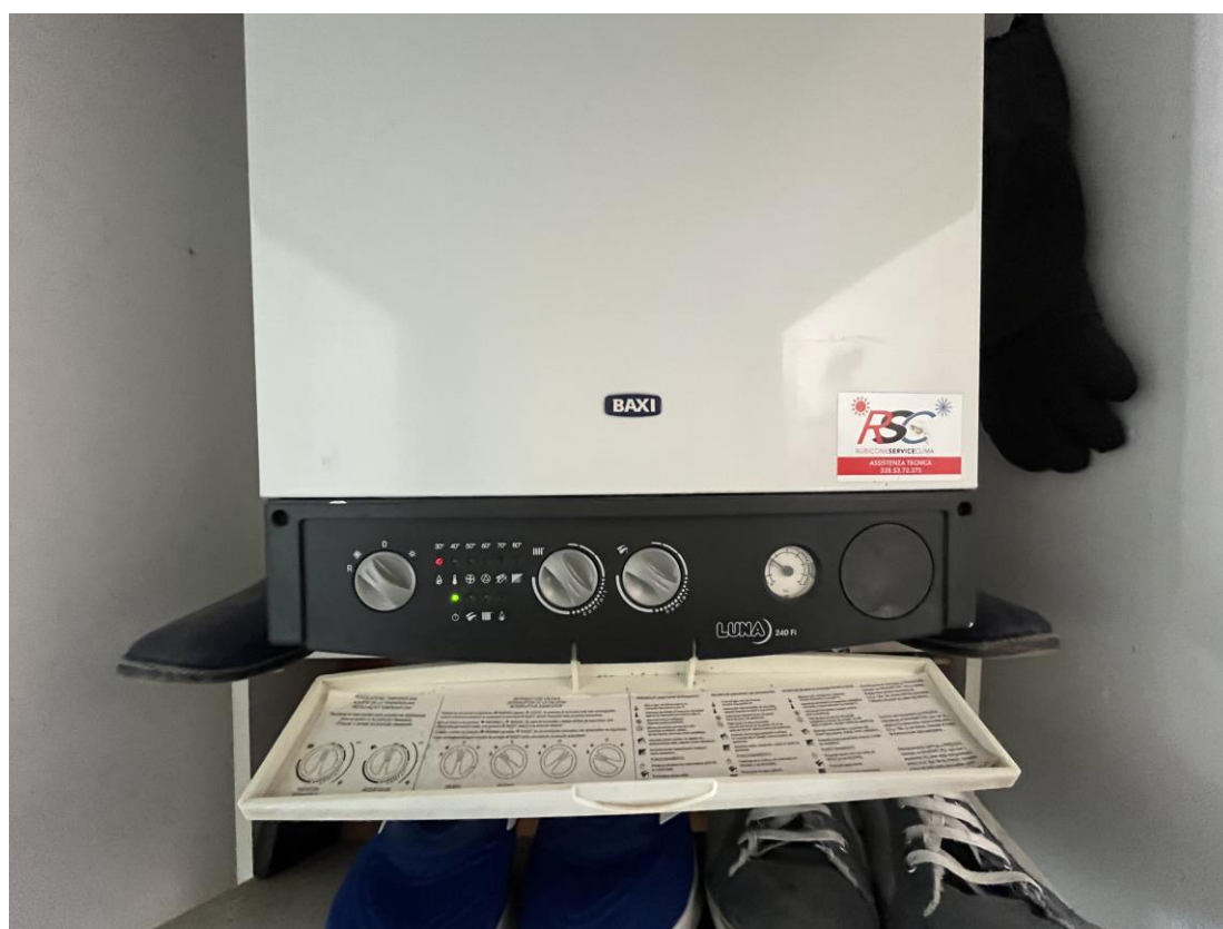
Caldaia posta nel disimpegno