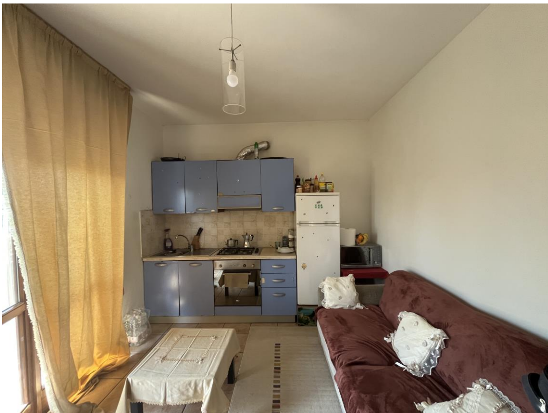
Vano ufficio principale attualmente adibito a soggiorno/cucina