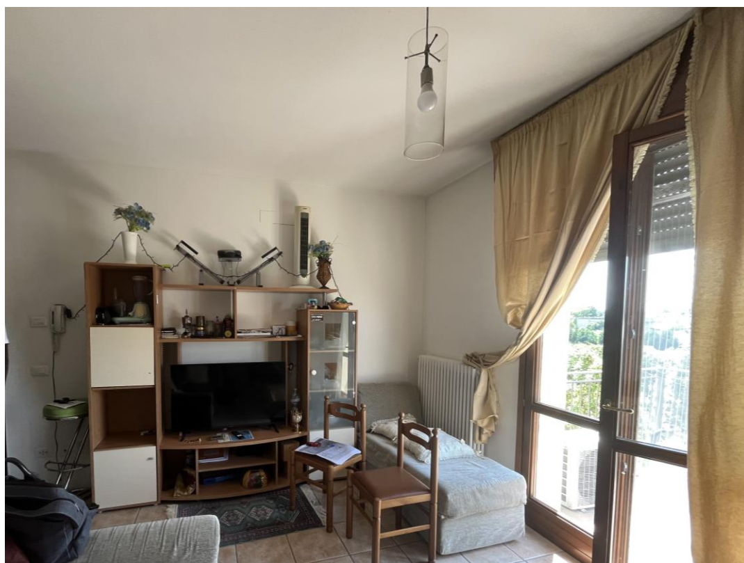
Vano ufficio principale attualmente adibito a soggiorno/cucina