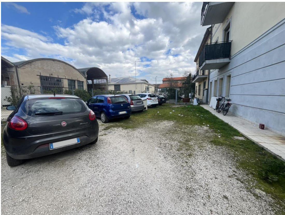
Area comune retrostante il fabbricato