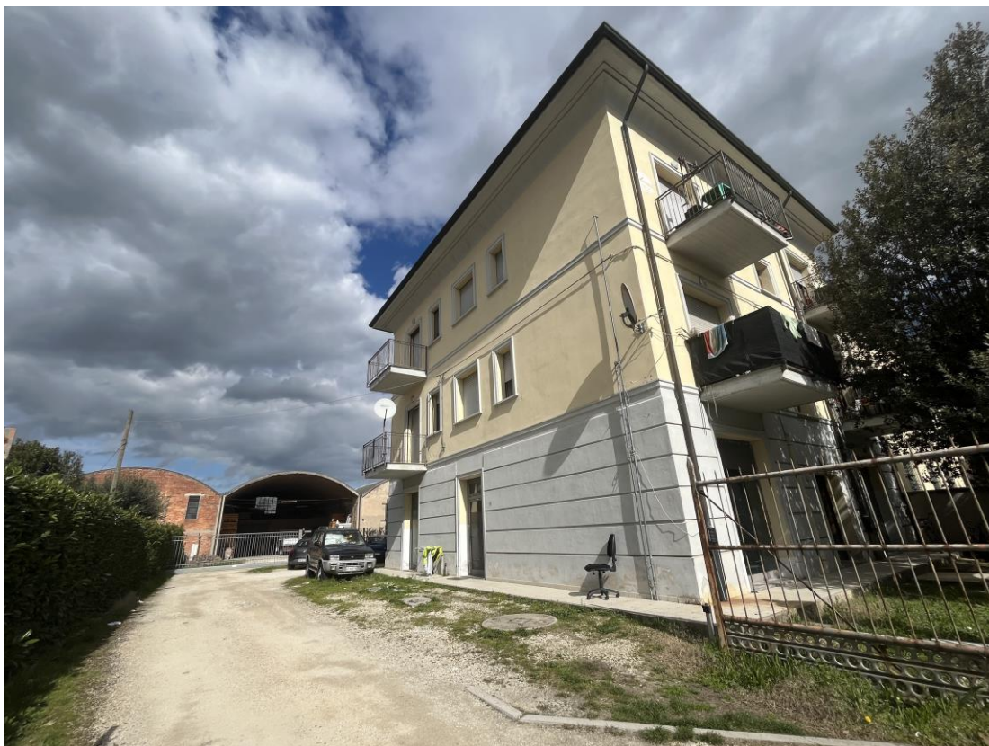
Fabbricato da via della Libertà (fronte ovest)