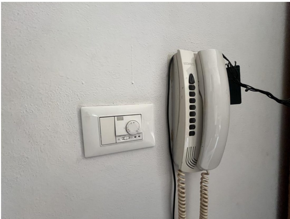
Termostato e citofono posti nell'ingresso