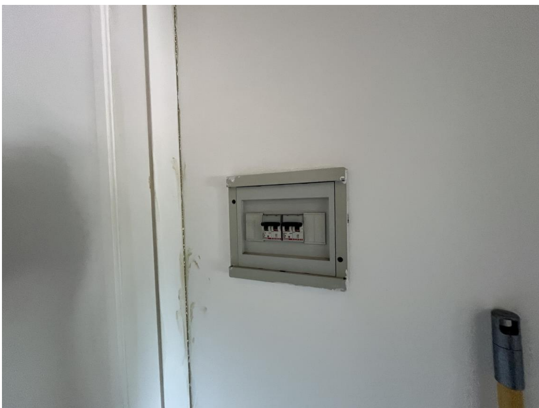
Quadro elettrico posto nel disimpegno