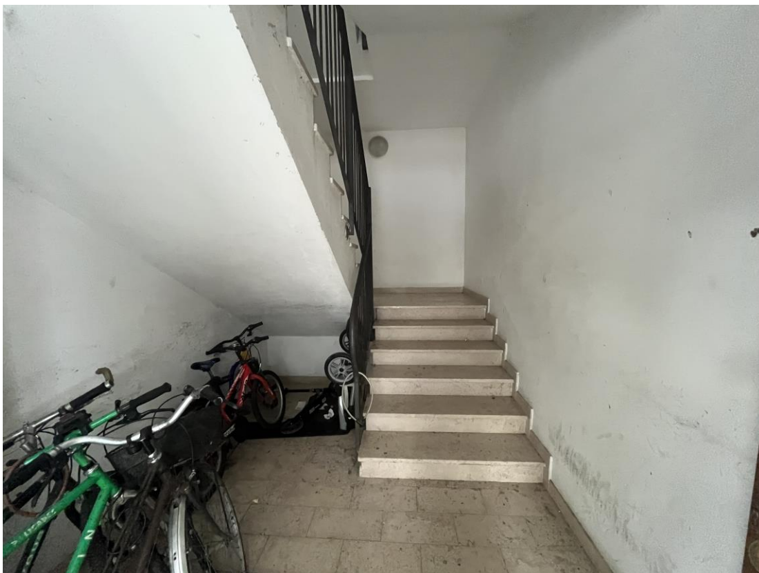
Ingresso piano terra e scala comune