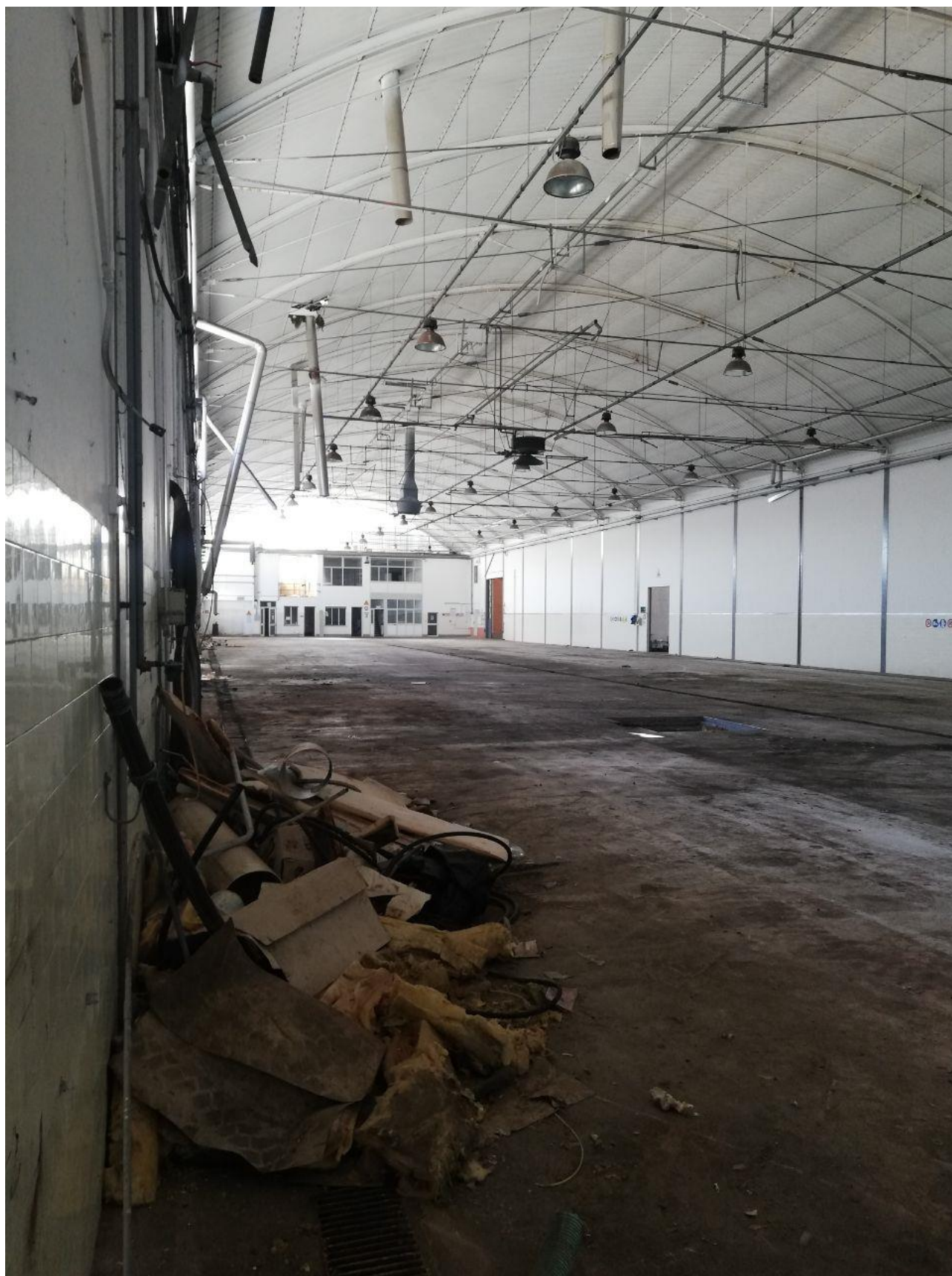
Figura 13 FOGLIO 103 MAPP. 257 SUB 6