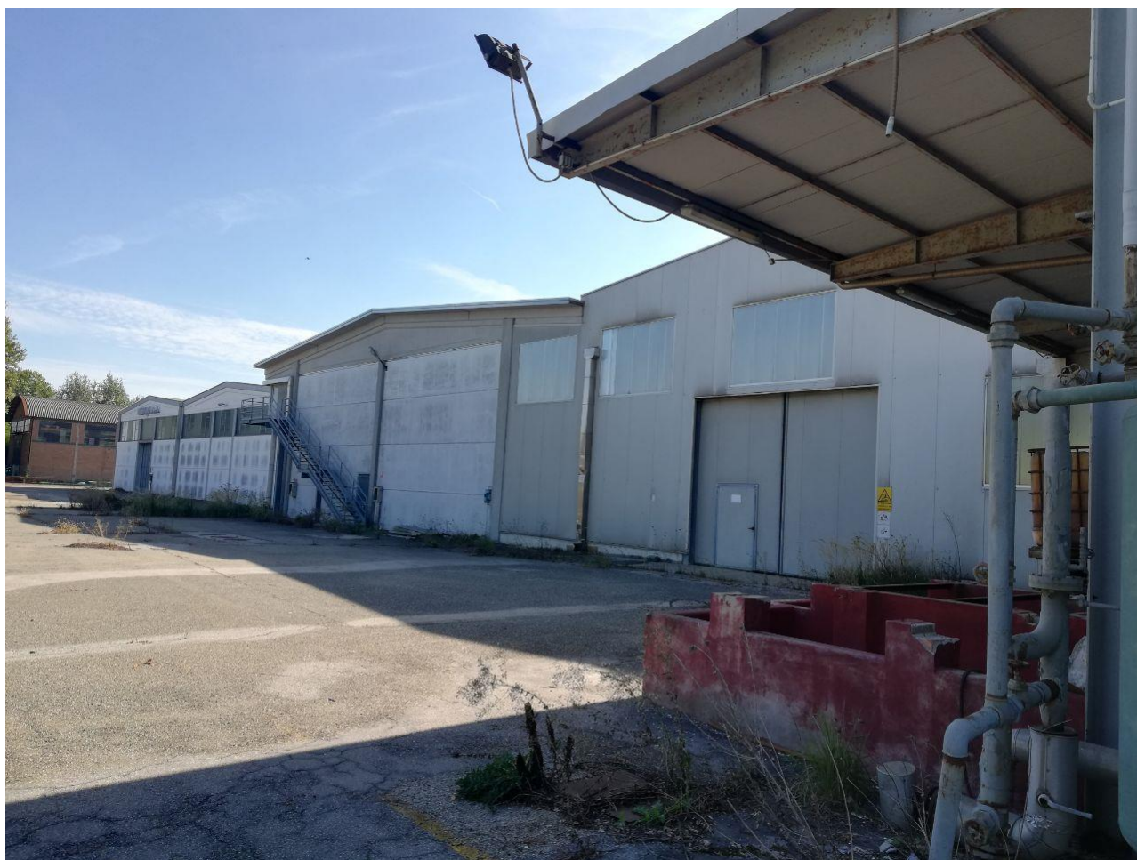
Figura 16 FOGLIO 103 MAPP. 257