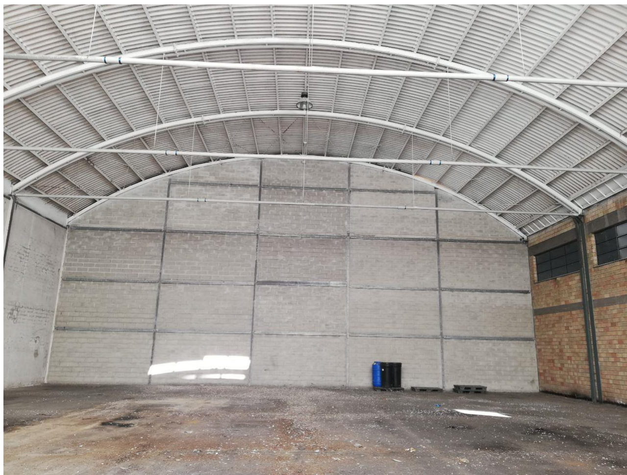
Figura 18 FOGLIO 103 MAPP. 257 SUB 7