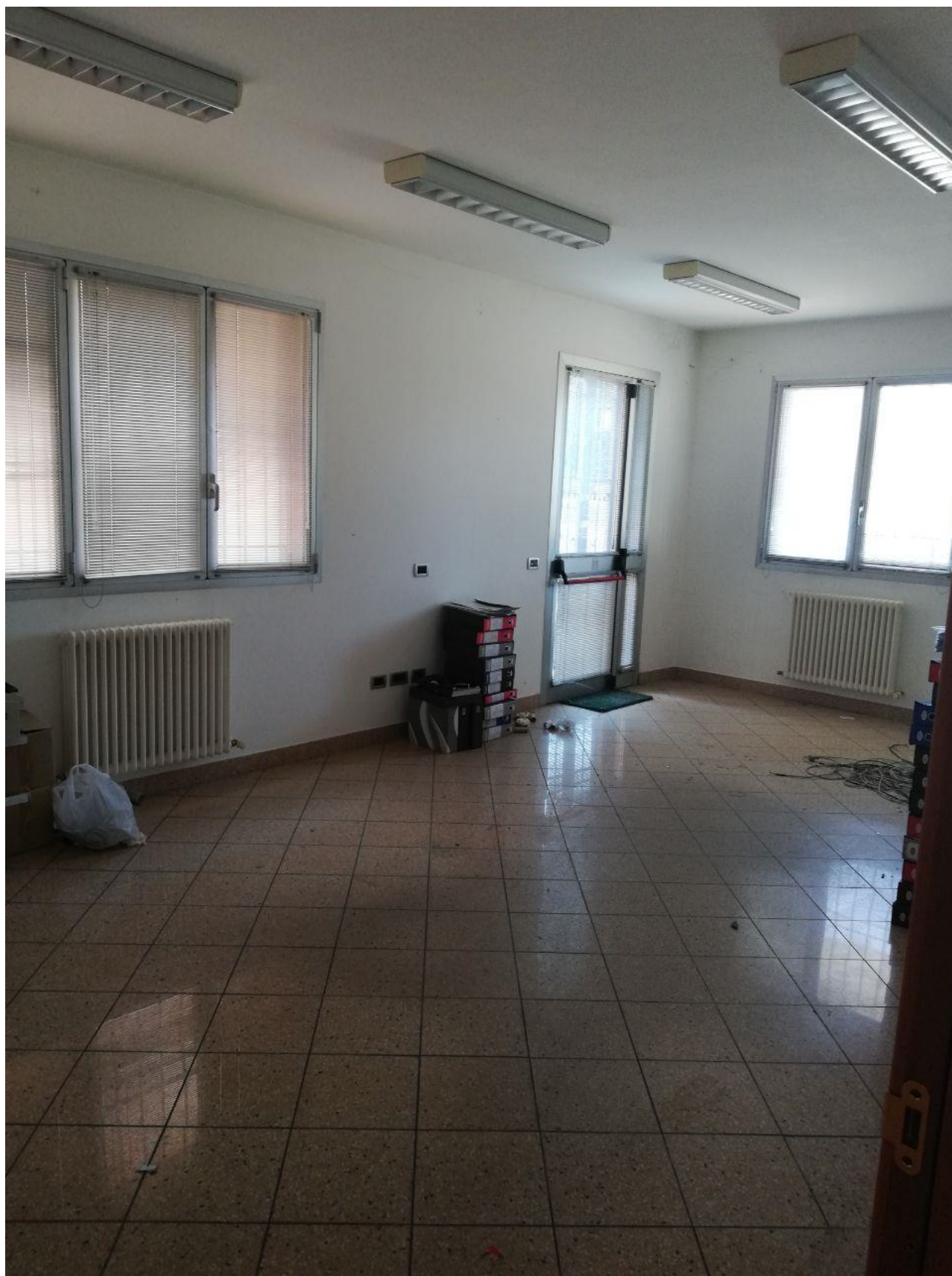
Figura 4 INTERNO FOGLIO 103 MAPP. 257 SUB 7 PT