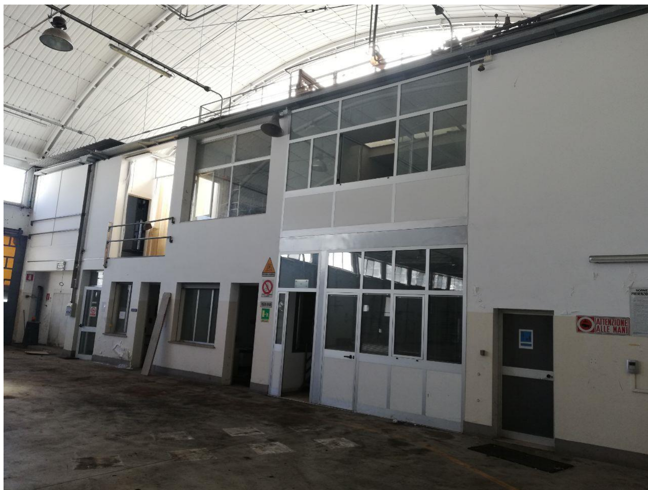
Figura 5 INTERNO FOGLIO 103 MAPP. 257 SUB 6 E VISAT SUB 7