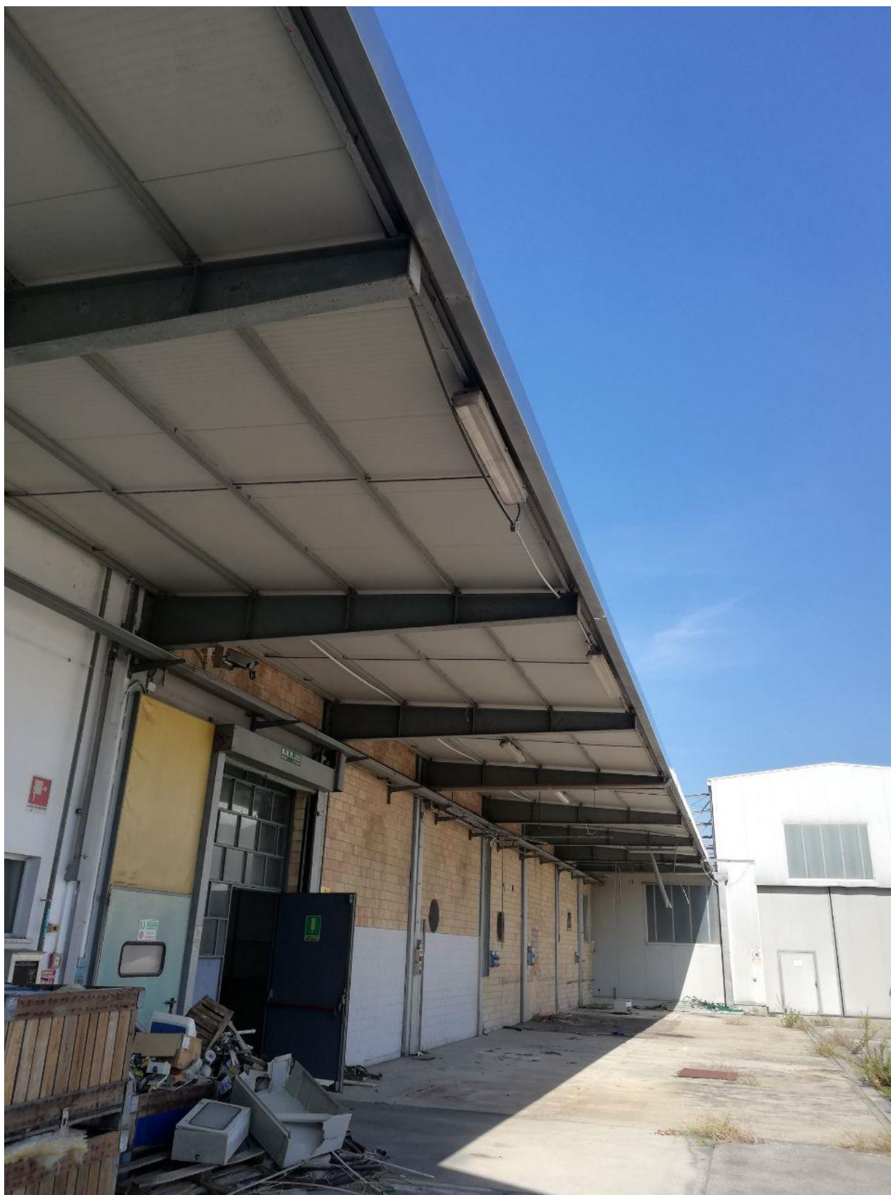
Figura 11 FOGLIO 103 MAPPALE 257