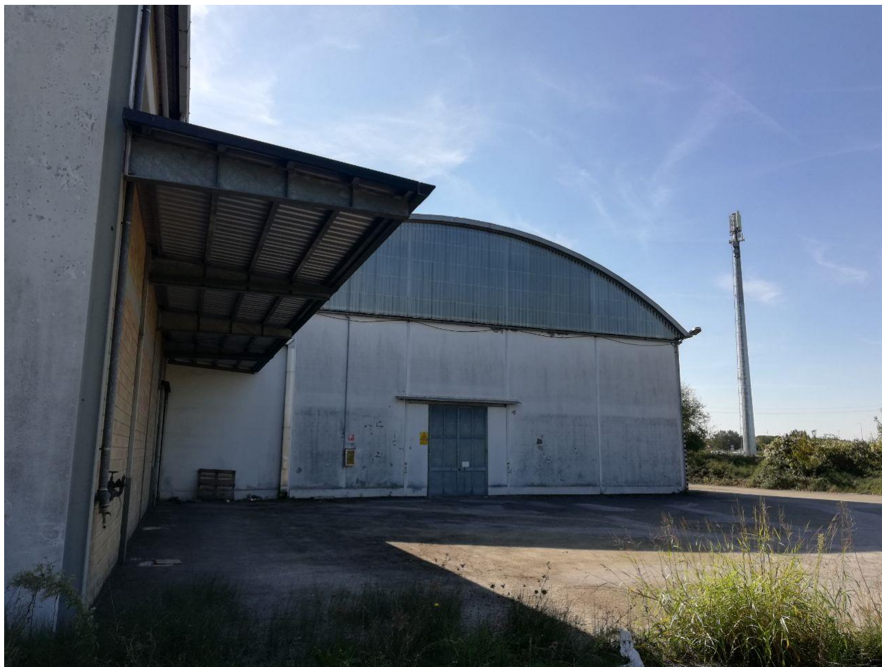
Figura 15 FOGLIO 103 MAPP. 257