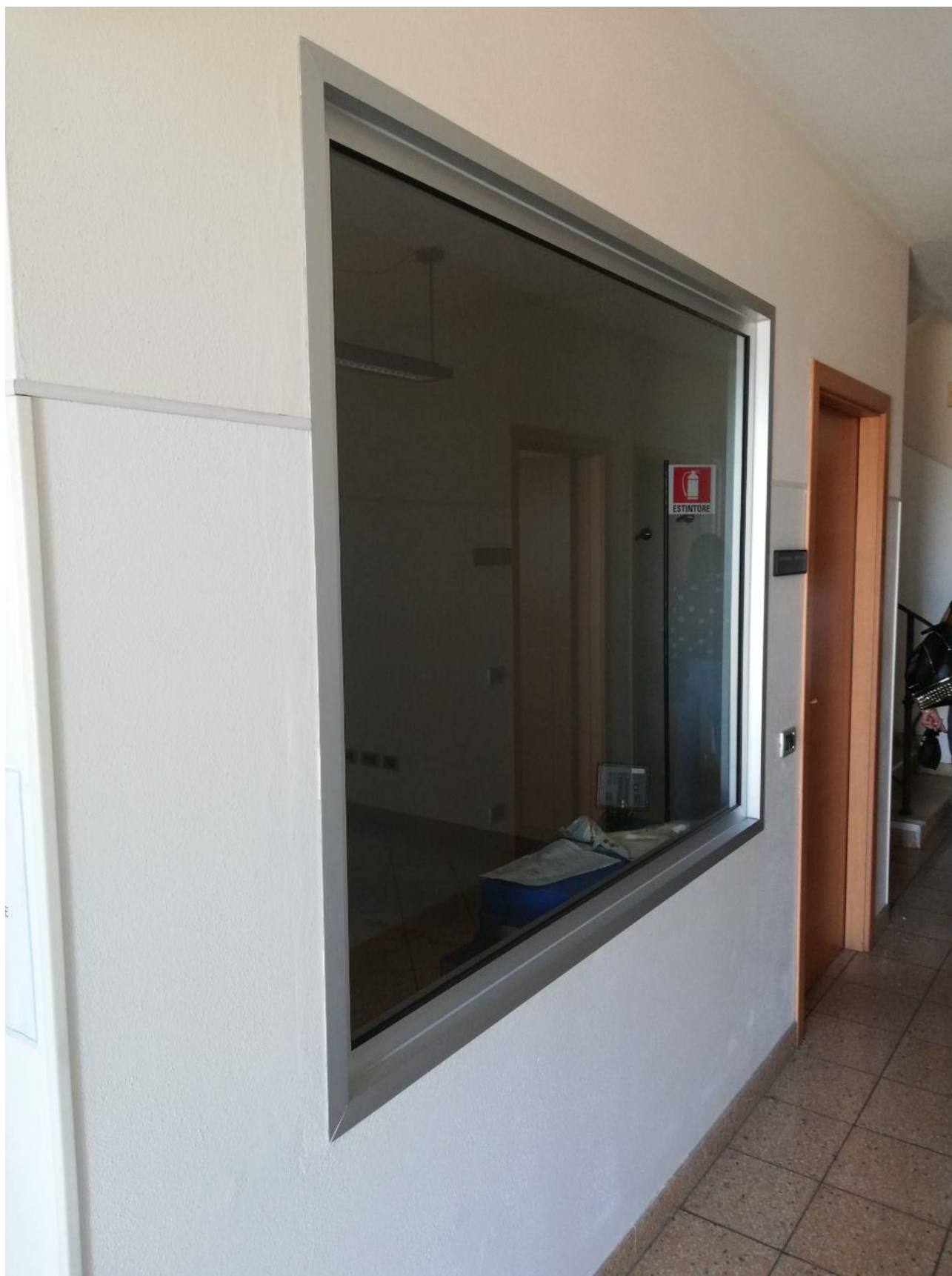
Figura 3 INTERNO FOGLIO 103 MAPP. 257 SUB 7 PT