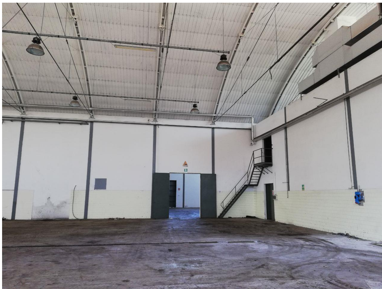
Figura 14 FOGLIO 103 MAPP 257 SUB 6