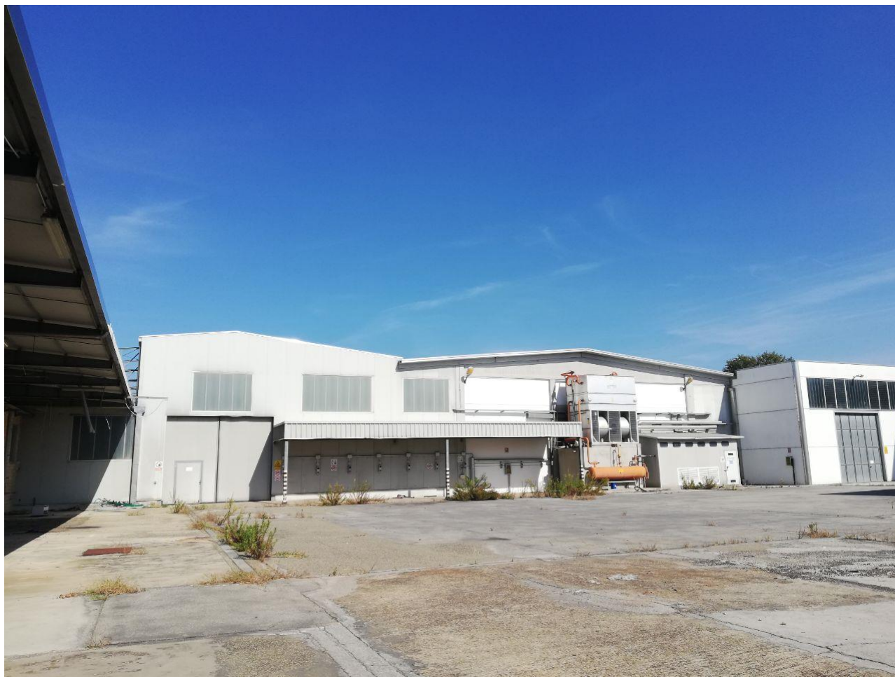
Figura 9 FOGLIO 103 MAPP. 257