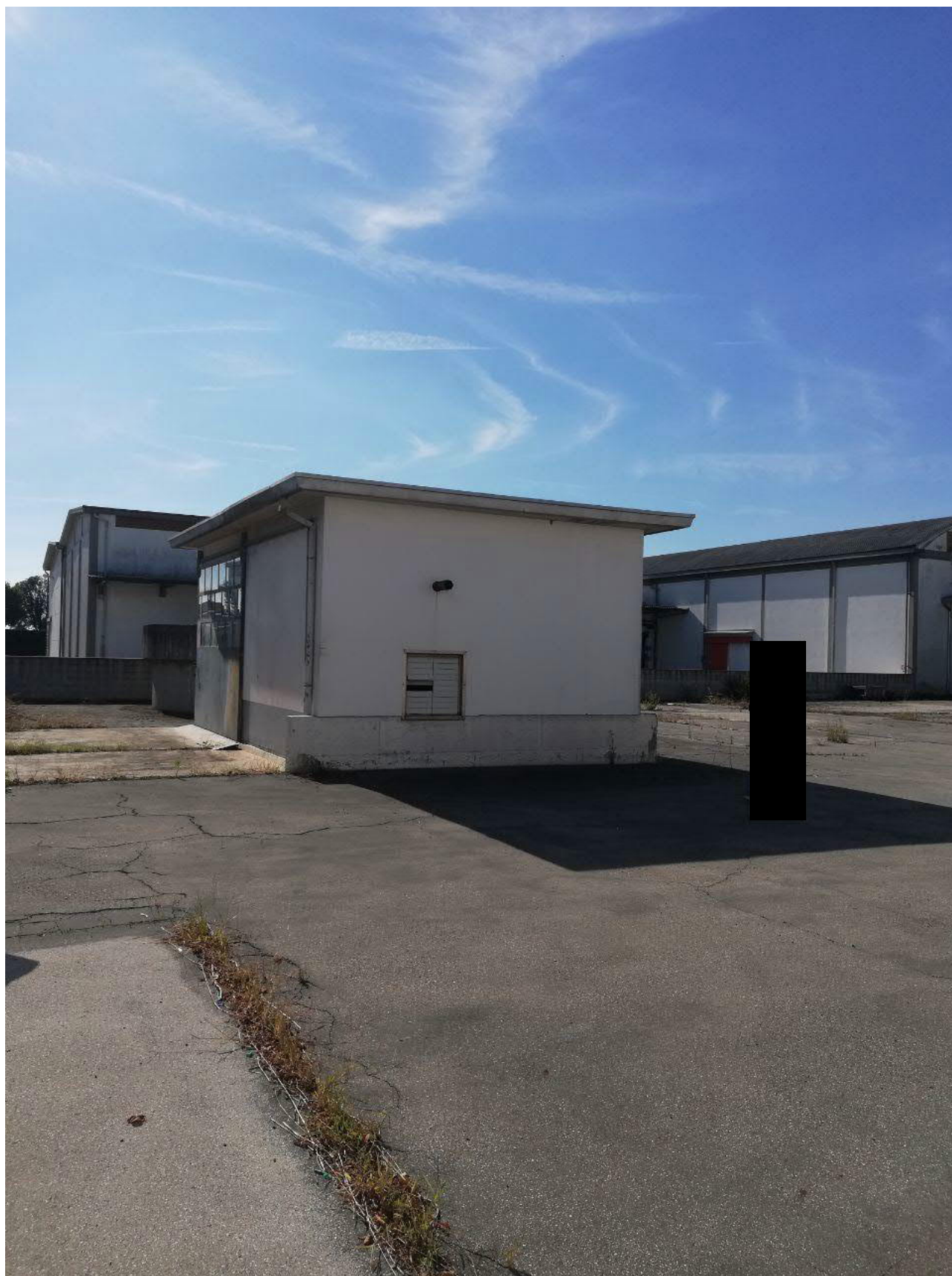
Figura 17 GRUPPO ELETTOGENO