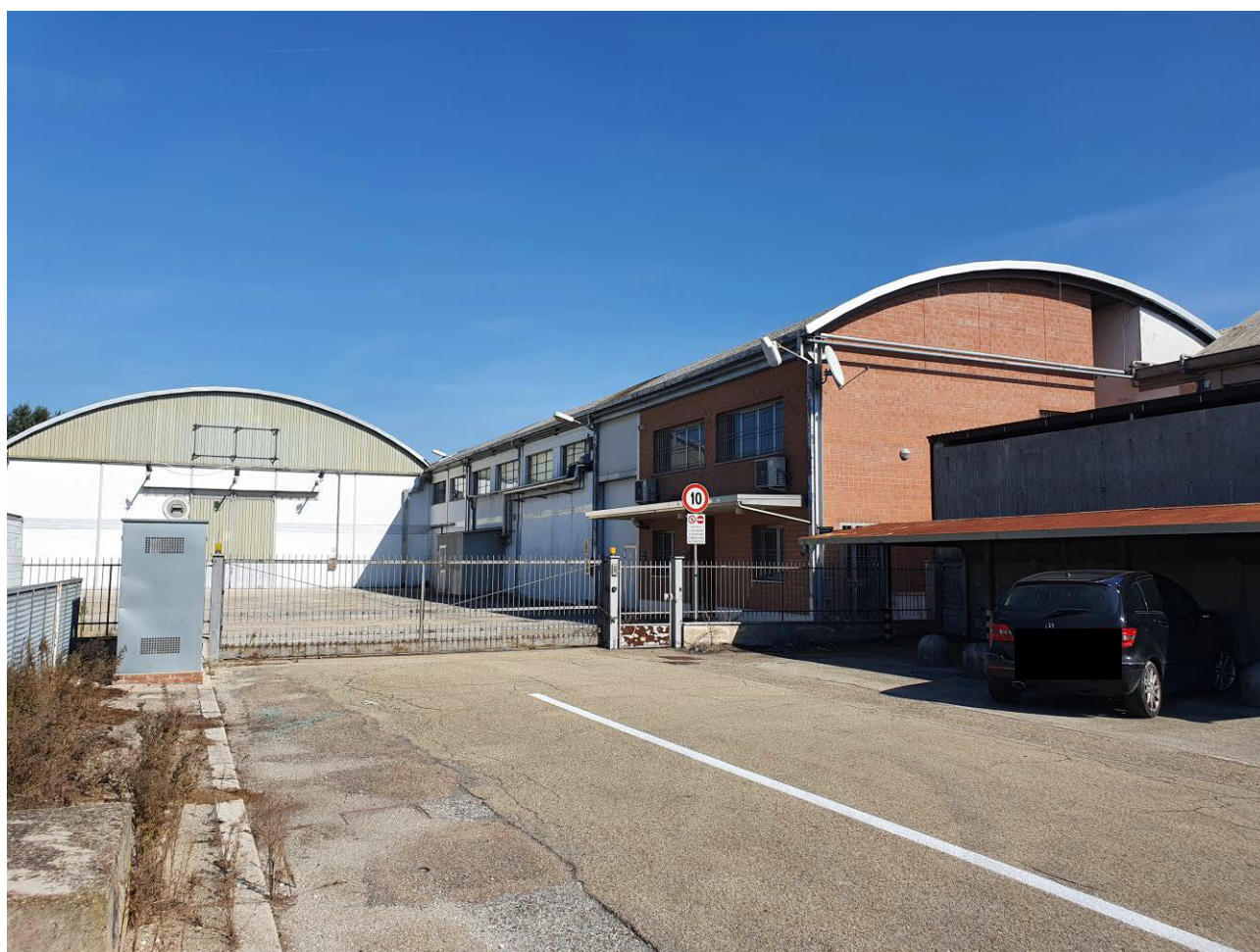
Figura 1 IL MAPPALE 257