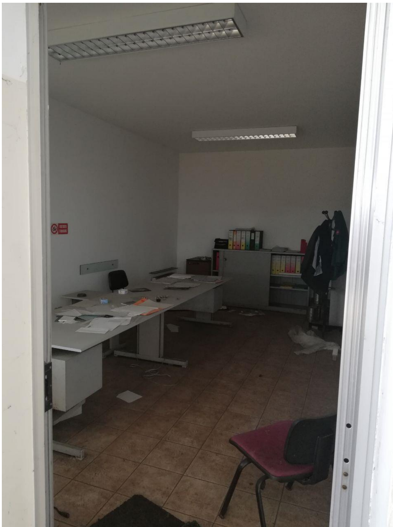
Figura 6 INTERNO FOGLIO 103 MAPP. 257 SUB 7