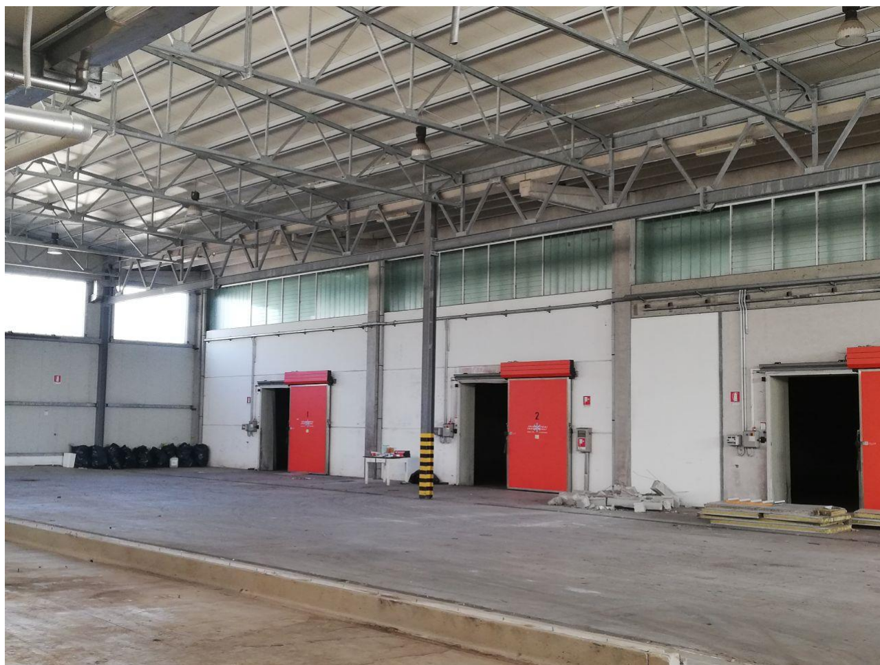
Figura 10 FOGLIO 103 MAPP. 257 SUB 4