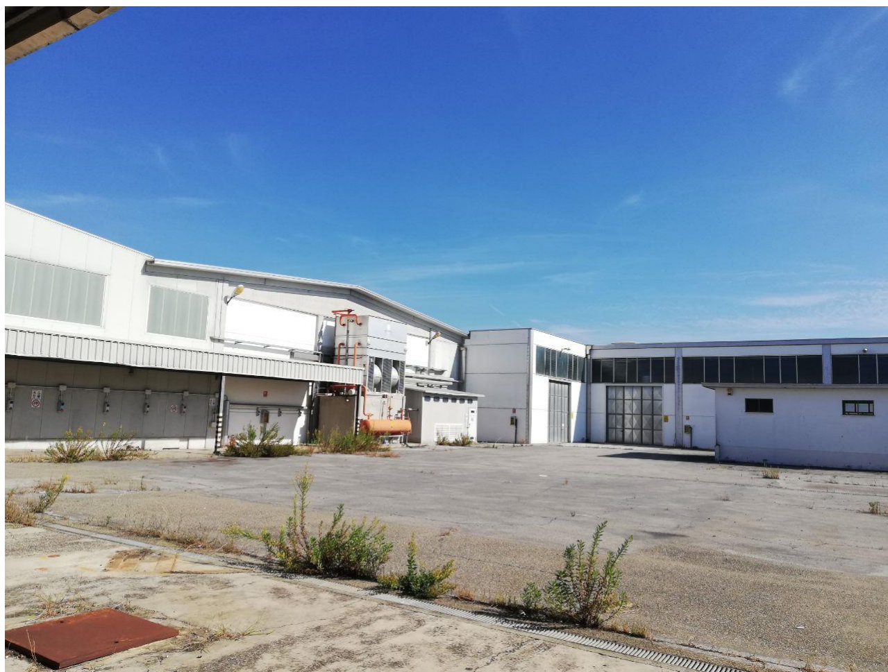
Figura 7 FOGLIO 103 MAPP. 257