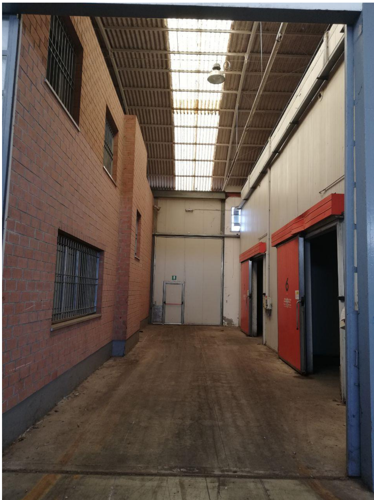
Figura 8 FOGLIO 103 MAPP. 257 SUB 6 CAPANNONE