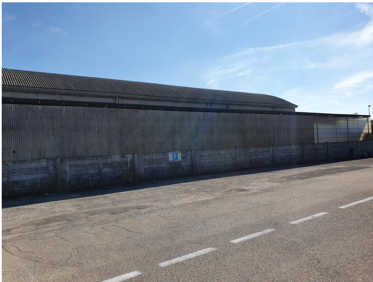
Figura 2 FIANCO FOGLIO 103 MAPP. 257 SUB 6/7