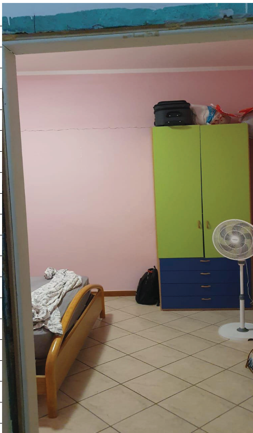
Figura 8 CAMERA LETTO