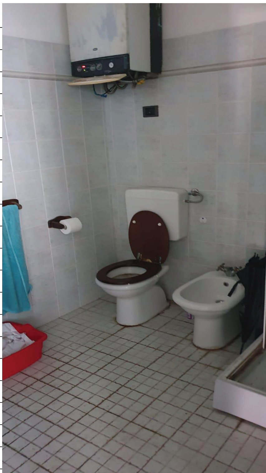
Figura 9 BAGNO