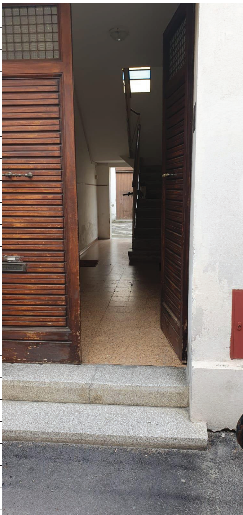
Figura 2 INGRESSO COMUNE