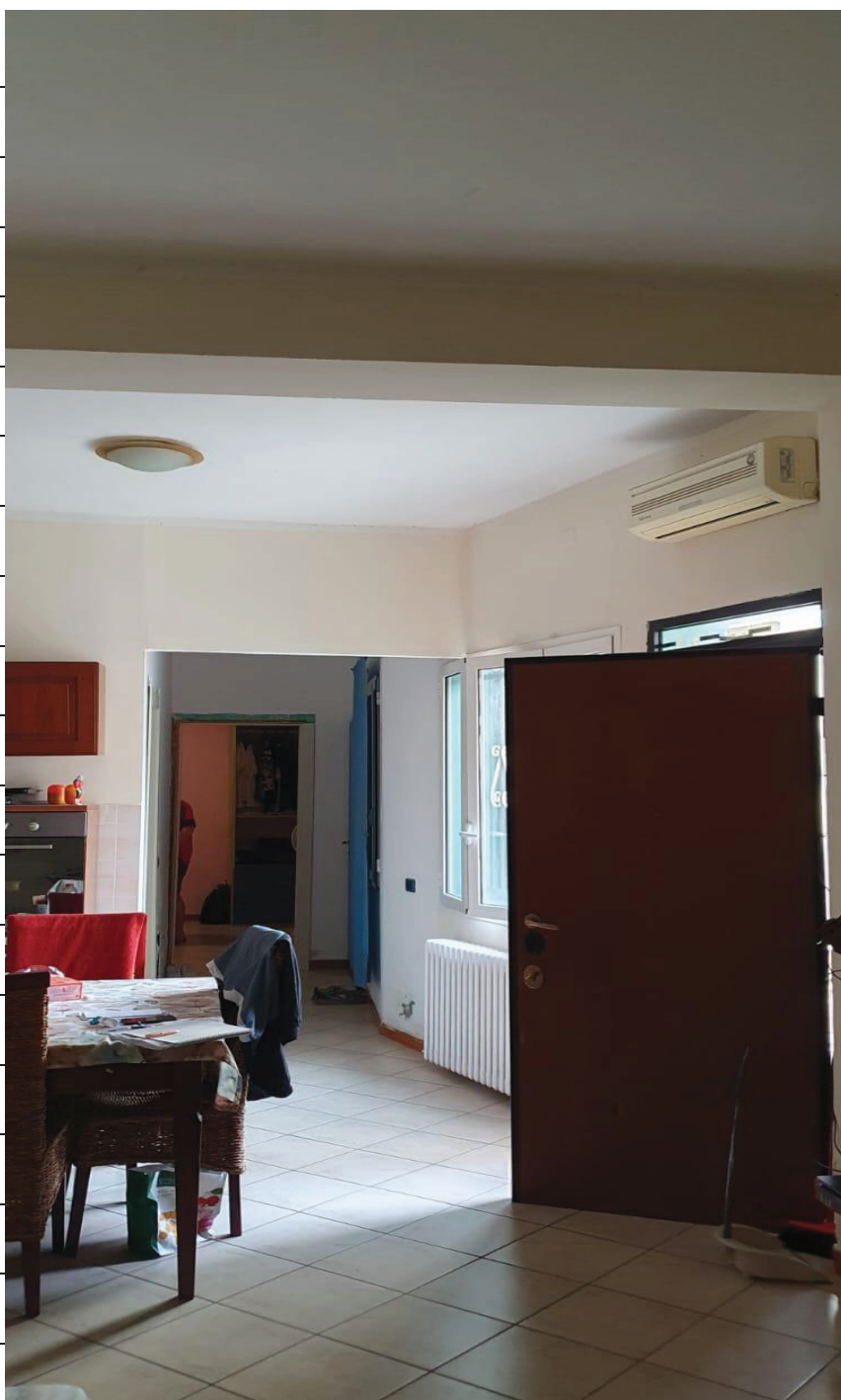
Figura 5 SOGGIORNO