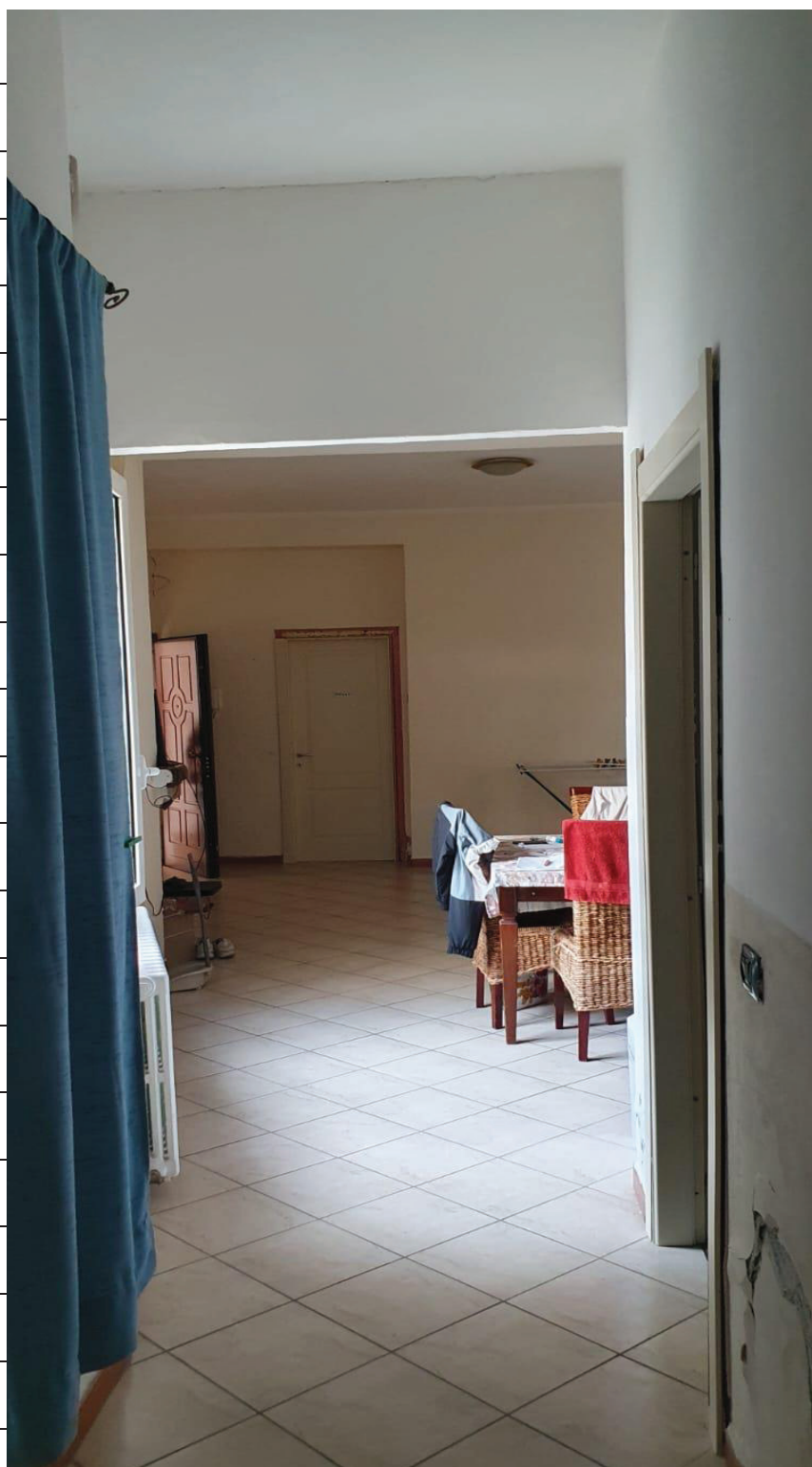
Figura 6 SOGGIORNO