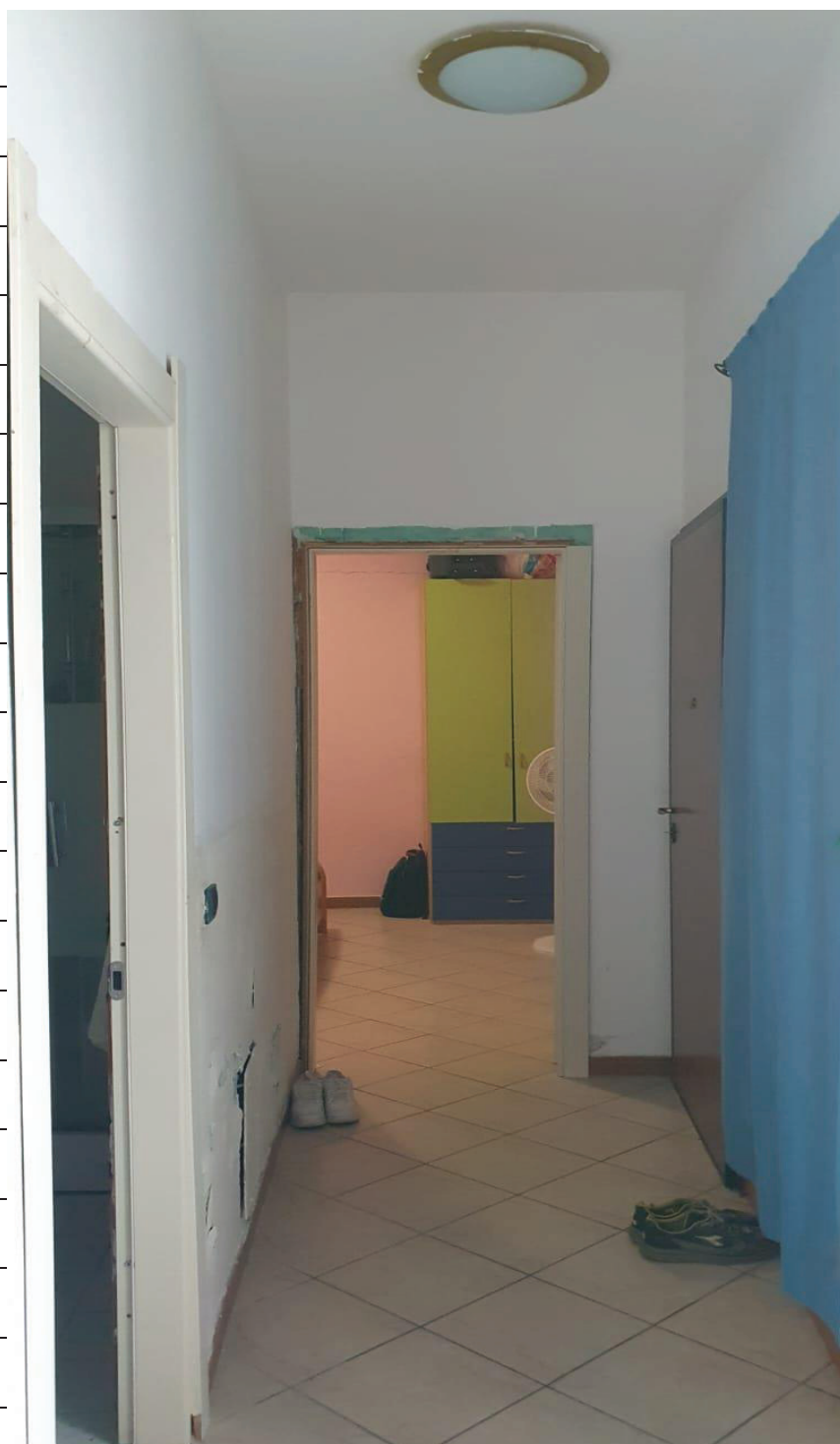
Figura 7 CORRIDOIO