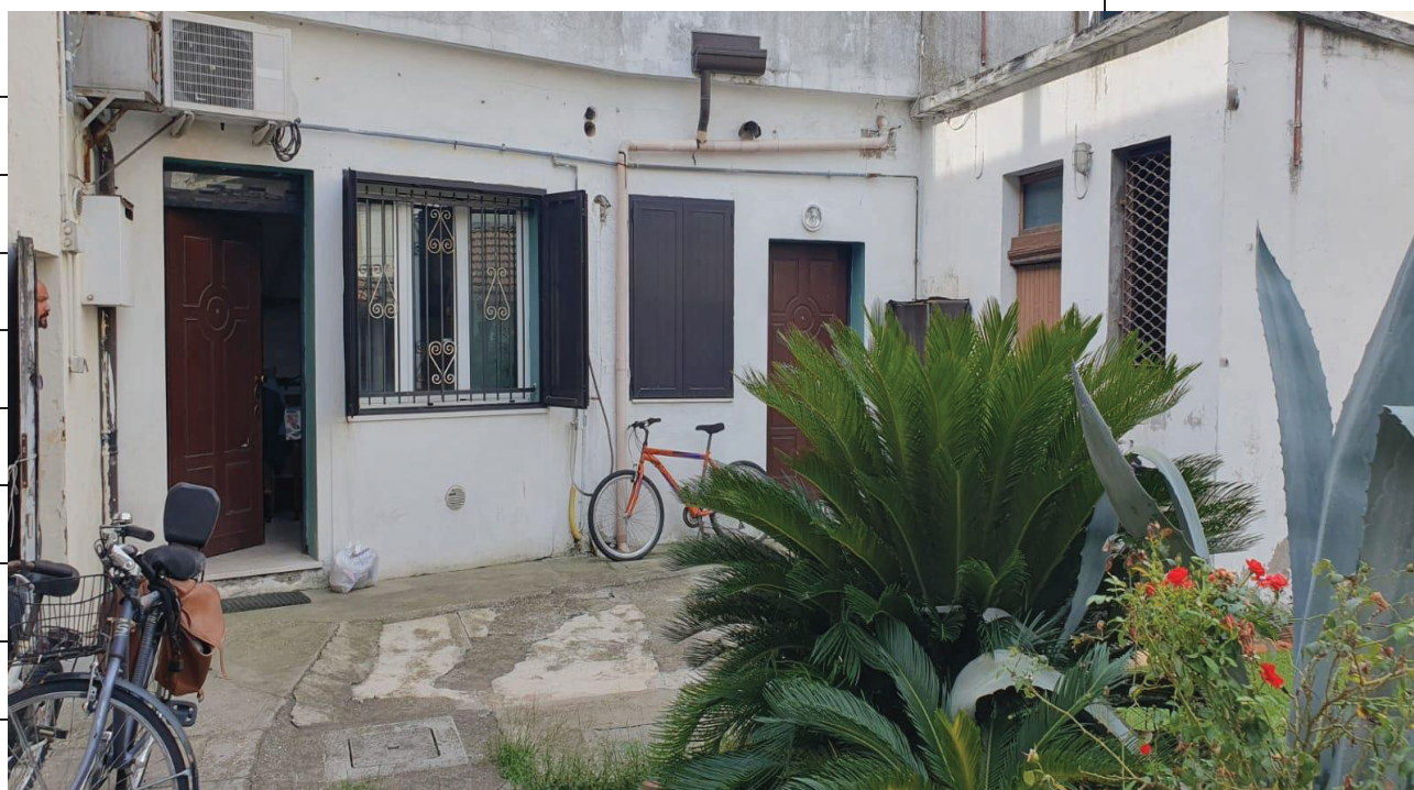
Figura 3 CORTE COMUNE