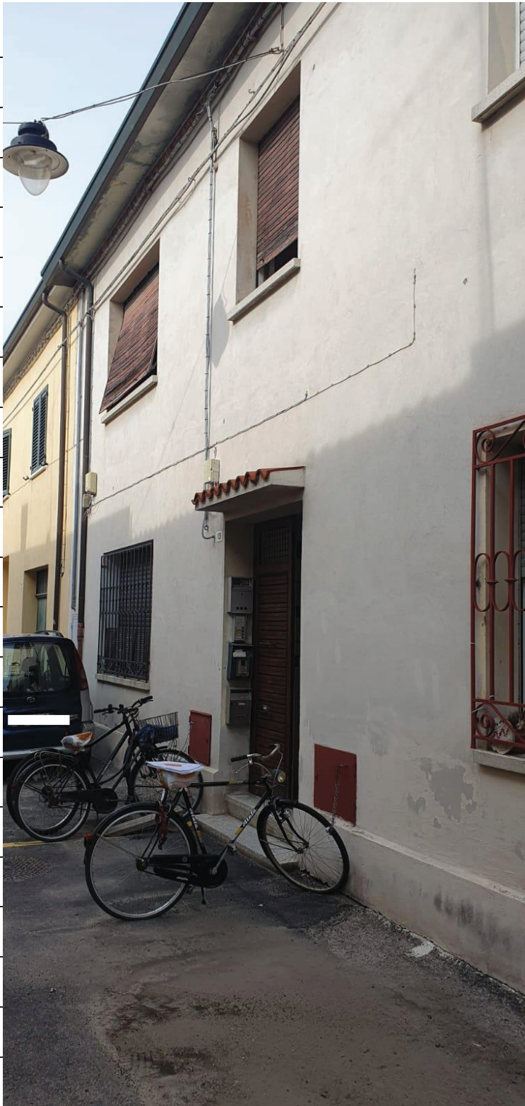
Figura 1 INGRESSO DA VIA DANTONA