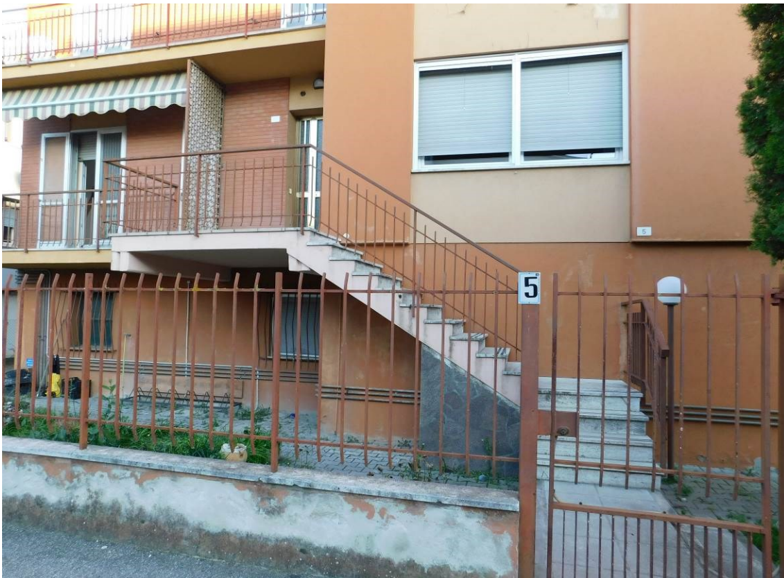
Foto 6 – Particolare da Via Totila della scala esterna di accesso allo stabile.