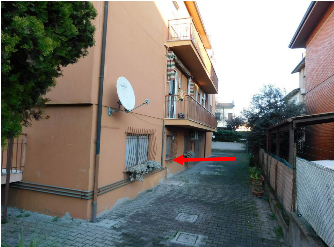
Foto 5 – Vista del complesso condominiale da corte esterna pertinenziale.