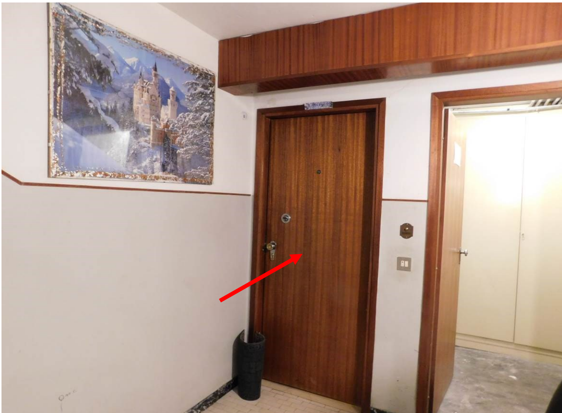
Foto 8 – Particolare accesso all'abitazione da corridoio comune PT.