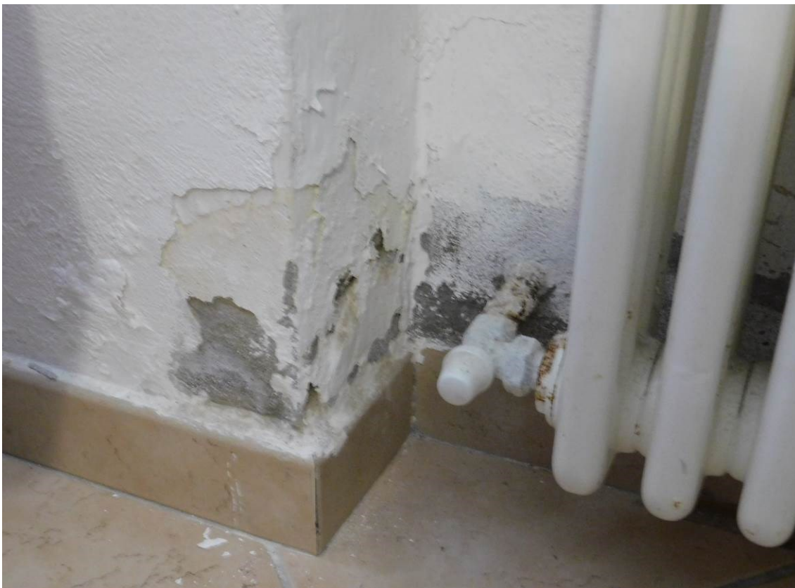
Foto 13 – Interno abitazione – Particolare danni alle pareti da umidità di risalita .