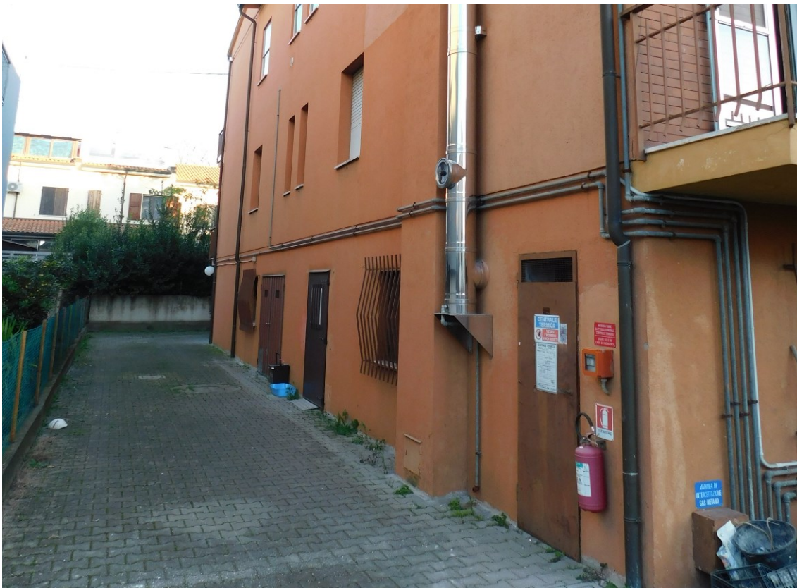
Foto 4 – Vista del complesso condominiale da corte esterna pertinenziale.