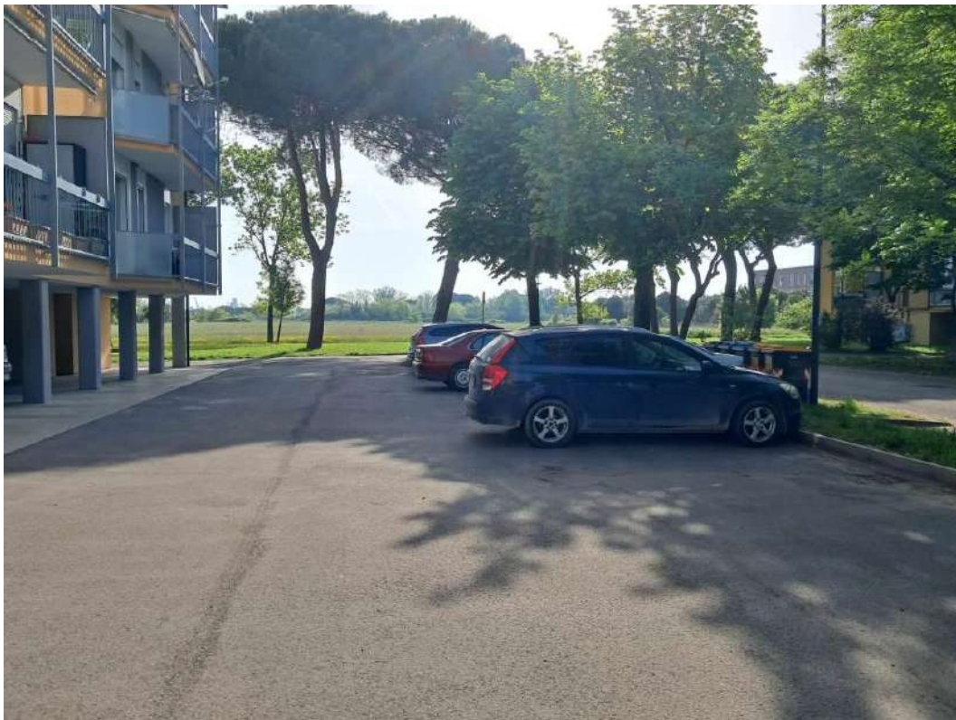
VISTA ESTERNI CONDOMINIO VIA LAGO DI GARDA N. 38 - 44 PARTI COMUNI

D O T T . I N G . G U I D O V I O L A N I