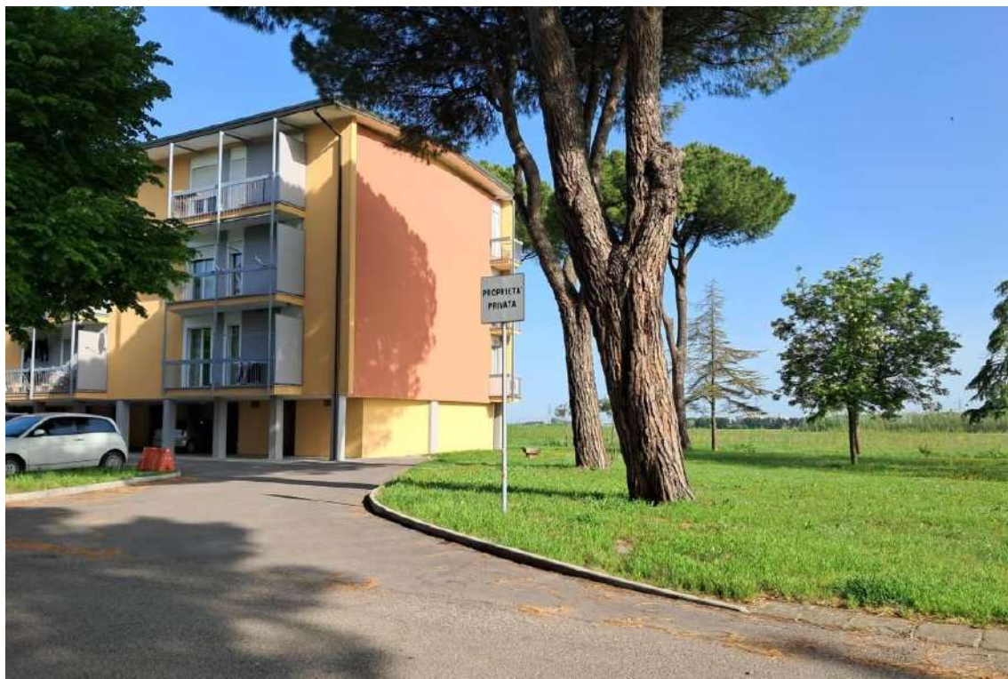
VISTA ESTERNI CONDOMINIO VIA LAGO DI GARDA N. 38 - 44 PARTI COMUNI