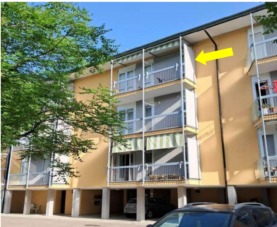
VISTA ESTERNI CONDOMINIO VIA LAGO DI GARDA N. 38 - 44 INDICAZIONE DELL'UNITA' IN OGGETTO UBICATA AL PIANO 3° DEL CIV. 42