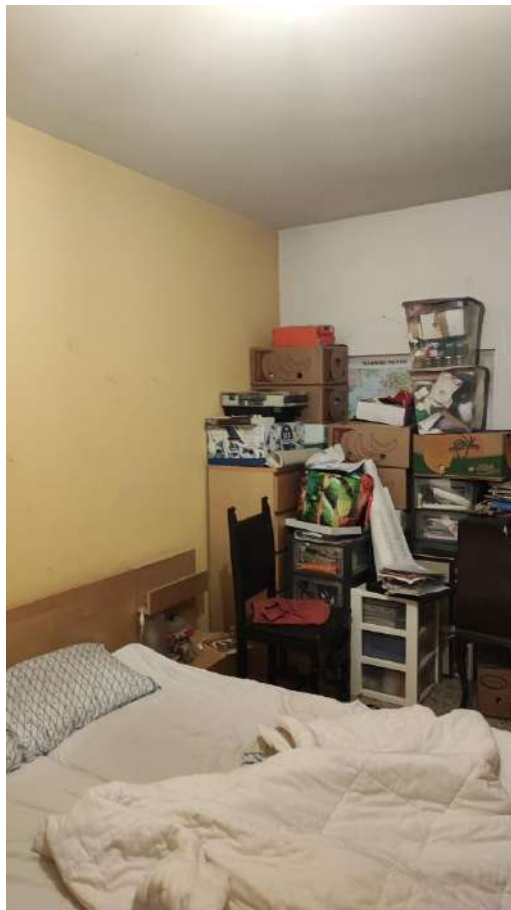
APPARTAMENTO SUB 21 - INTERNO 5 E INTERNO CANTINA AL PIANO TERRA