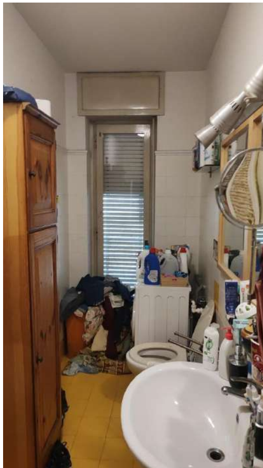
APPARTAMENTO SUB 21 - INTERNO 5