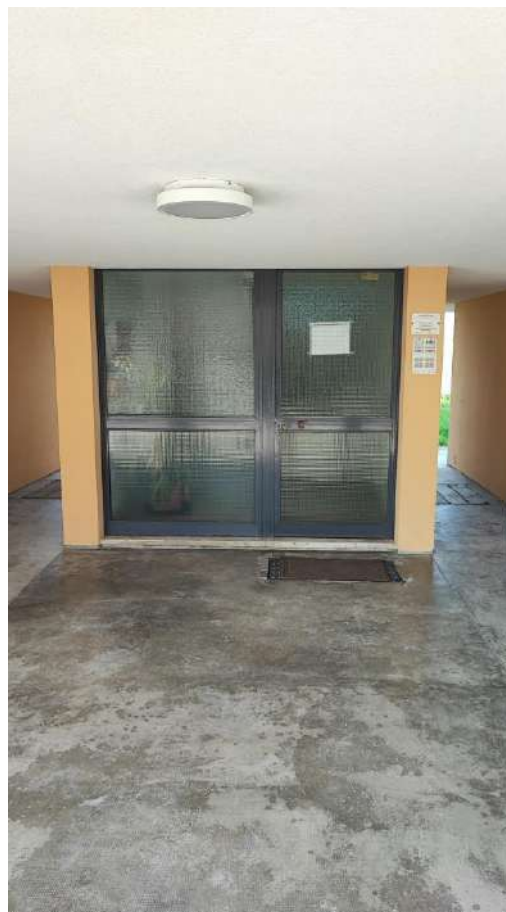
VISTA ESTERNI CONDOMINIO VIA LAGO DI GARDA N. 38 - 44 PARTI COMUNI: PORTICATO E INGRESSO CONDOMINIALE CIV. 42