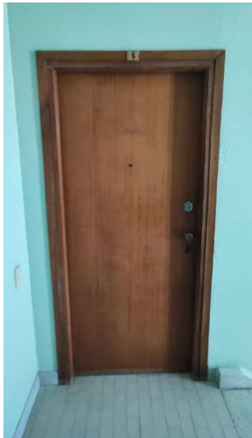
VISTA PARTI COMUNI CONDOMINIO – VANO SCALA E INGRESSO APPARTAMENTO SUB 21 - INTERNO 5 – PIANO TERZO