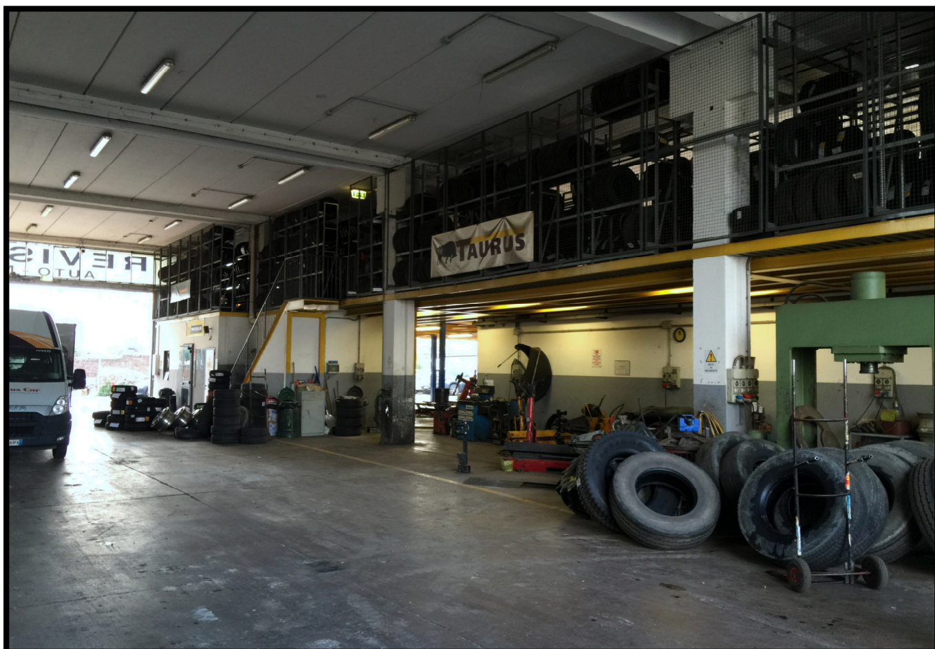
Officina autocarri a piano terra