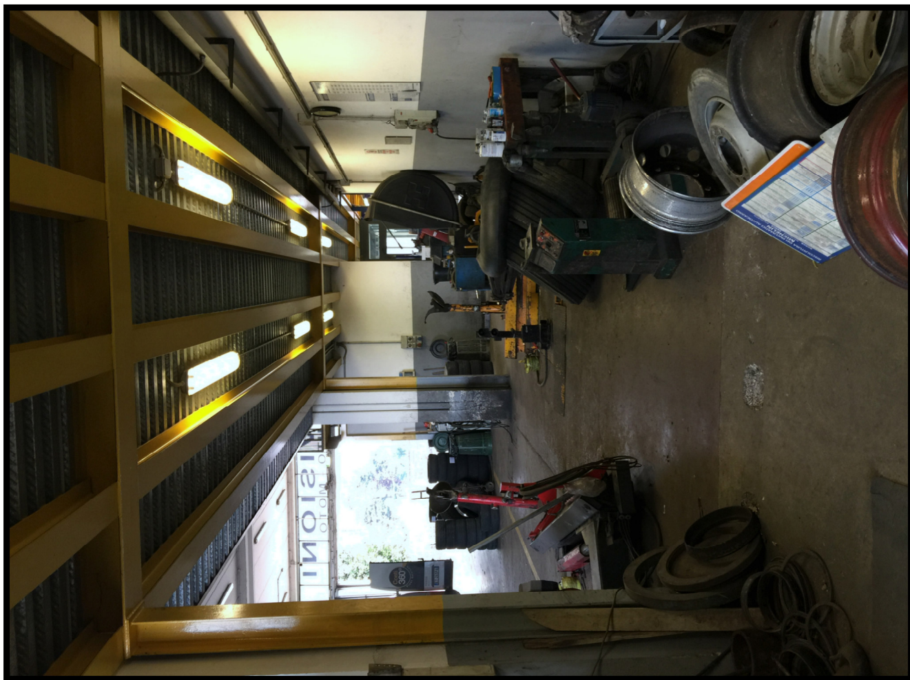
Officina autocarri a piano terra