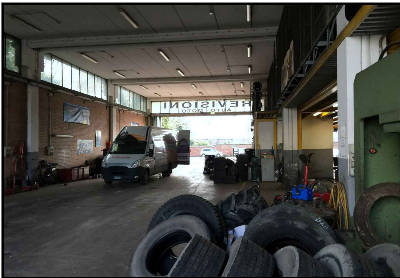
Officina autocarri a piano terra