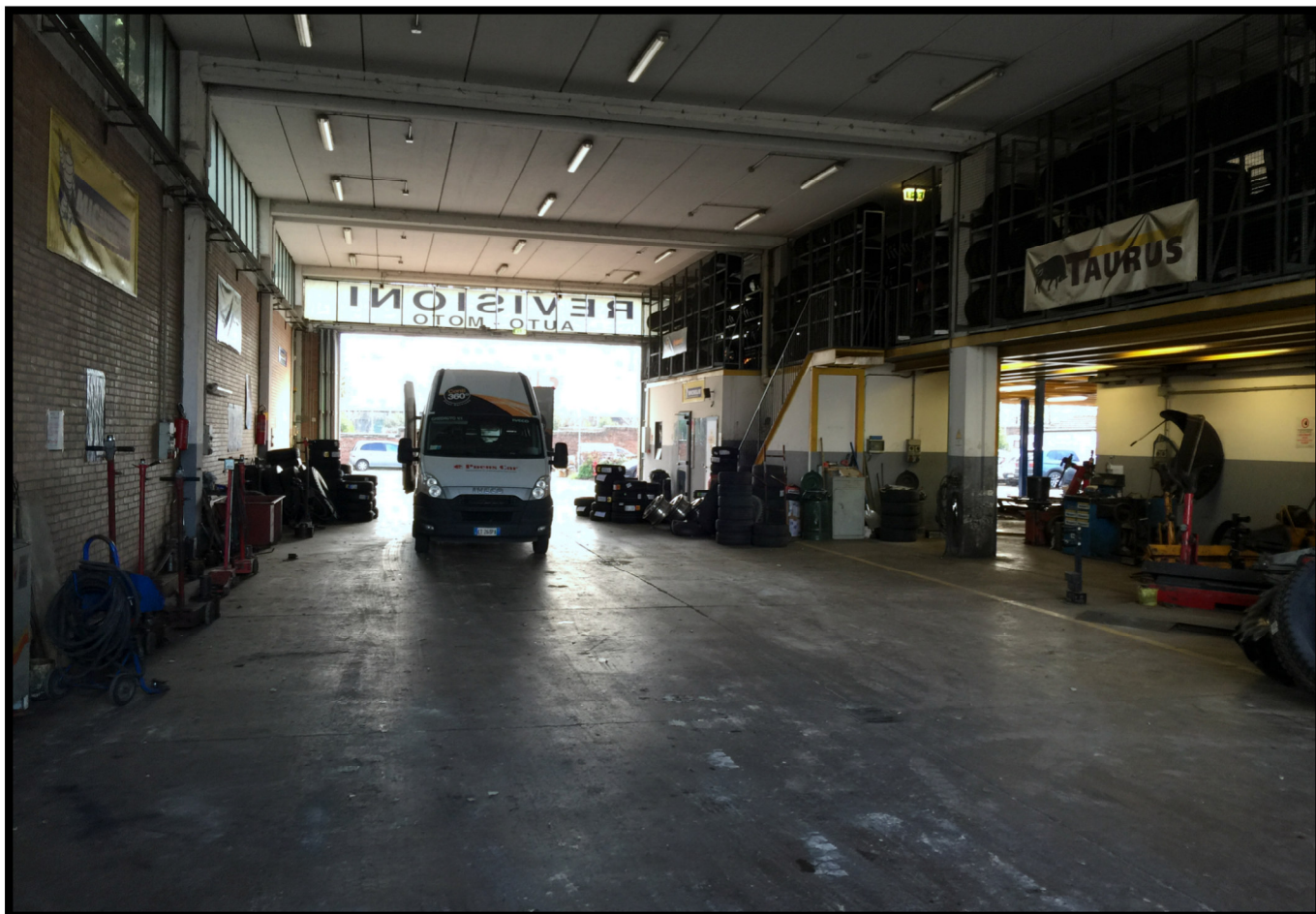
Officina autocarri a piano terra