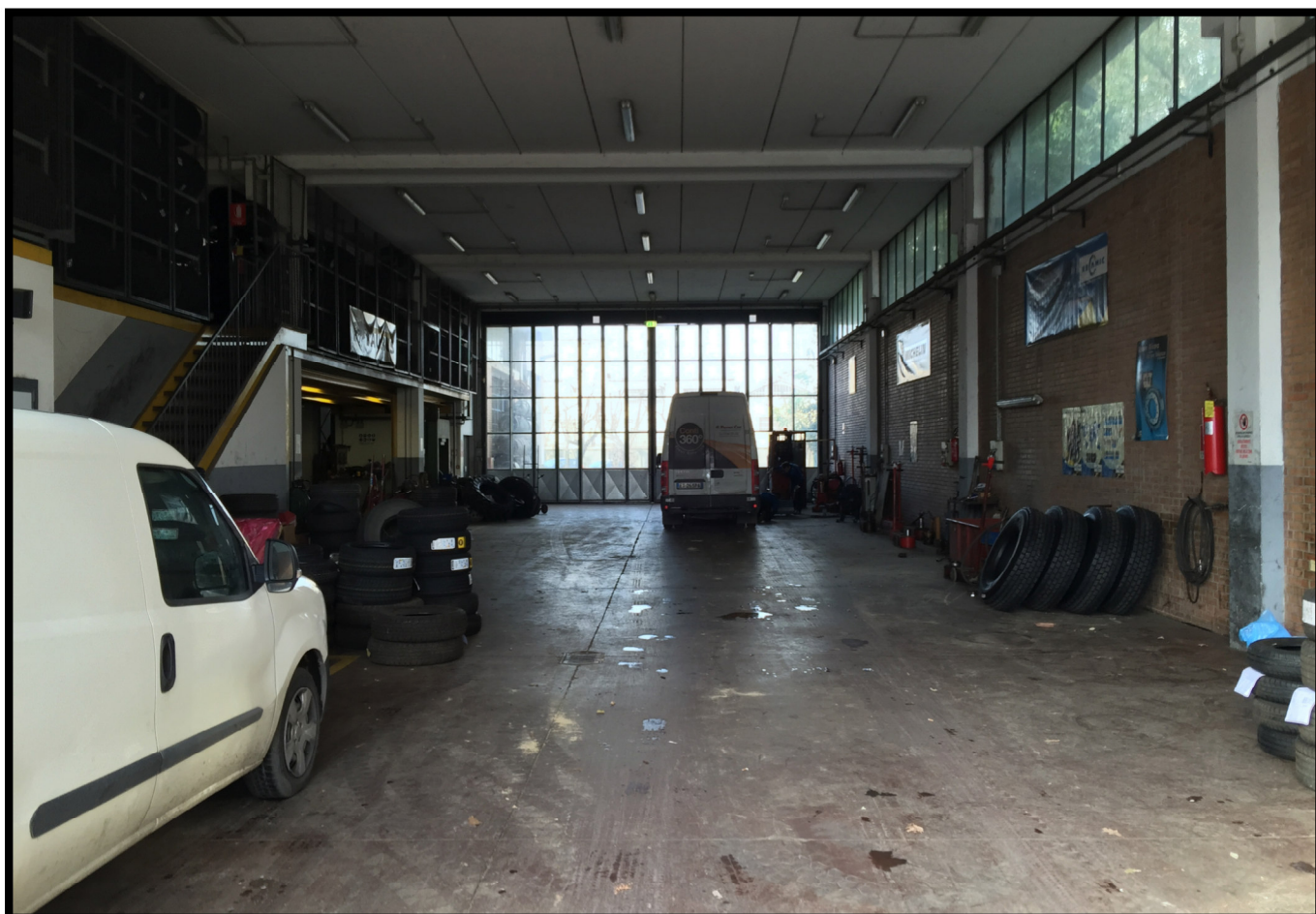
Officina autocarri a piano terra