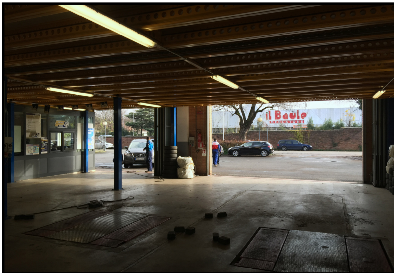
Officina autovetture a piano terra