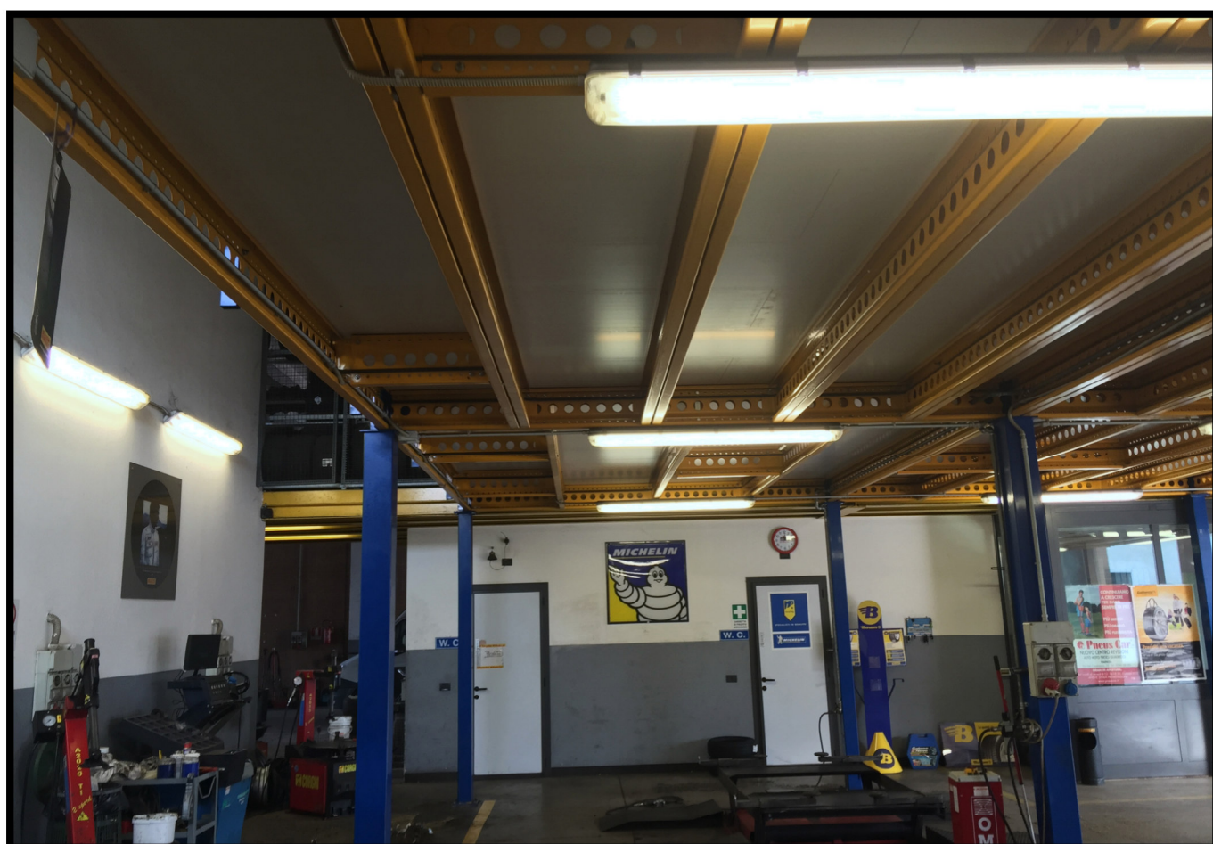
Officina autovetture a piano terra