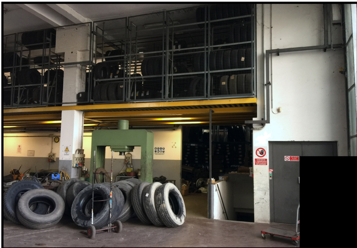
Officina autocarri a piano terra