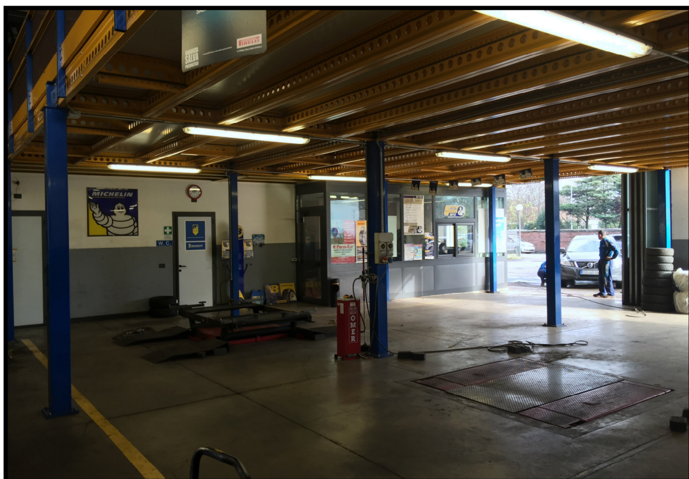
Officina autovetture a piano terra