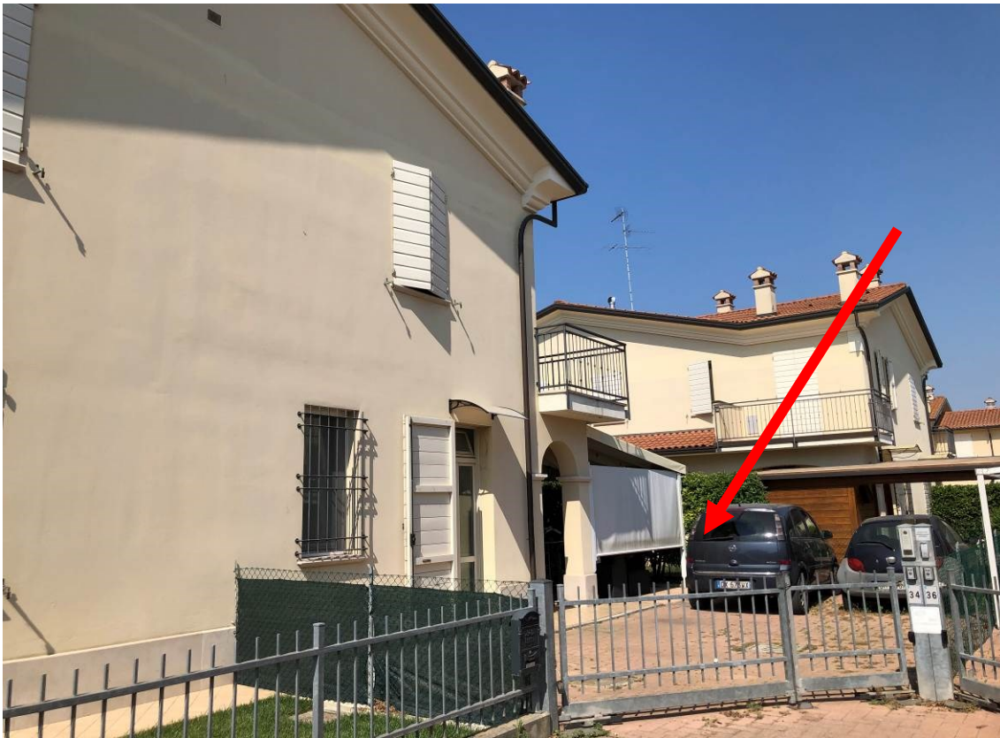
Foto 3 – Vista dell'immobile da stradello di accesso (Mapp. 1004).