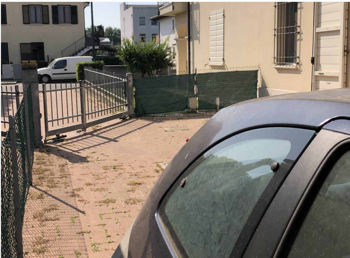
Foto 8 – Particolare accesso carrabile-pedonale da corte pertinenziale.