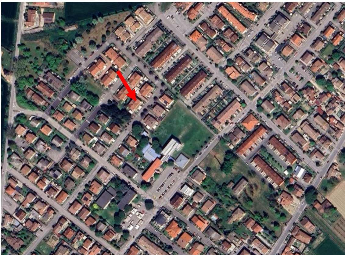
Foto 1 – Vista aerea della frazione di Piangipane con identificazione del bene.