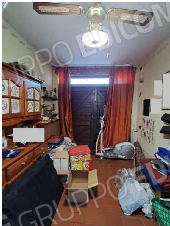
ACCESSO DIRETTO AL GARAGE E VISTA INTERNA DEL GARAGE