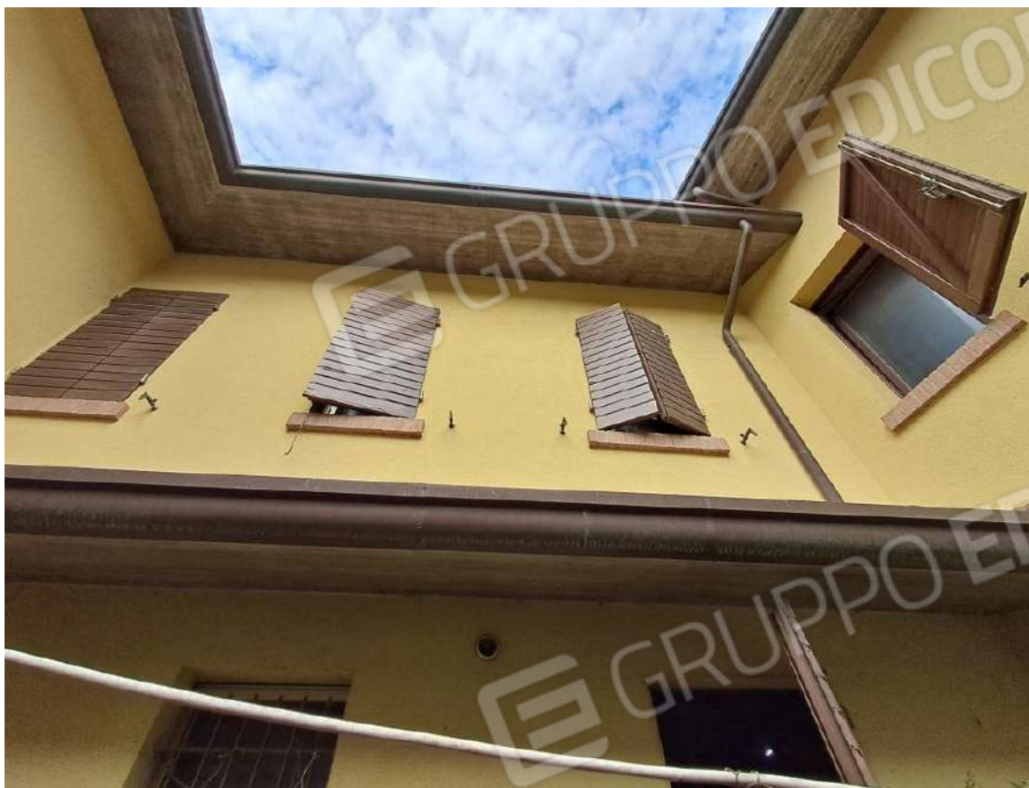
PROSPETTO INTERNO – PARTICOLARE INFISSI