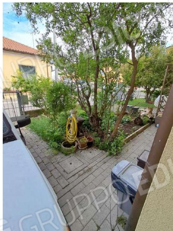
LOGGIA CON INGRESSO ABITAZIONE - PORTONE DEL GARAGE E GIARDINO ESCLUSIVO FRONTE STRADA VIA NUOVA