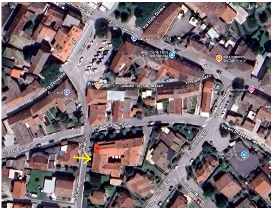
IMMAGINE SATELLITARE CON INDICAZIONE INGRESSO CARABILE UNICO ACCESSO ALL'ABITAZIONE E AL GARAGE