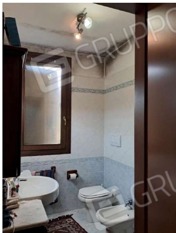
SCALA INTERNA E BAGNO AL PIANO PRIMO