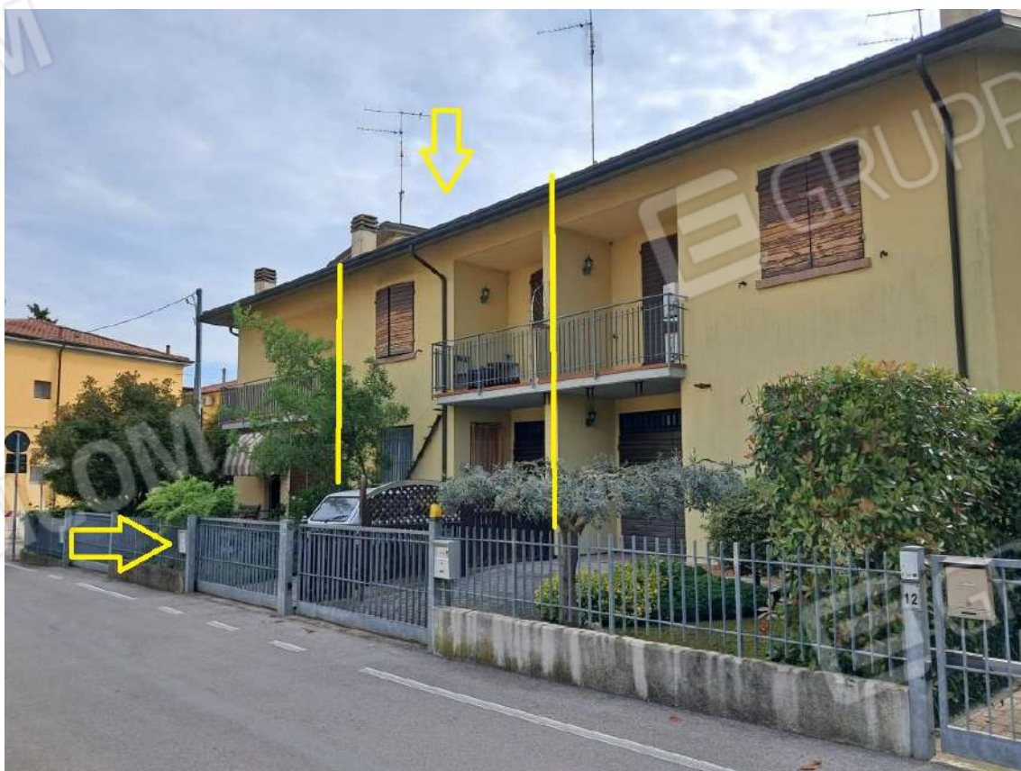
VISTA PROSPETTO DA VIA NUOVA – INDICAZIONE DELLA PORZIONE IMMOBILIARE IN OGGETTO