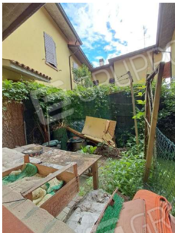
SERVIZIO IGIENICO DEL GARAGE E VISTA DELLA CORTE SUL RETRO