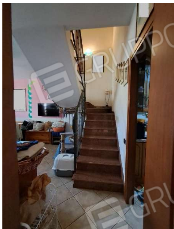
CUCINA E VANO SCALA DI ACCESSO AL PIANO PRIMO