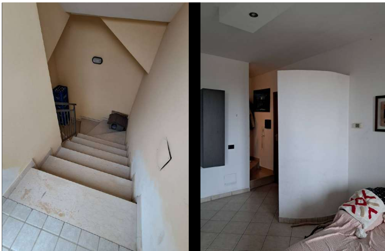
VANO SCALA CONDOMINIALE E ABITAZIONE SUB 18: INGRESSO E SCALA DI ACCESSO AL P3°