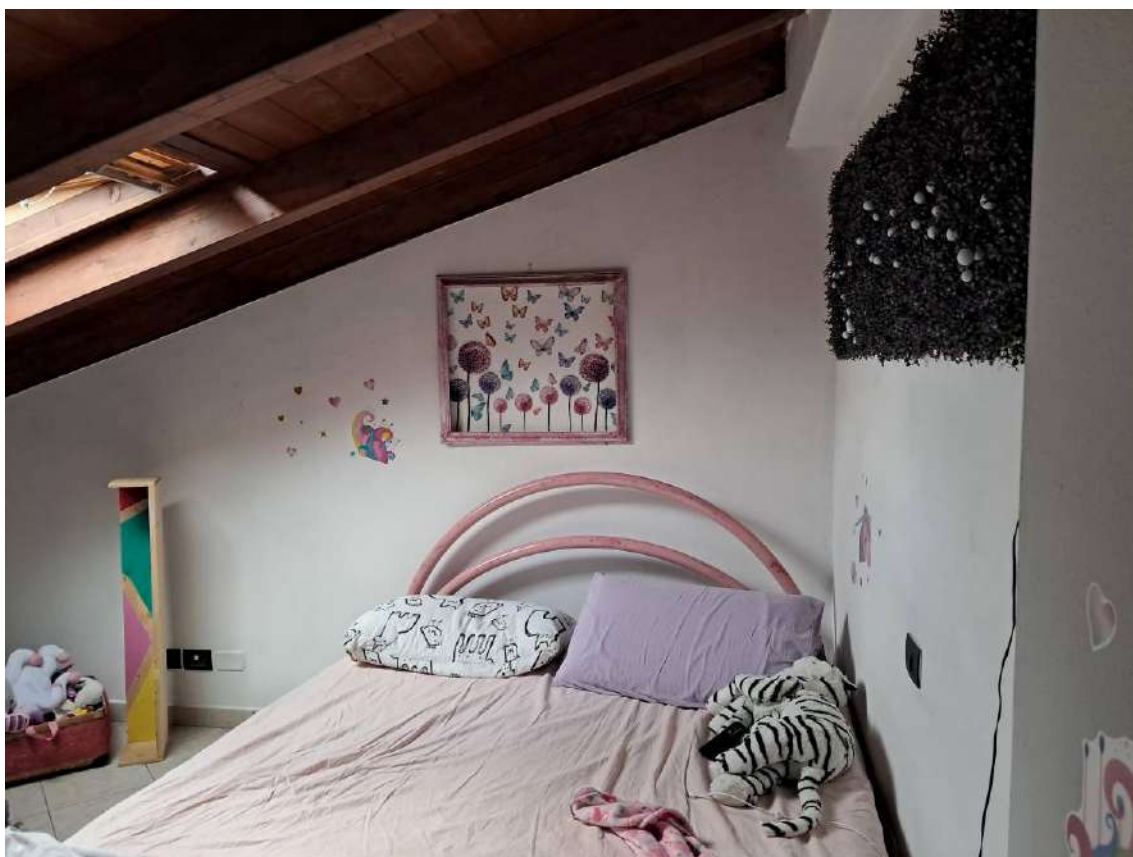
ABITAZIONE SUB 18: PIANO 3° DEPOSITO OCCASIONALE