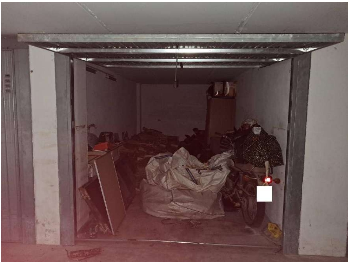
PIANO SOTTOSTRADA: INTERNI DELLA AUTORIMESSA SUB 11