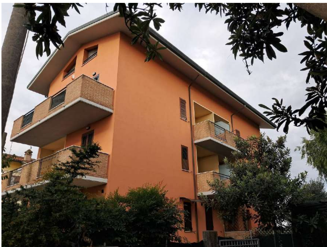
PROSPETTI LATO EST E LATO SUD DEL CONDOMINIO