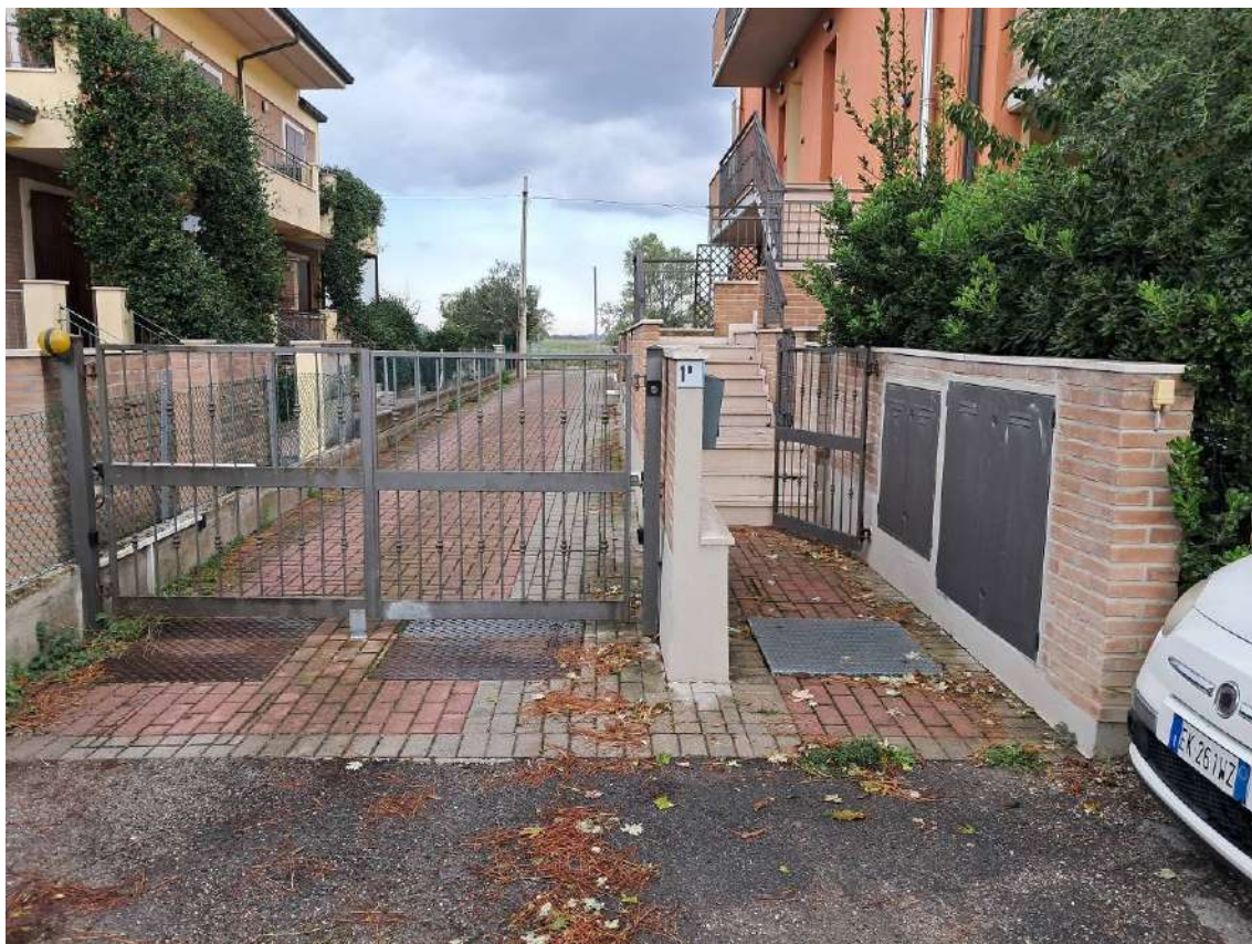
ACCESSI CONDOMINIALI: PEDONALE E CARRABILE CIV. 1/B