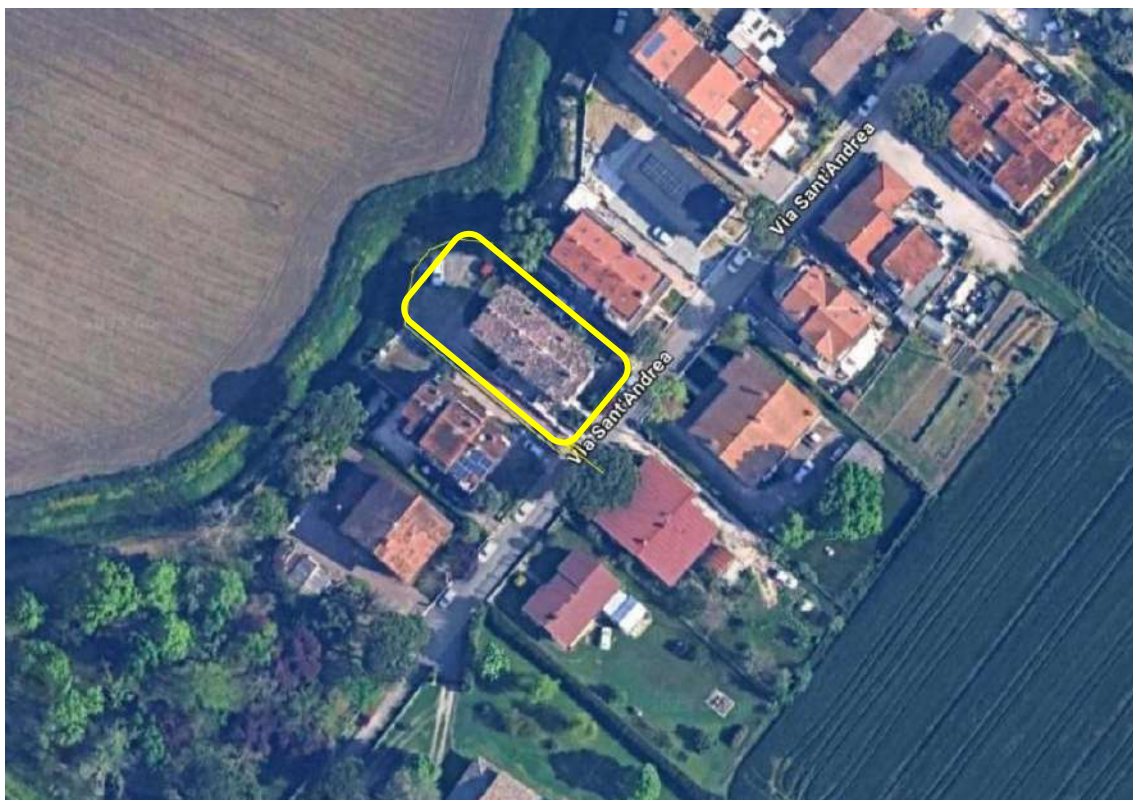
IMMAGINE SATELLITARE VIA SANT'ANDREA 1/B – CERVIA – UBICAZIONE DEL COMPLESSO “SANT’ANDREA”