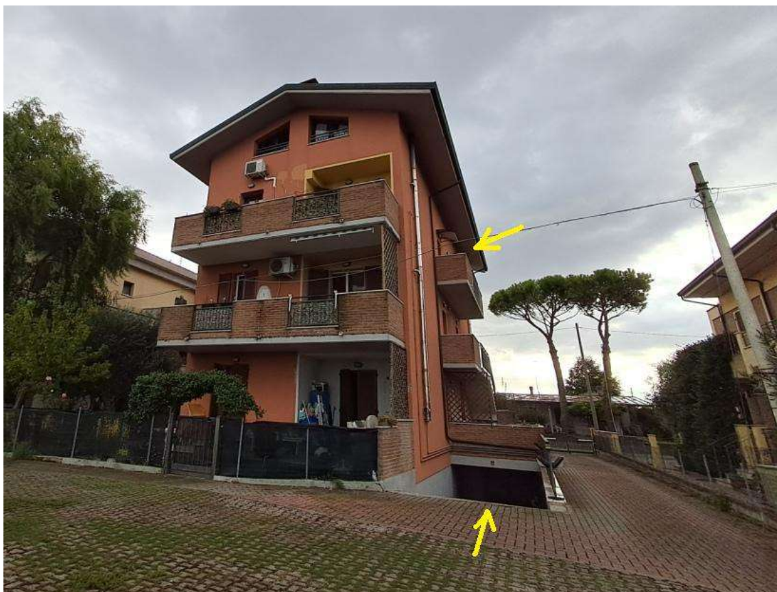
VISTA DALLA CORTE INTERNA DEL PROSPETTO LATO NORD OVEST DEL CONDOMINIO CON INDICAZIONE DELLA RAMPA CARRABILE DI ACCESSO ALLA RIMESSA INTERRATA