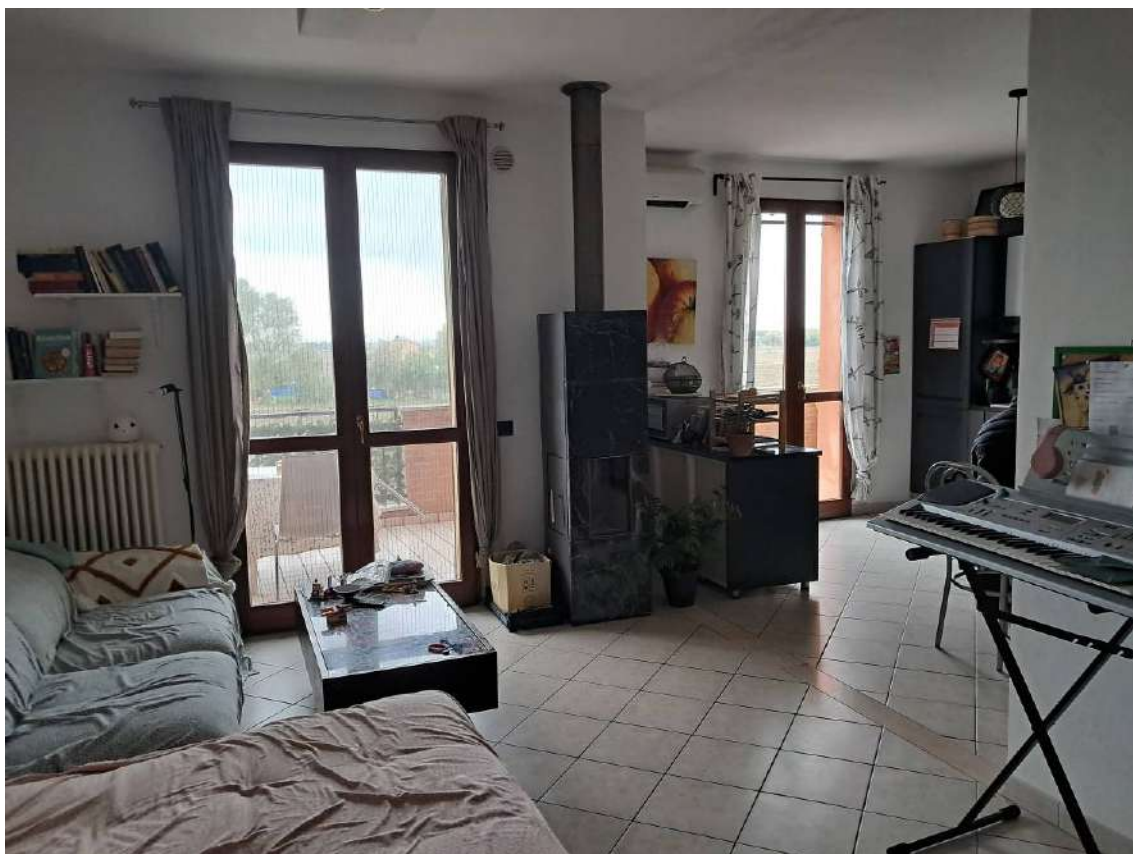
ABITAZIONE SUB 18: PIANO 2° - SOGGIORNO