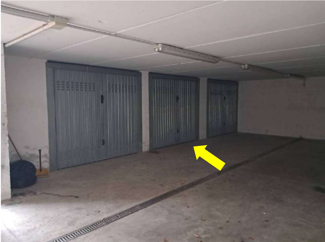
PIANO SOTTOSTRADA: AUTORIMESSA CON INDICAZIONE DEL U.I. SUB 11