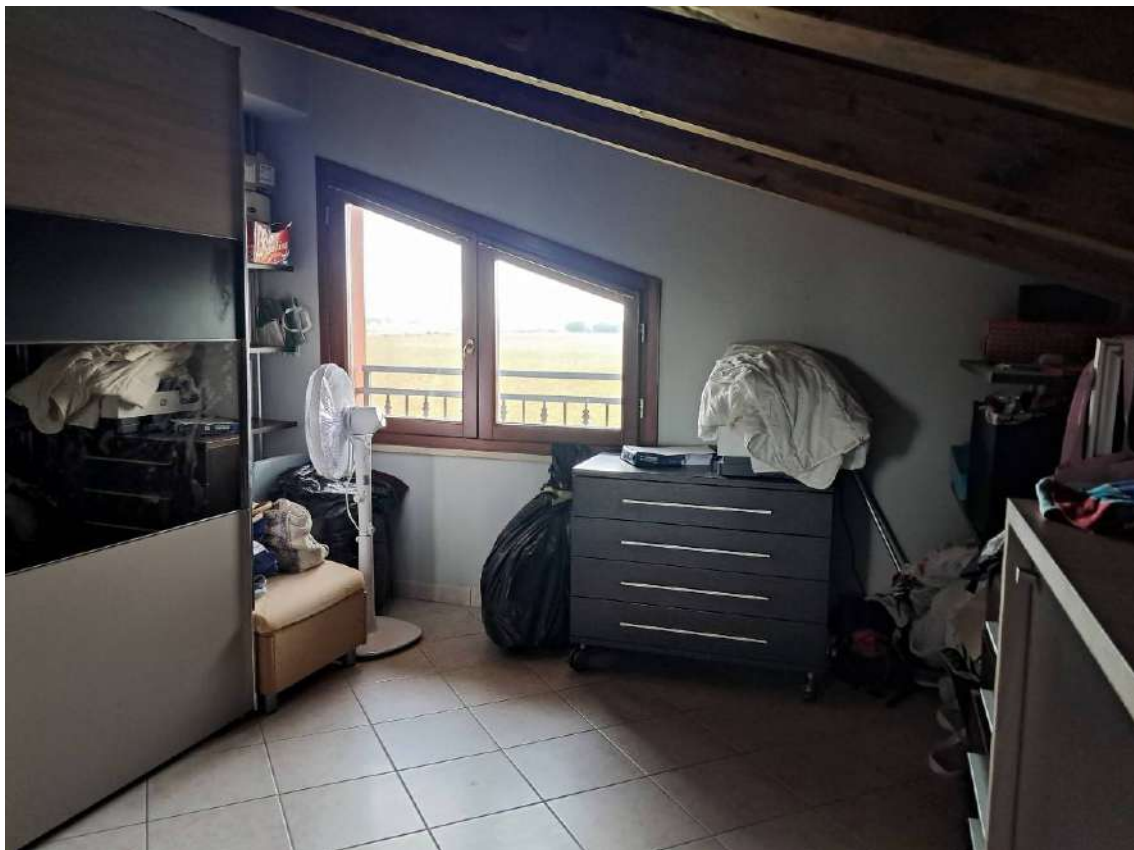
ABITAZIONE SUB 18 SUB 18: PIANO 3° DEPOSITO OCCASIONALE