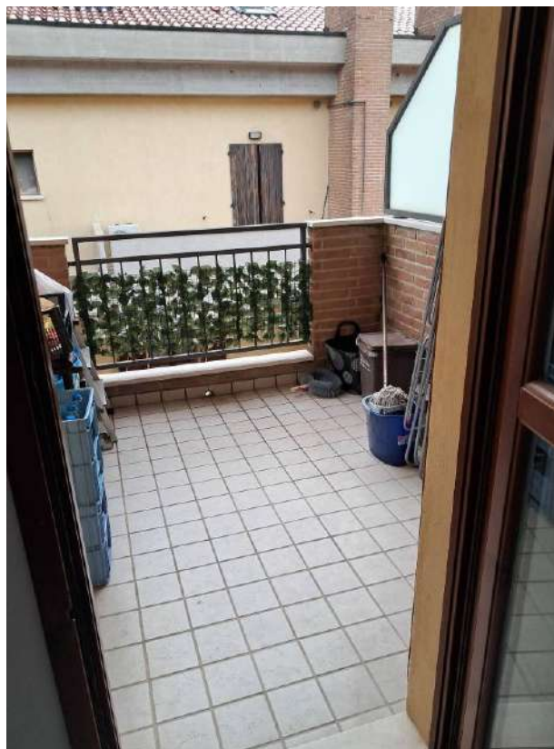
ABITAZIONE SUB 18: PIANO 2° BALCONE LATO NORD – OVEST E BALCONE LATO NORD - EST