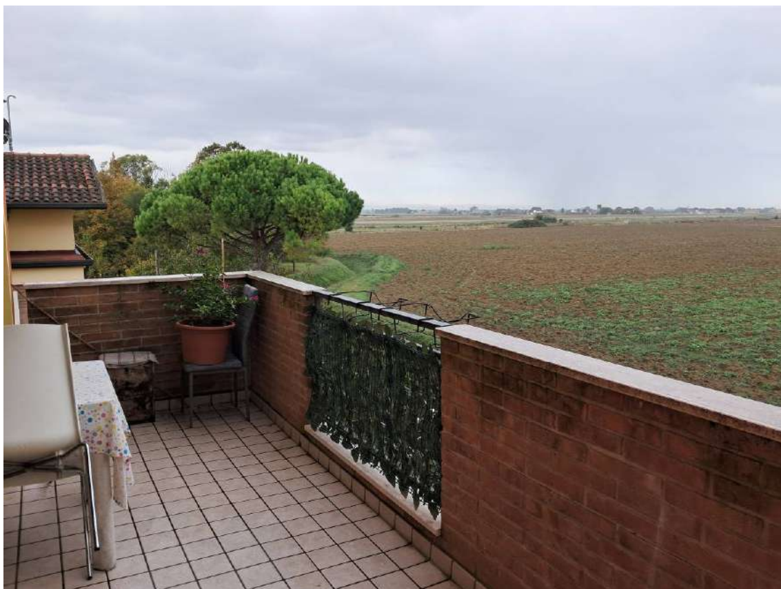
ABITAZIONE SUB 18: PIANO 2° BALCONE LATO NORD - OVEST