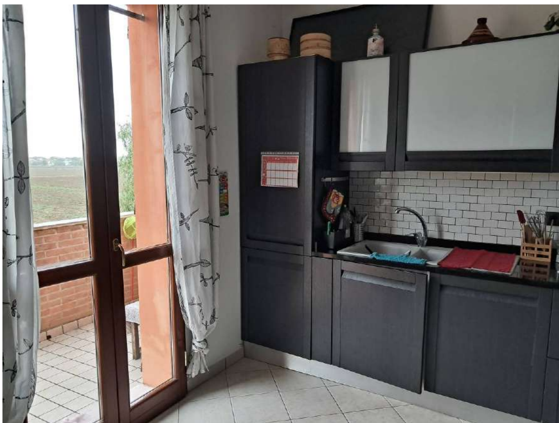
ABITAZIONE SUB 18: PIANO 2° - ZONA COTTURA