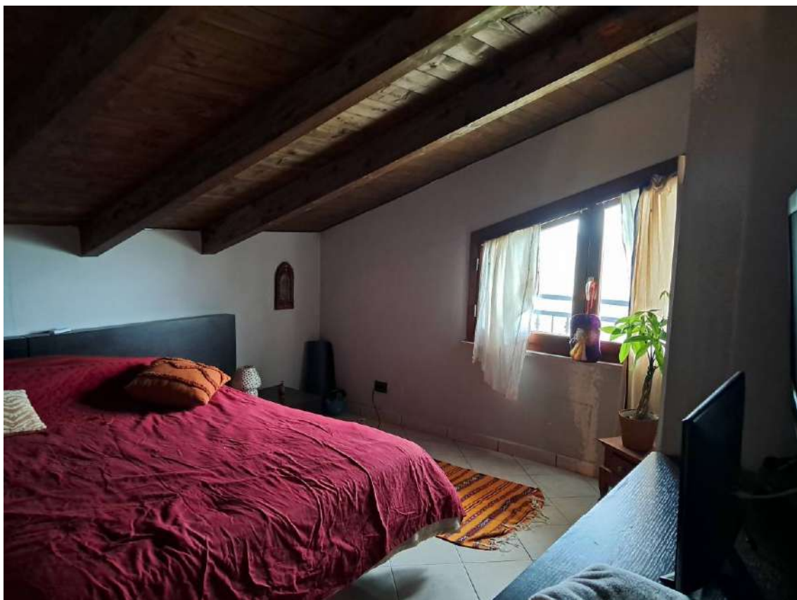
ABITAZIONE SUB 18: PIANO 3° DEPOSITO OCCASIONALE