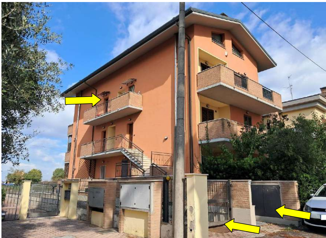
PROSPETTI LATO OVEST E LATO SUD DEL CONDOMINIO CON INDICAZIONE DEGLI ACCESSI FRONTE STRADA (PEDONALE E CARRABILE) E INDICAZIONE INGRESSO APPARTAMENTO AL PIANO 2°