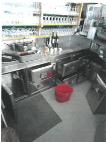
FOTO BENI MOBILI PRO-INFANZIA