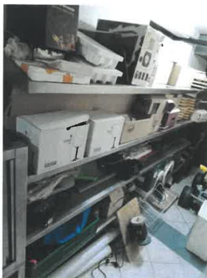
FOTO BENI MOBILI PRO-INFANZIA