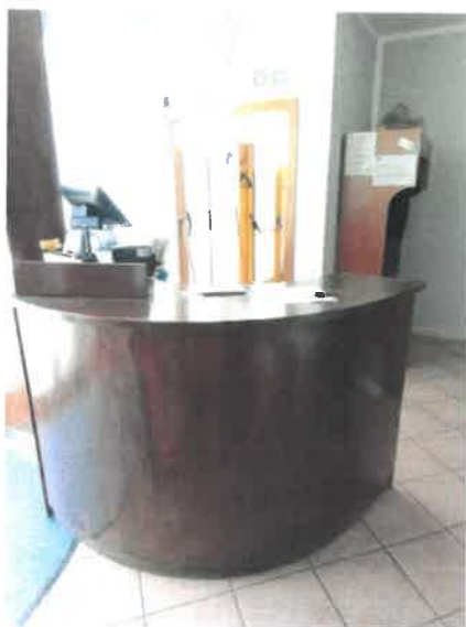
FOTO BENI MOBILI PRO-INFANZIA