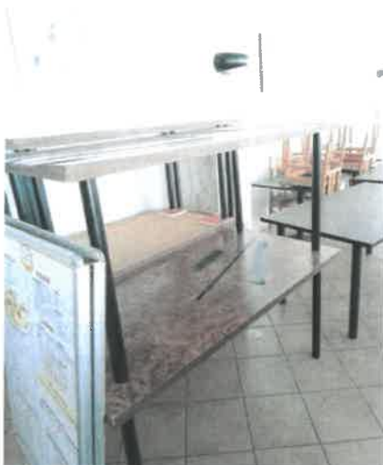
FOTO BENI MOBILI PRO-INFANZIA