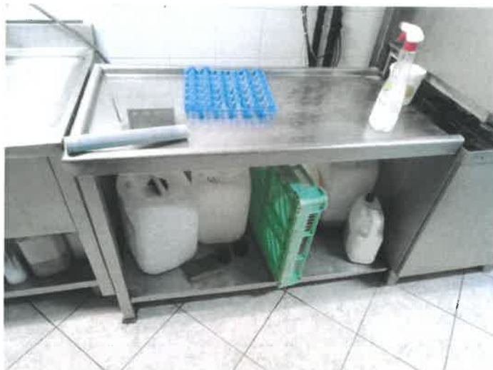
FOTO BENI MOBILI PRO-INFANZIA