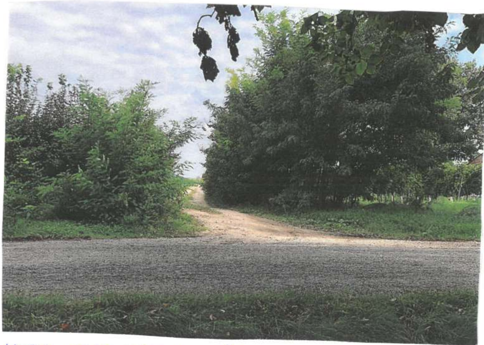
1- VISTA PAPP. 285 DA VIA CORBARDINA, CAROLA DI ALESSO