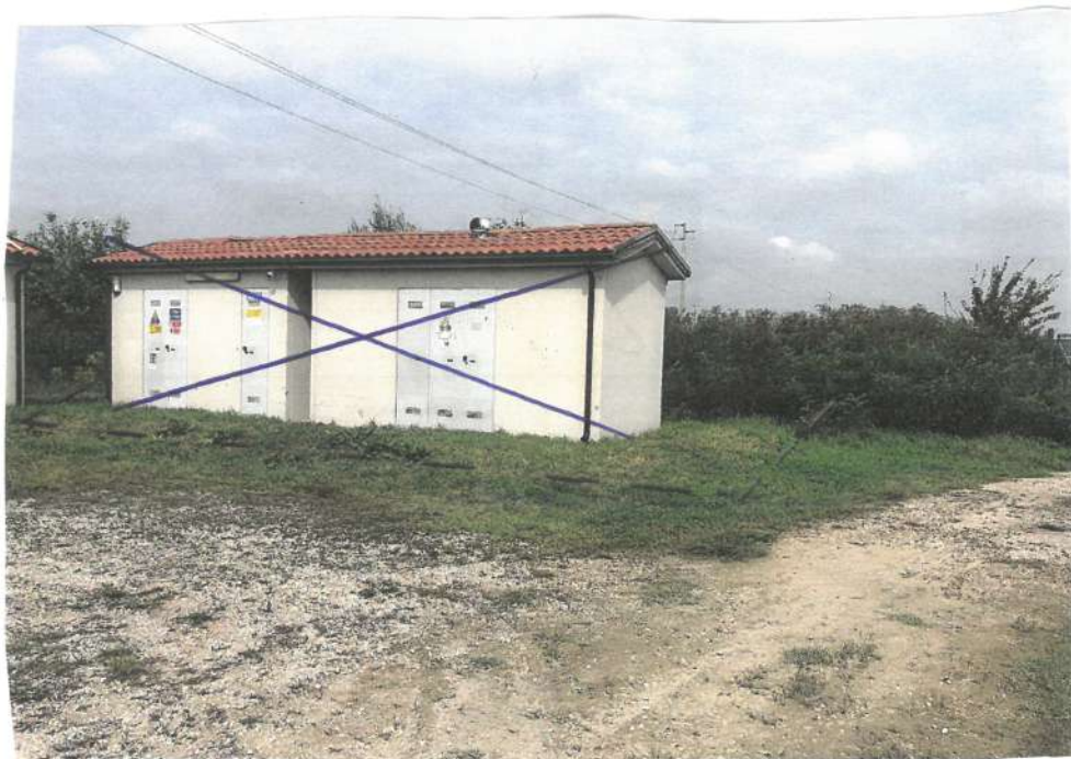
2- VISTA PAPP. 289 E 290, OGGETTO DI PIGNORAMENTO È L'AREA E NON LE SOPRASTANTI CABINE ELETTRICHE