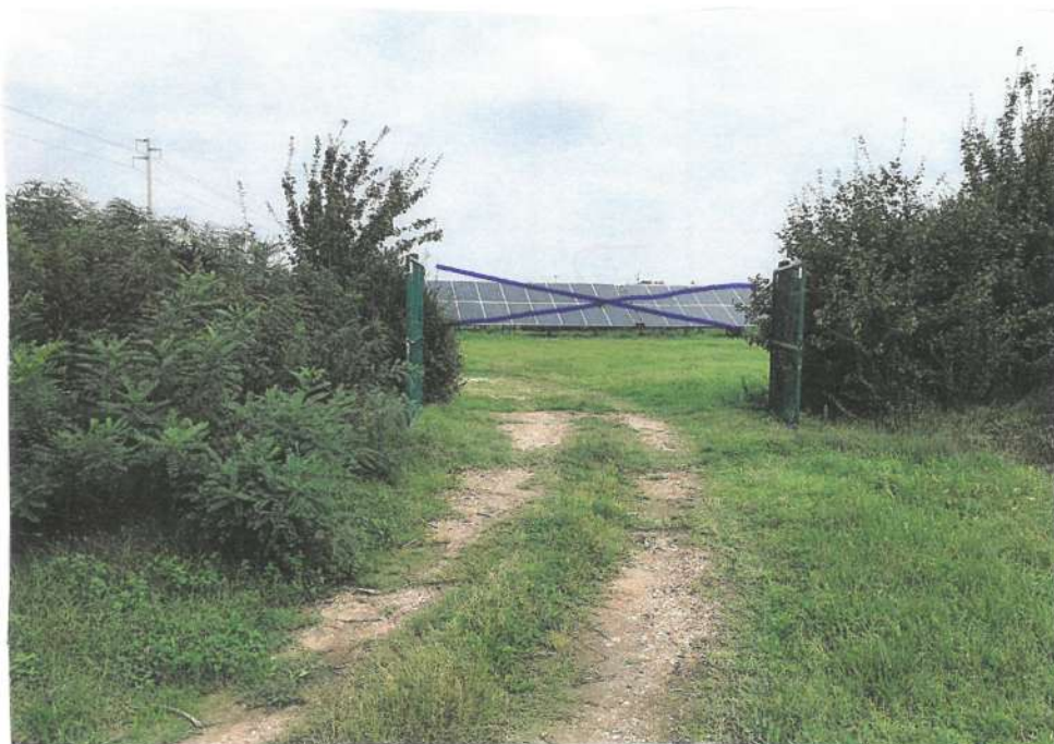
3- VISTA PAPP. 291, OGGETTO DI RIGRUPPAMENTO E' L'AREA E NON IL SOPRASTANTE IMPIANTO FOTOVOLTAICO