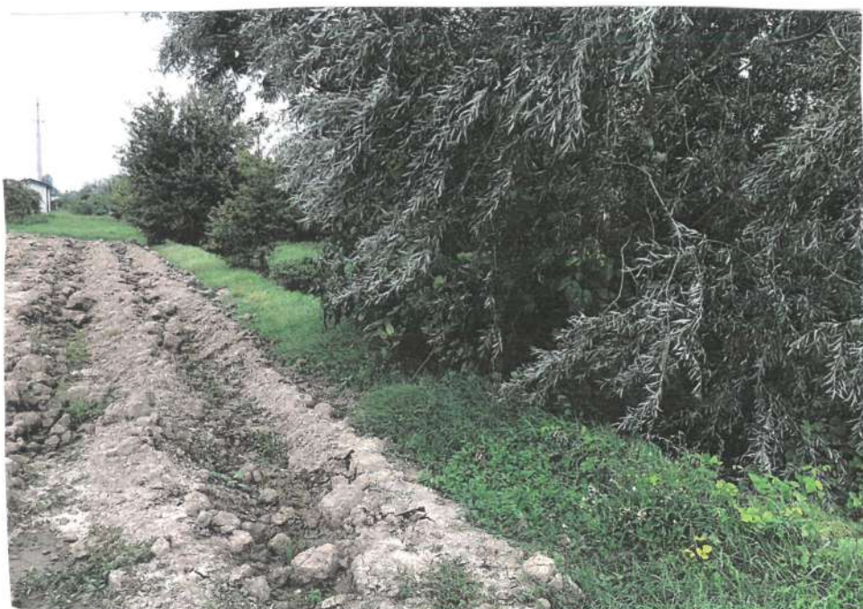
4 - PAPP. 291, FOSSE