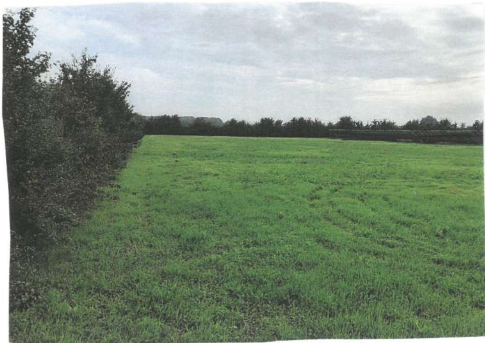
11 E 12 - PLAPP. 291, VISTA AREA