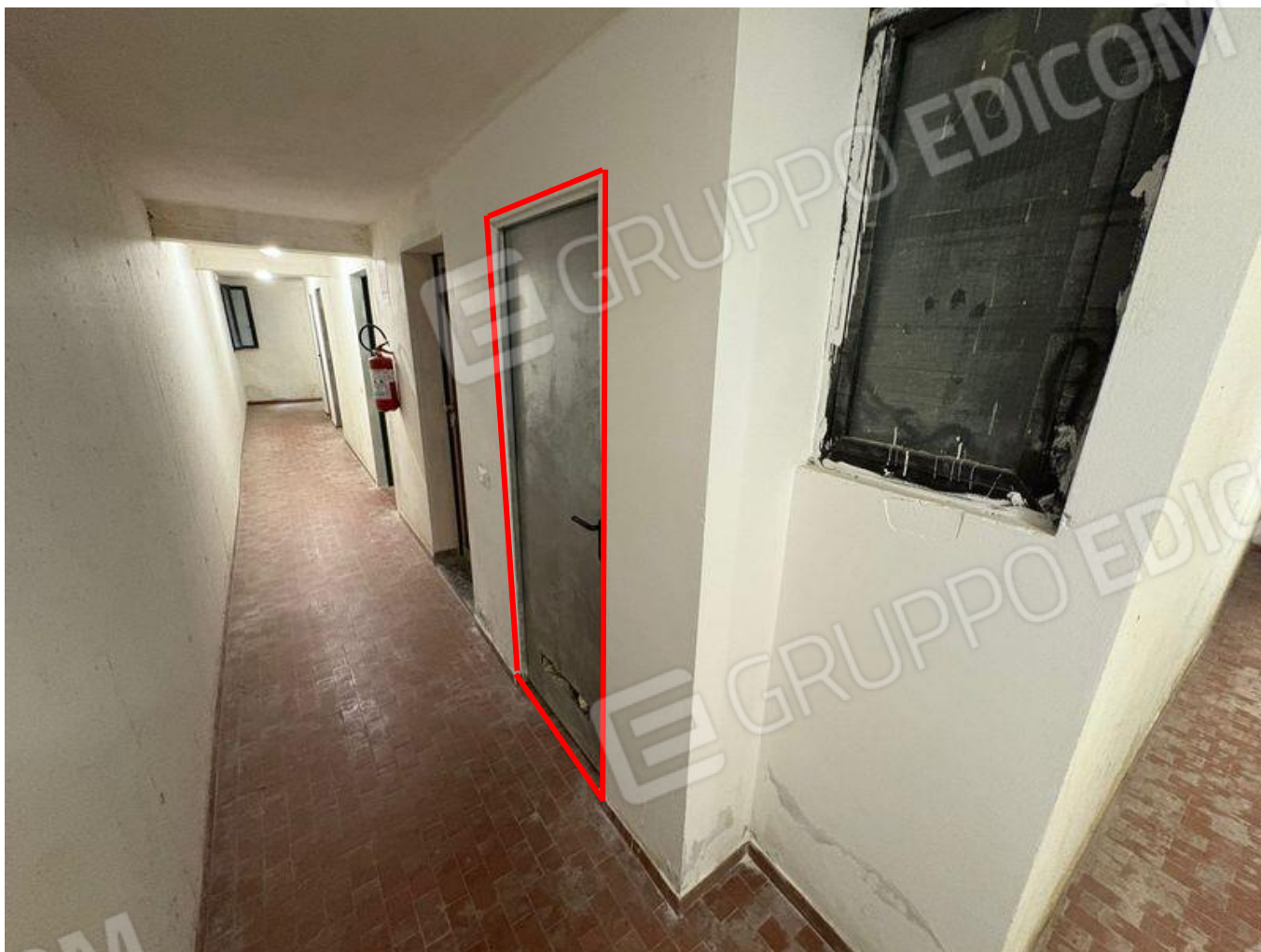
Disimpegno per accesso a cantina (S1)