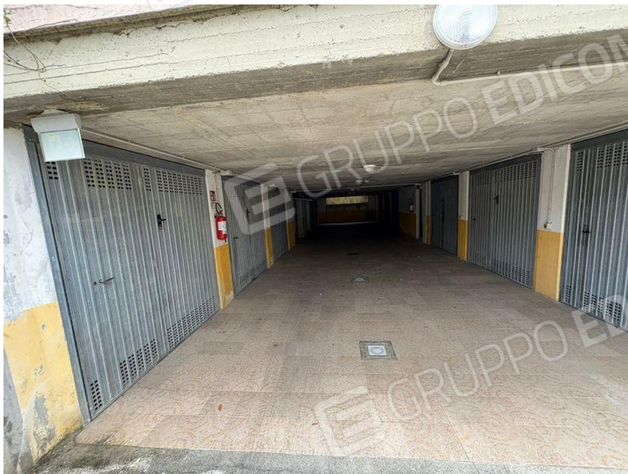
Corsello carrabile (S1)