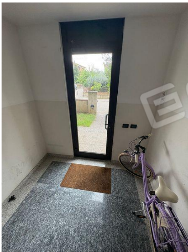
Ingresso comune condominiale (PT)