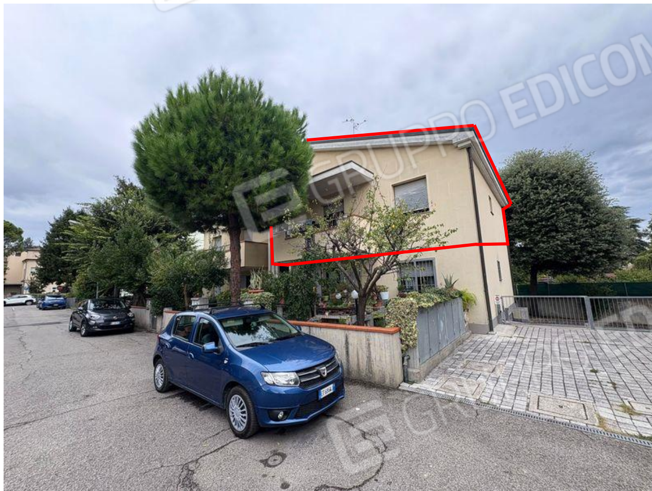
Vista sull'immobile da via N. Bixio