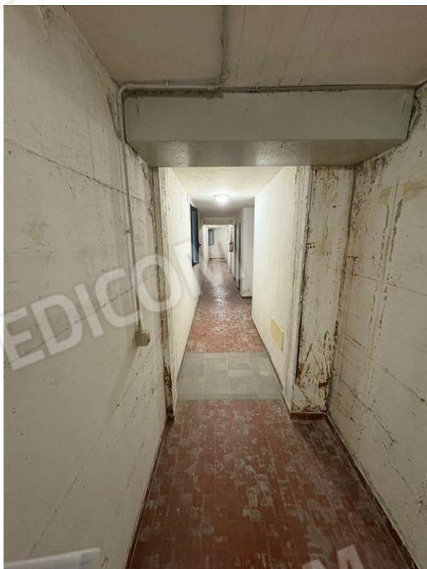
Disimpegno per accesso a cantina (S1)