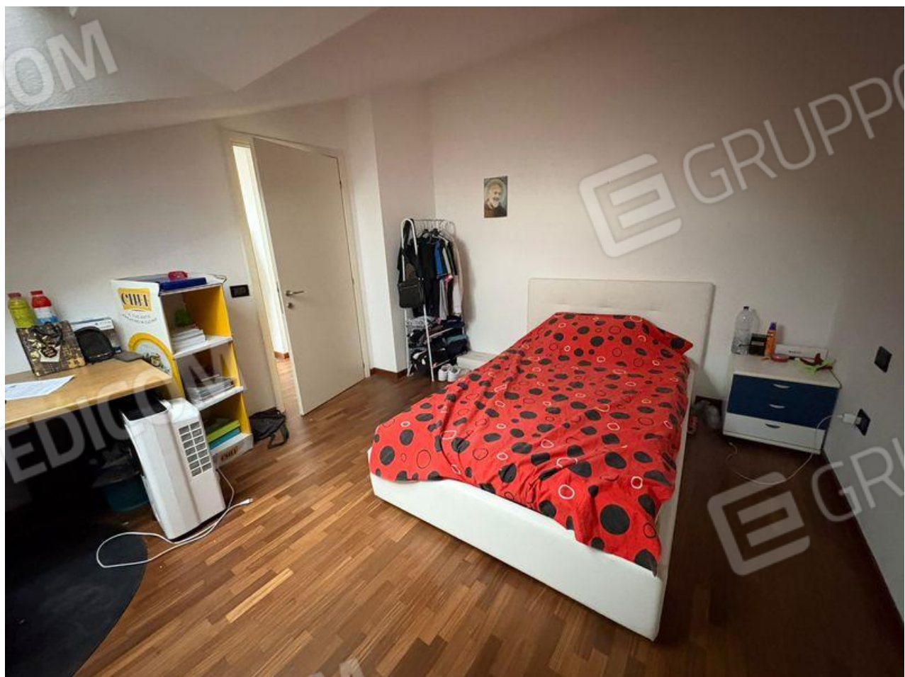
Sottotetto-Camera da letto matrimoniale (P2)