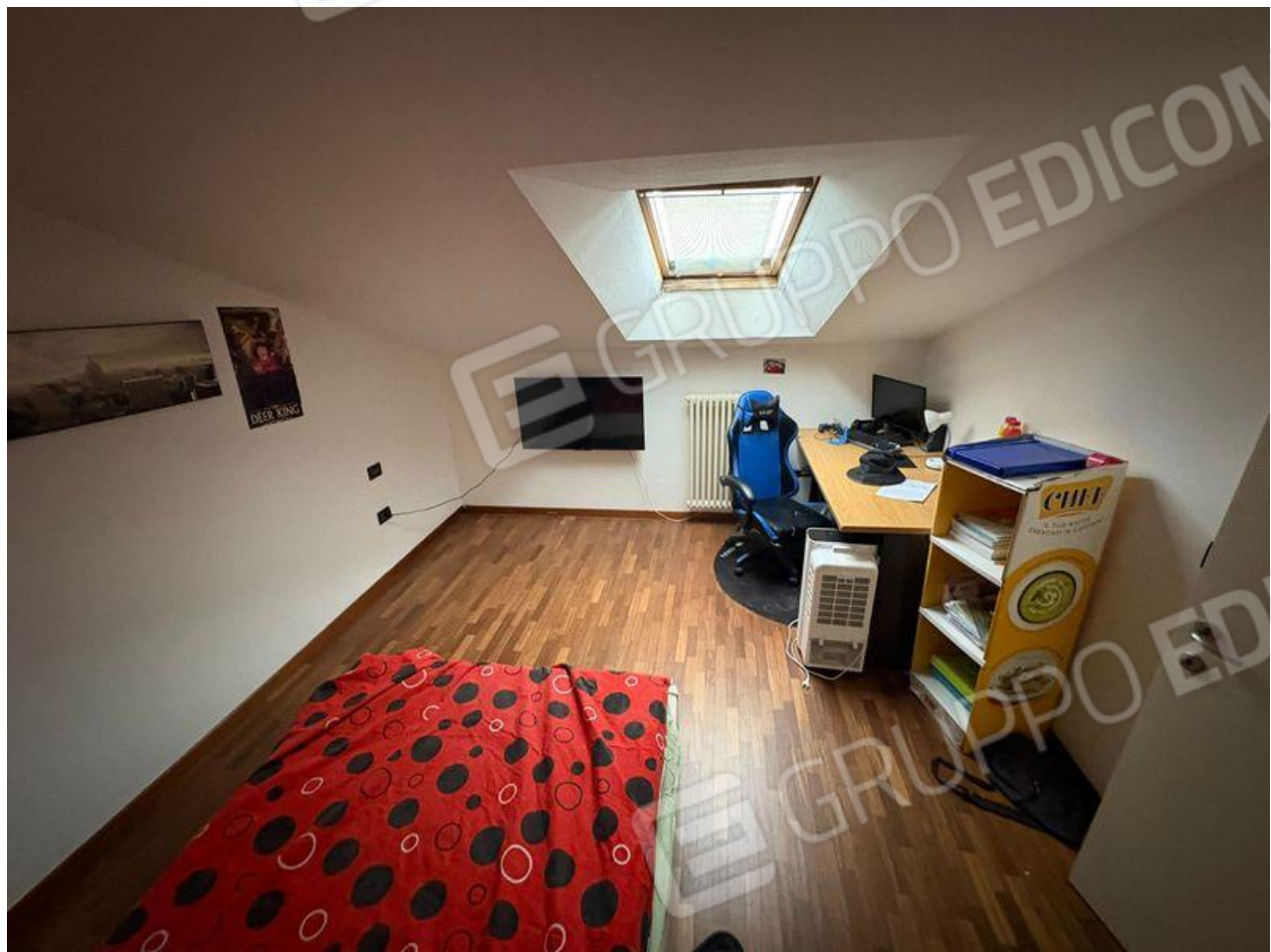
Sottotetto-Camera da letto matrimoniale-deposito occasionale 2 (P2)