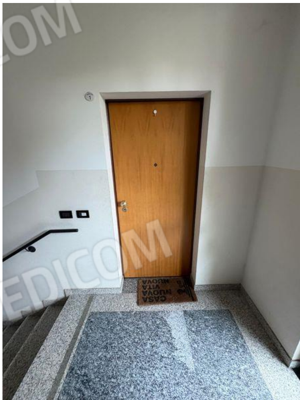
Vista su ingresso appartamento (P1)