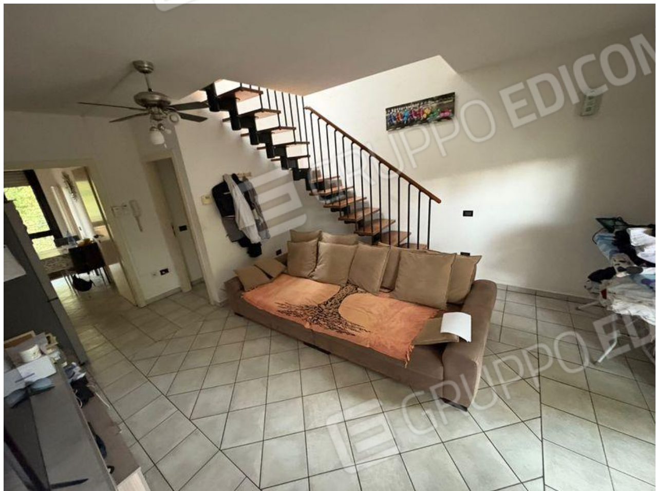
Soggiorno con vista su cucina e disimpegno (P1)