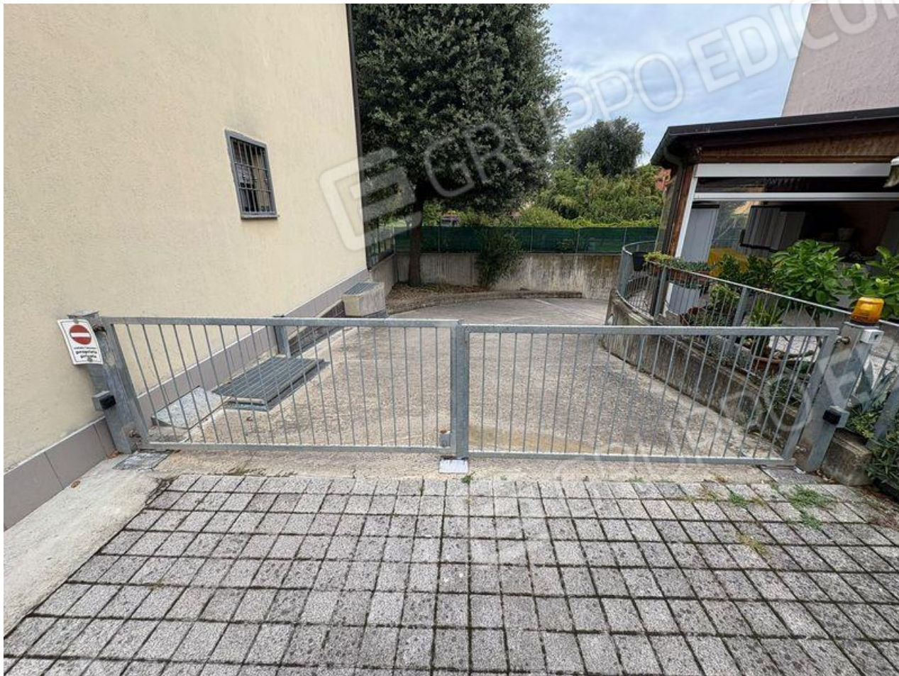
Accesso carrabile a rimessa (PT)

Via N. Bixio 50, Castel Bolognese (RA) Foglio 25, Particella 381, Subalterno 20