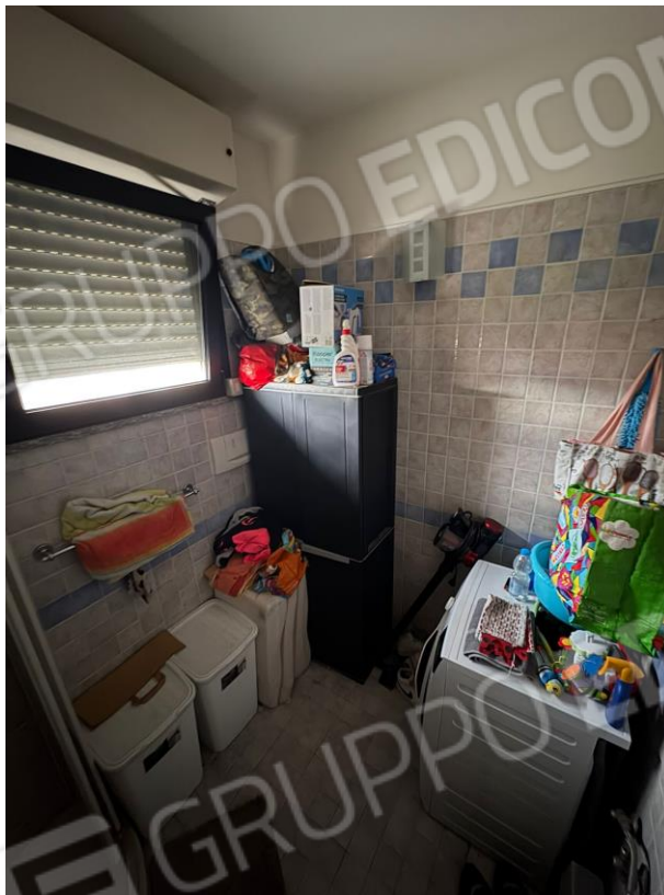
Bagno 2 (P1)