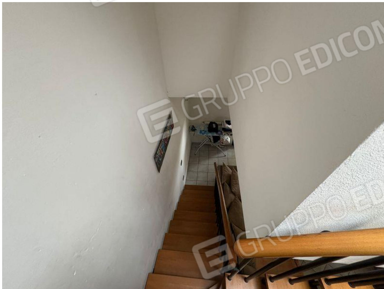
Scala di accesso al P2