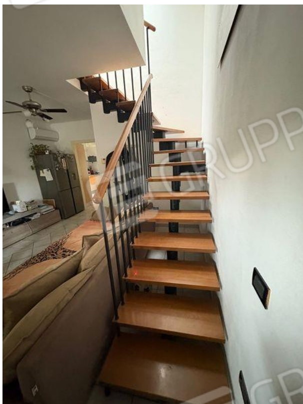
Scala per accesso al P2 (P1)