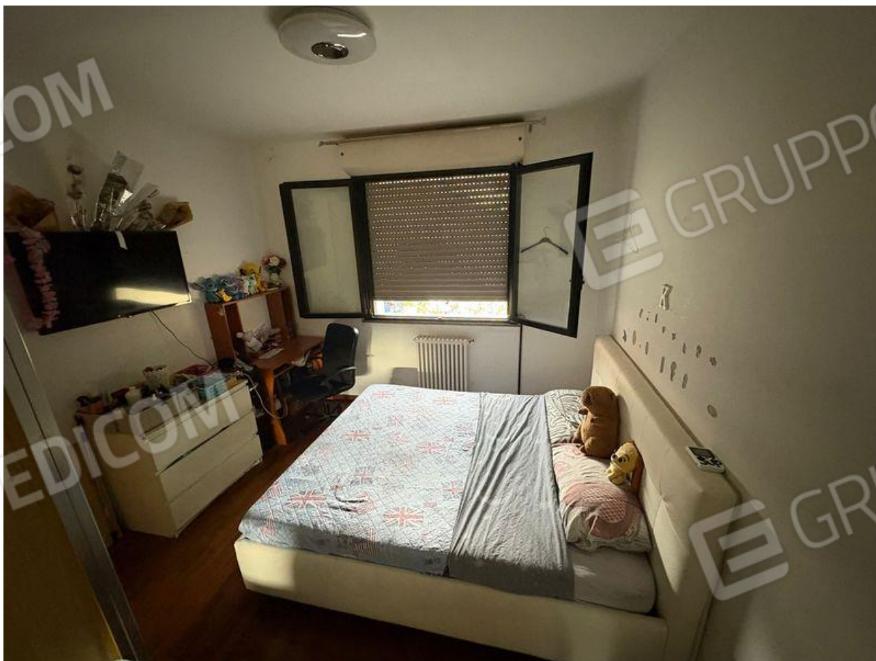
Camera 2 (P1)