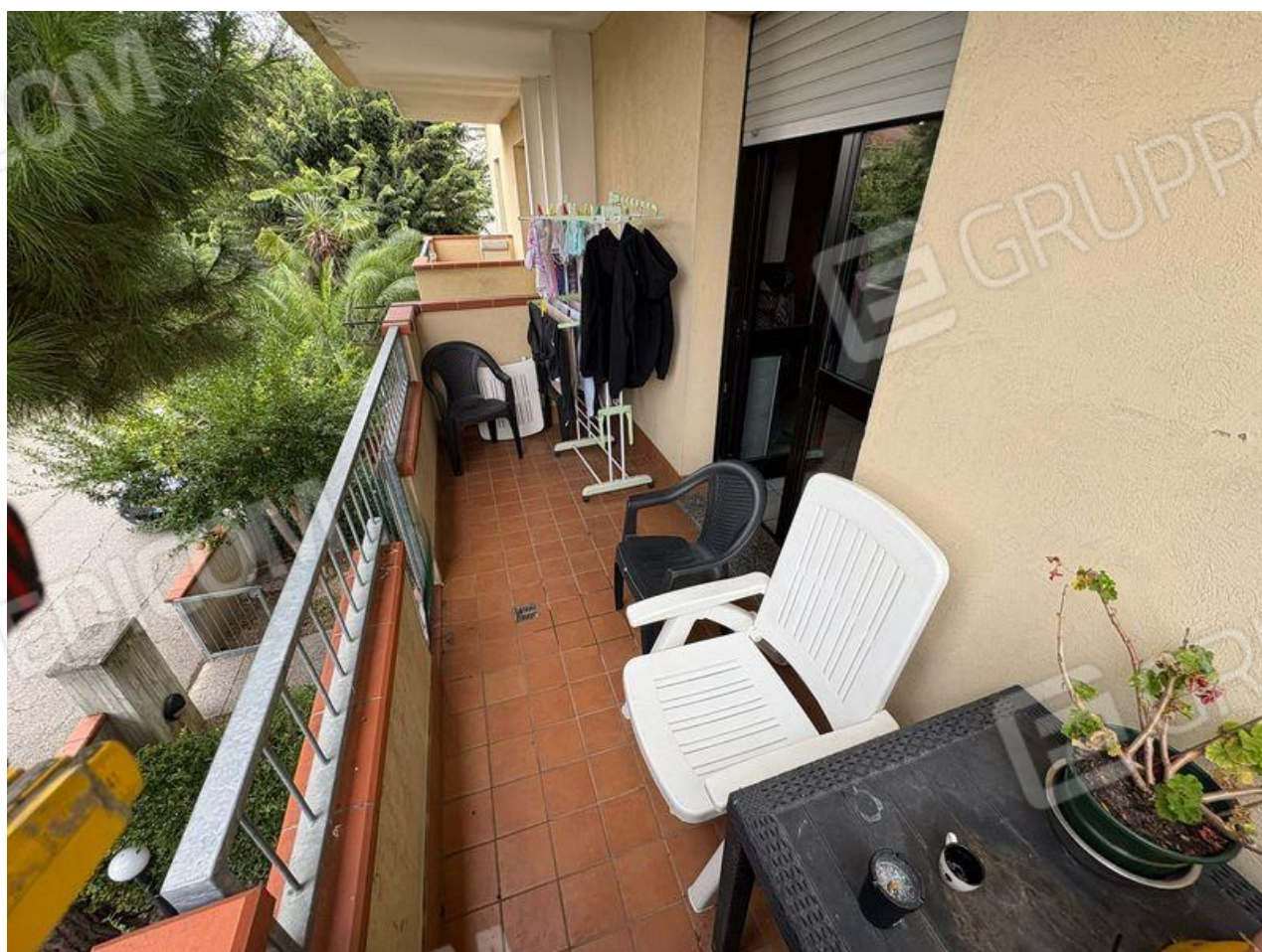
Balcone con accesso da soggiorno(P1)