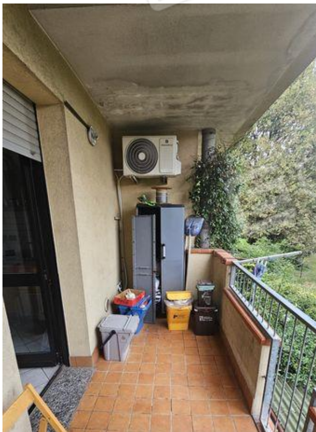
Balcone con accesso da cucina (P1)