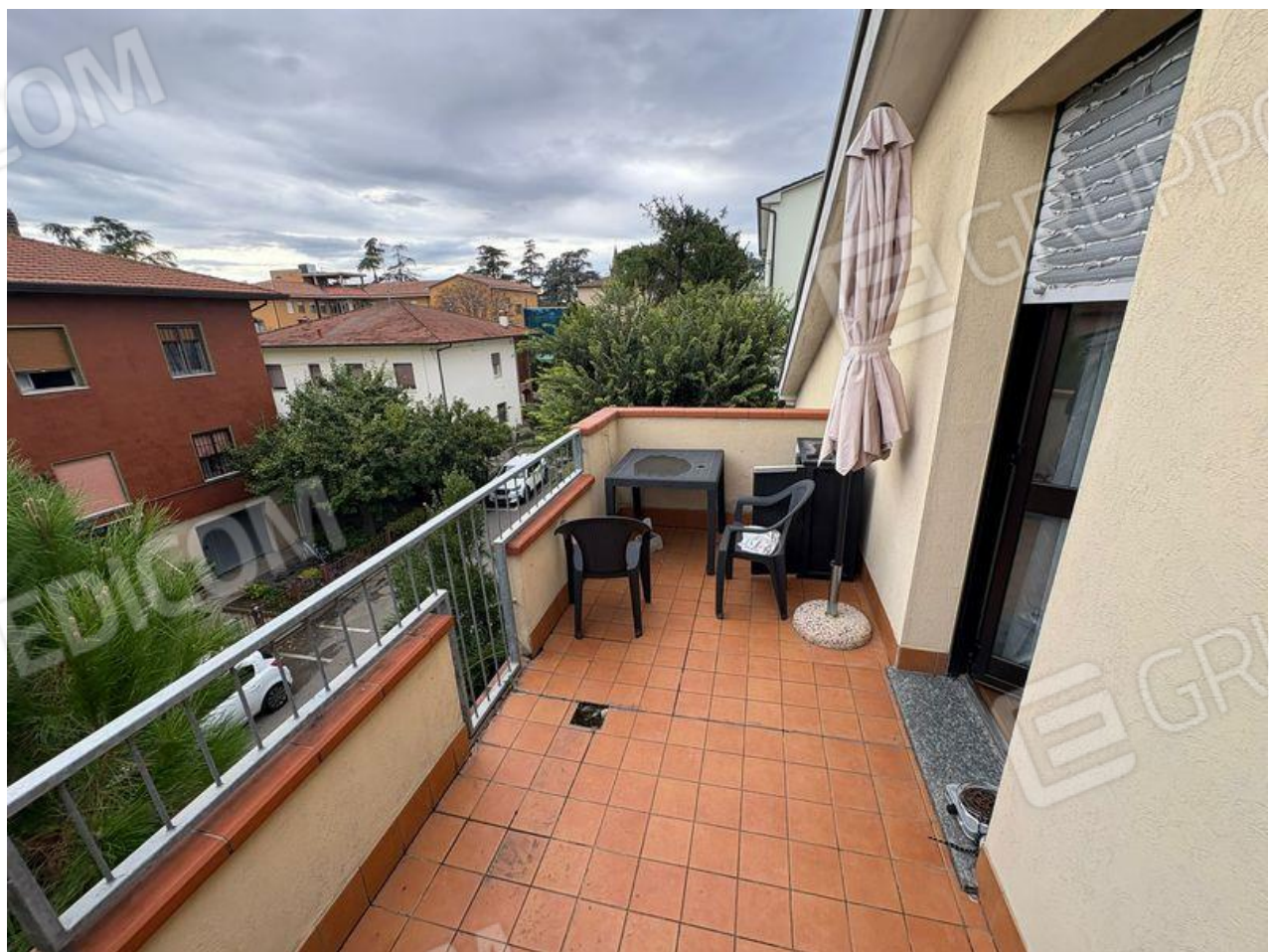
Balcone con accesso da camera da letto matrimoniale (P2)