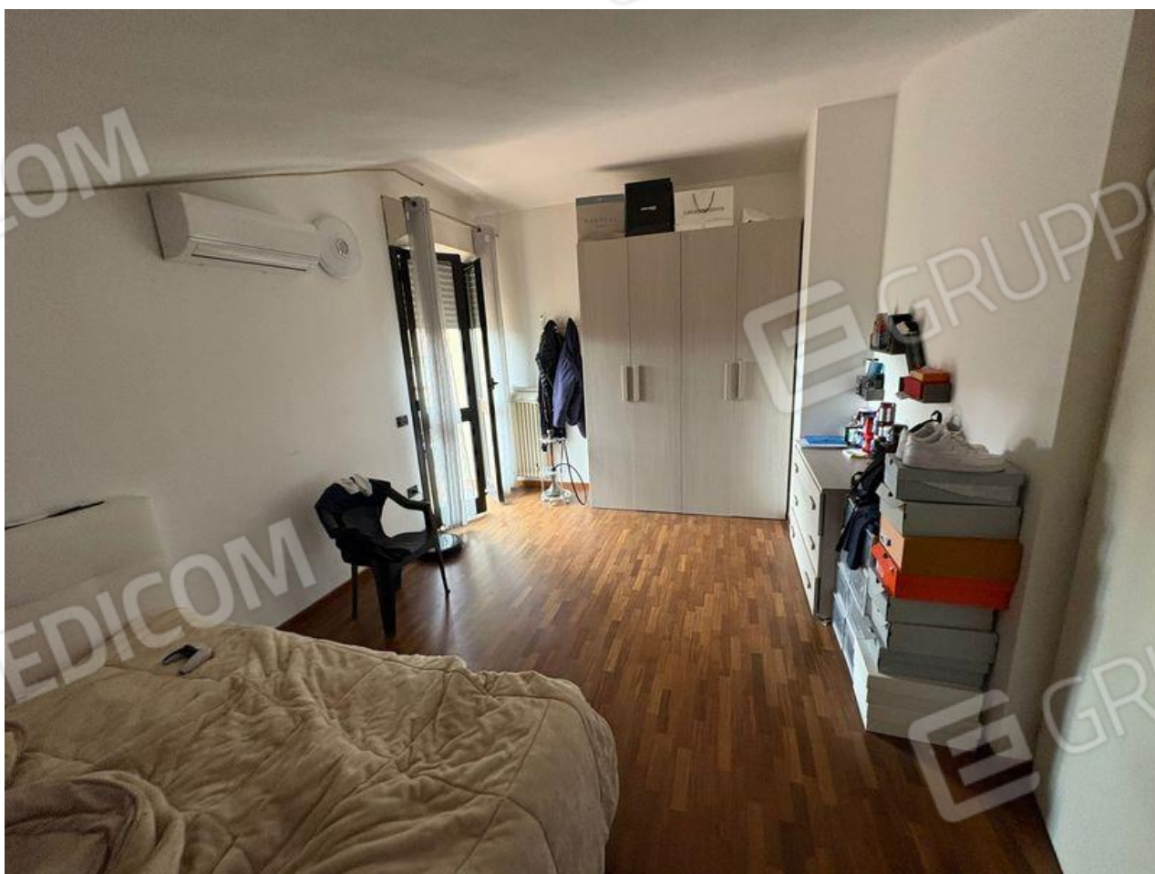
Sottotetto-Camera da letto matrimoniale-deposito occasionale 3(P2)