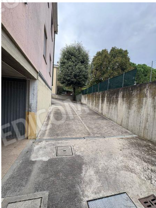
Accesso carrabile a rimessa (SI)