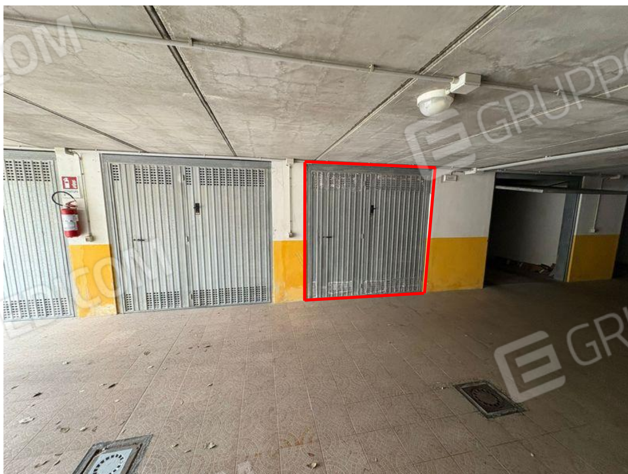
Accesso a rimessa (S1)