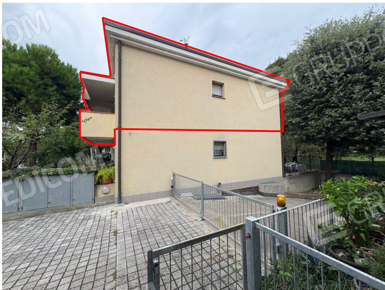
Vista laterale da via N. Bixio