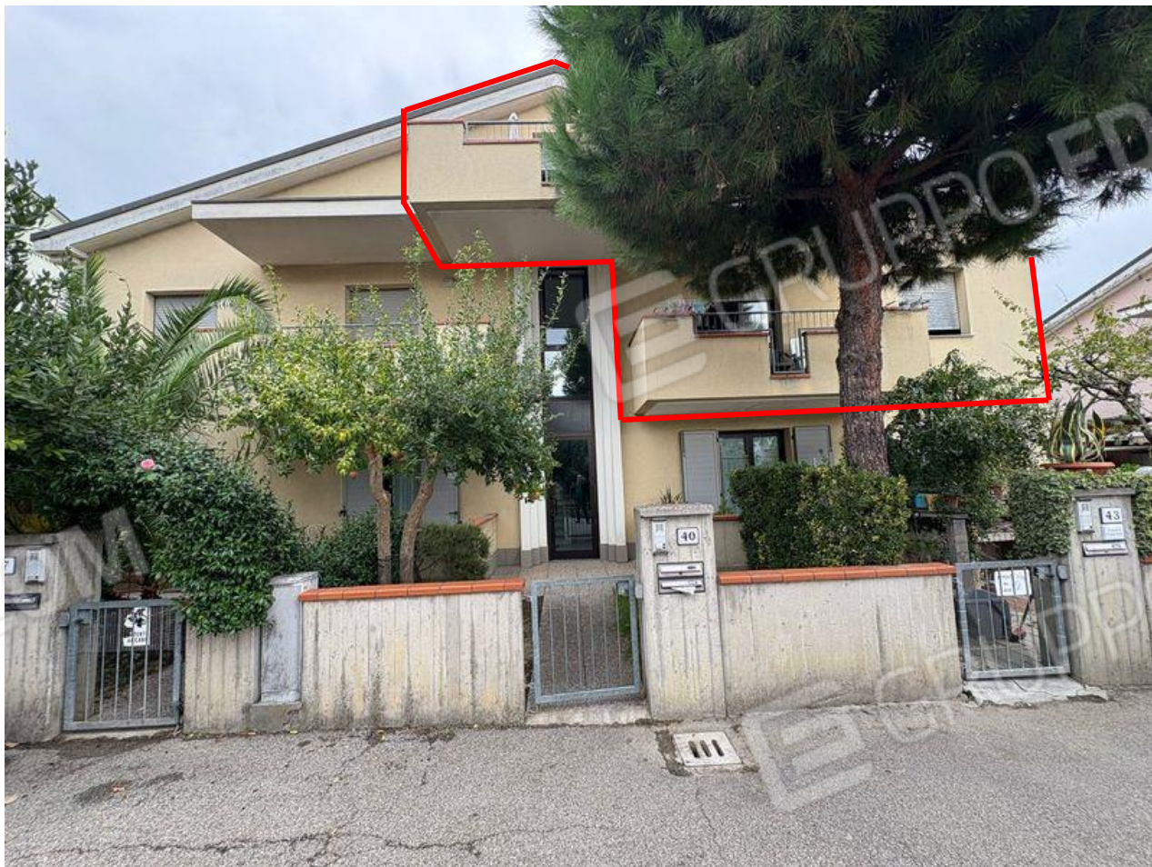
Vista sull'immobile da via N. Bixio

Via N. Bixio 40, Castel Bolognese (RA) Foglio 25, Particella 381, Subalterno 8