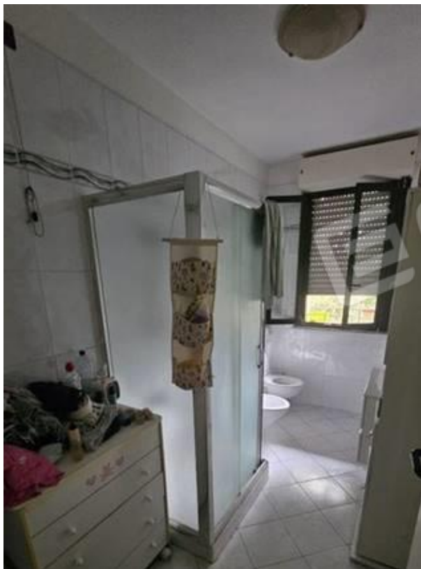
Bagno 1 (P1)