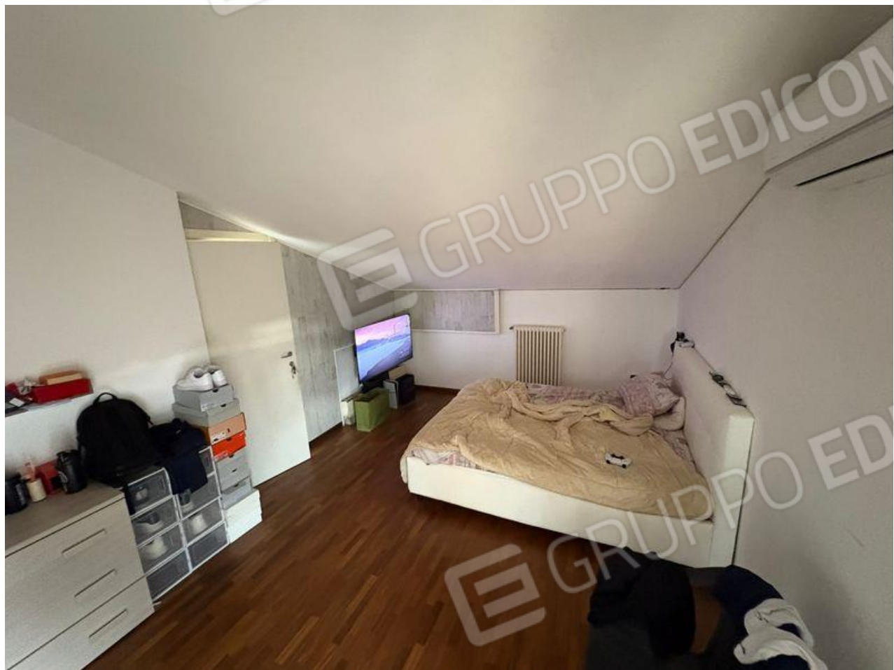
Sottotetto-Camera da letto matrimoniale (P2)