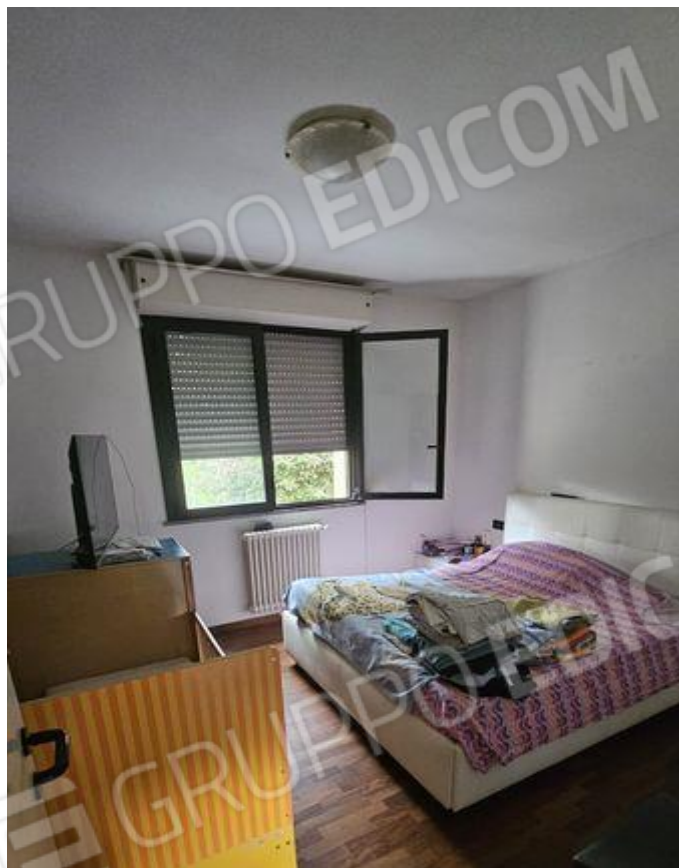
Camera 1 (P1)