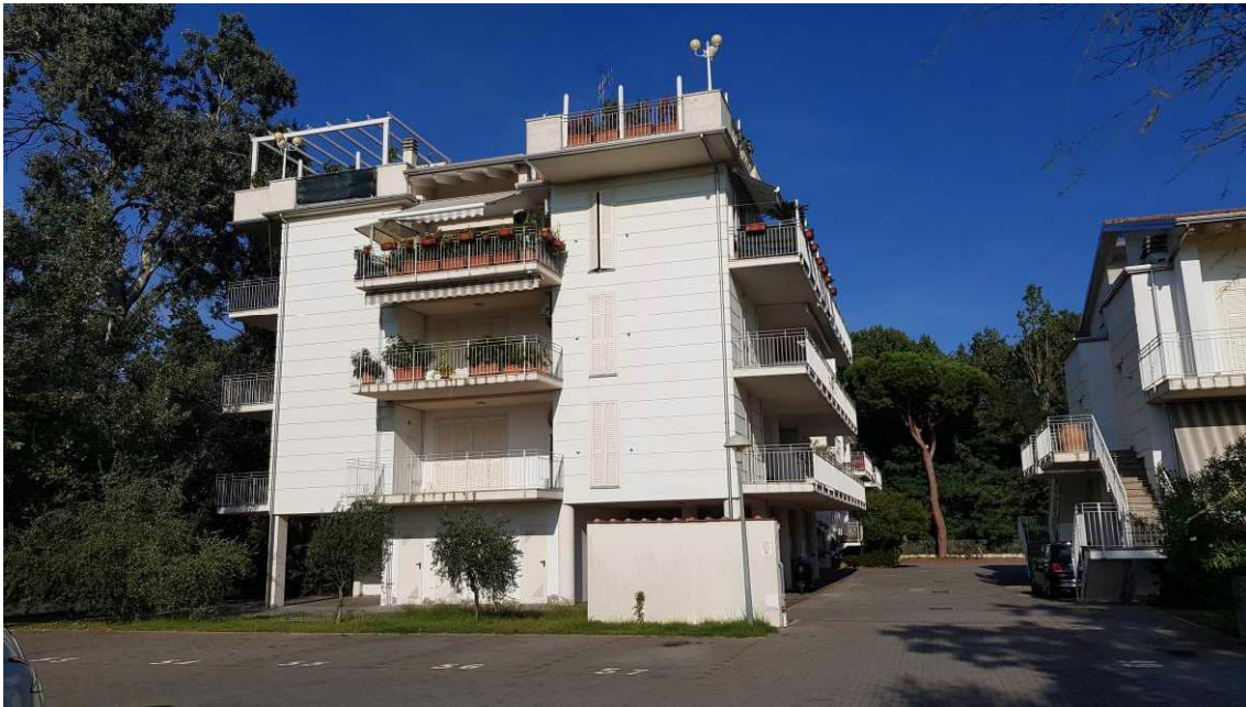
Vista esterna da Via Marina

Lotto 5 di 9 Appartamento al piano primo con ascensore e due posti auto.