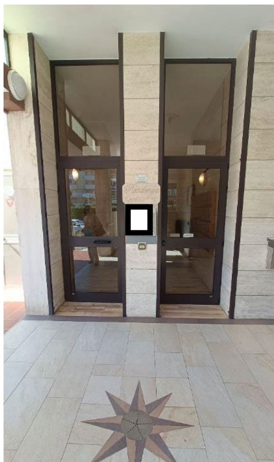
Vista esterna della porta di accesso al vano scala e ascensore