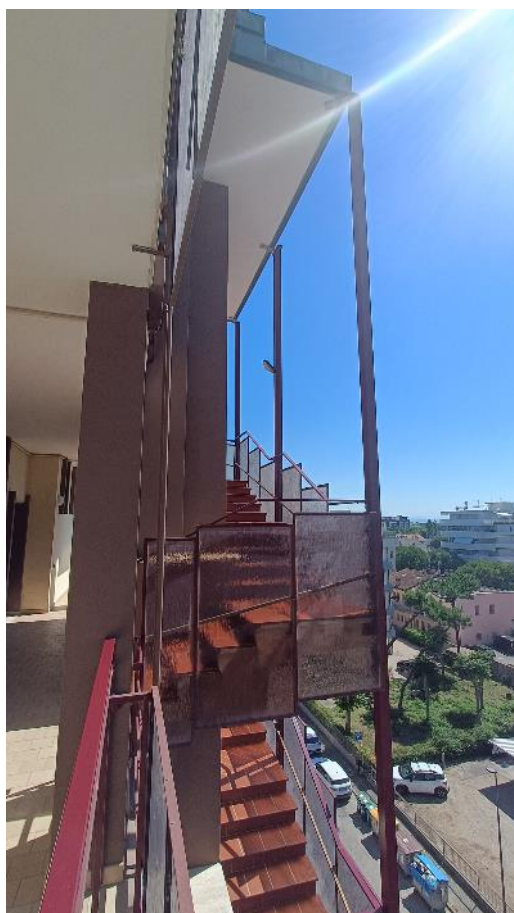
Vista della scala comune