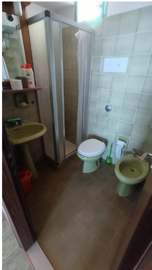
Vista del bagno