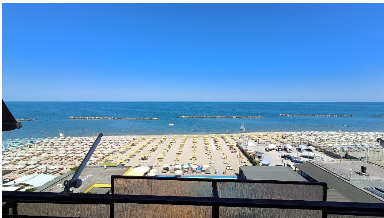
Vista mare dal balcone