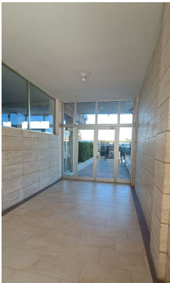
Vista del portone di accesso al cortile lato mare