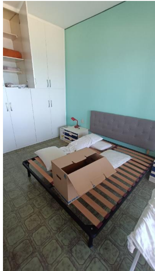
Viste del locale camera da letto