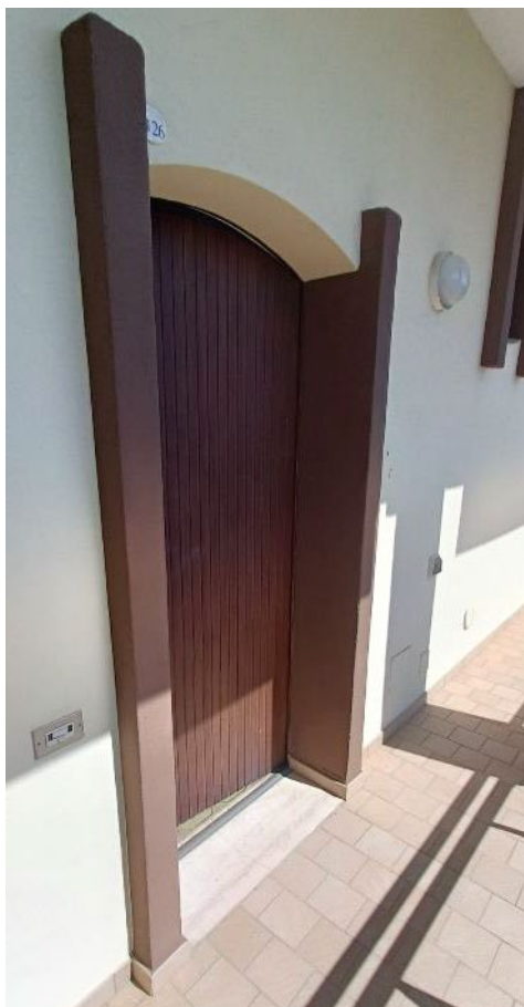
Vista ingresso appartamento (interno n.26)