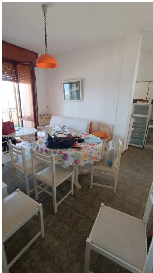
Viste del locale soggiorno