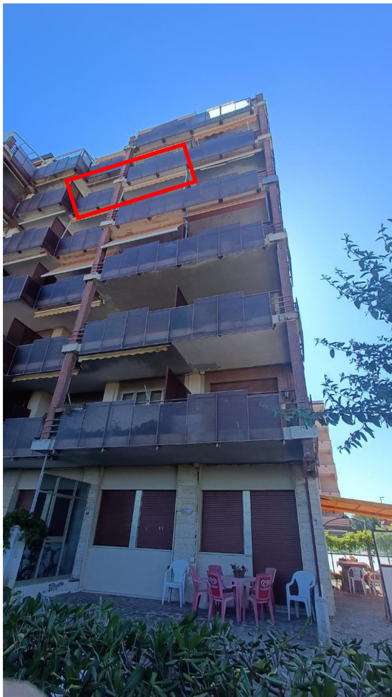
Vista esterna del fabbricato dal cortile lato mare (evidenziato in rosso appartamento oggetto di pignoramento)