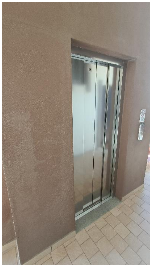
Vista dell'ascensore dall'ingresso comune