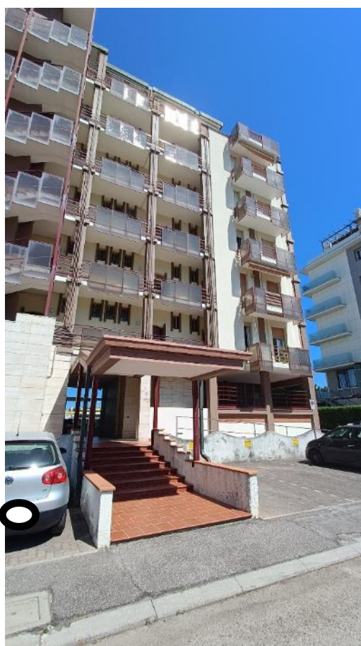
Vista ingresso principale del fabbricato di via Sarsina