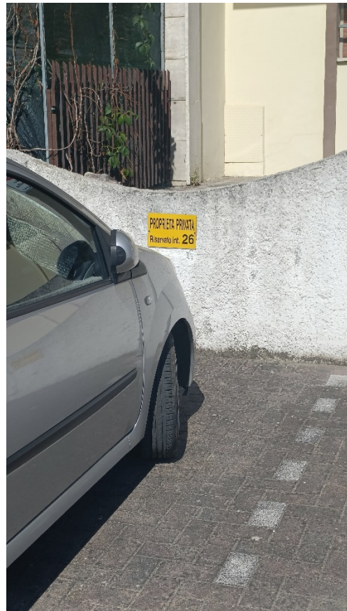
Foto del posto auto assegnato ad uso esclusivo all'interno n.26 (unità immobiliare oggetti di pignoramento) su area comune condominiale (evidenziato in rosso nella foto aerea)