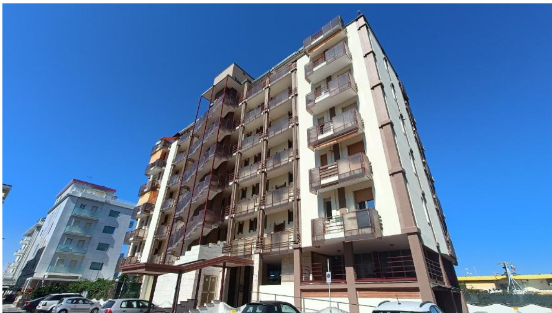
Vista esterna del fabbricato da via Sarsina