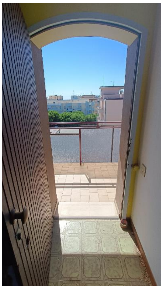
Vista interna dell'ingresso dell'appartamento