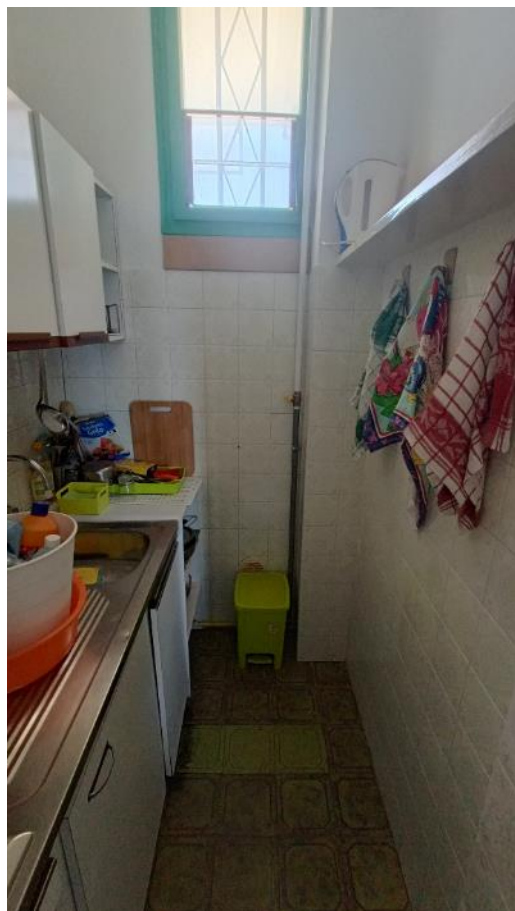
Viste della cucina