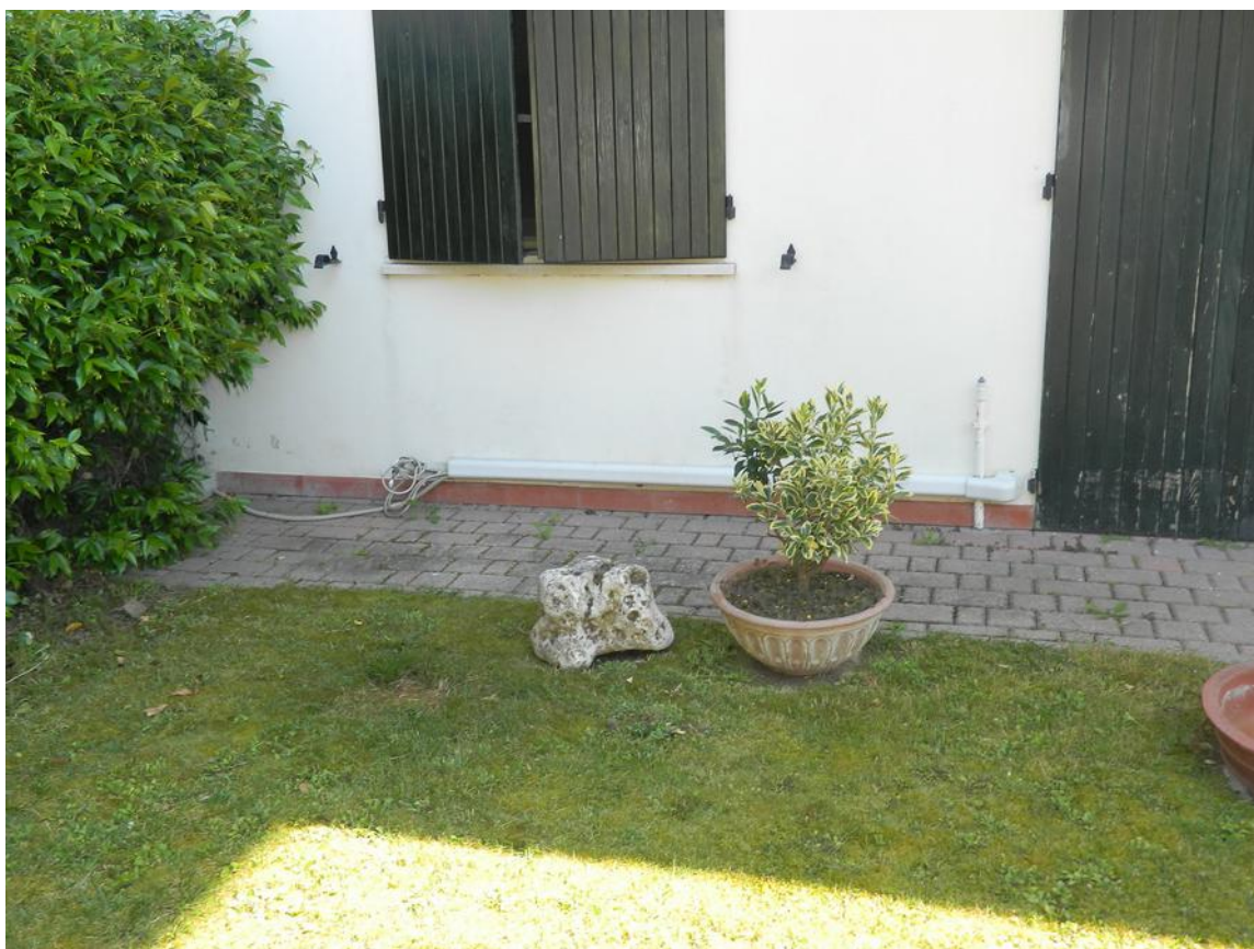
FOTO 20 – Corte esterna: predisposizione impianto climatizzazione