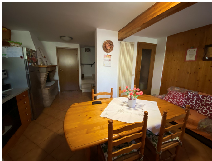
Tavernetta con camino e bagno non conformi

C.T.U. iscritto negli elenchi del Tribunale di Ravenna via Mura Torelli n.1 - Faenza - andrea.gualandri@geopec.it - cell. 348-2617501