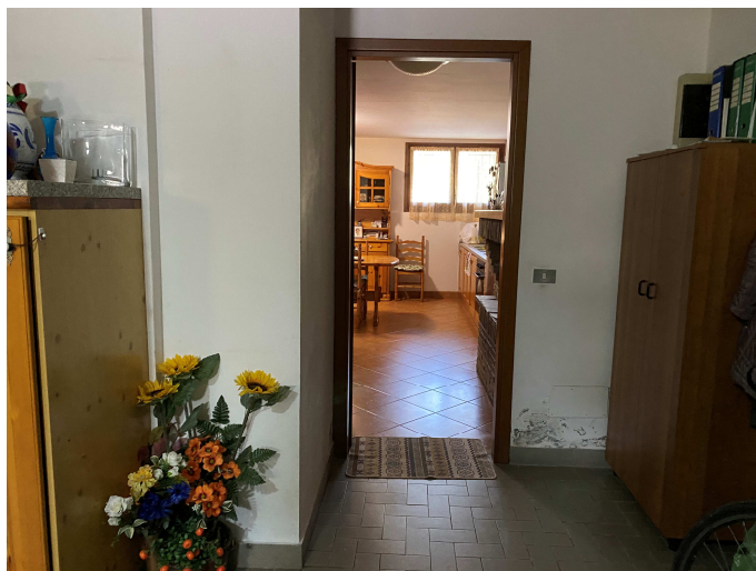
Umidità di risalita nel garage

C.T.U. iscritto negli elenchi del Tribunale di Ravenna via Mura Torelli n.1 - Faenza - andrea.gualandri@geopec.it - cell. 348-2617501