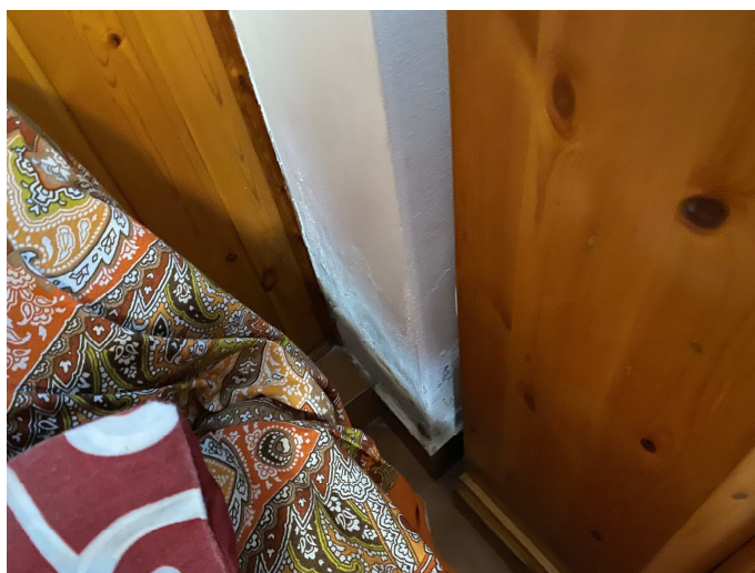
Umidità di risalita nella tavernetta