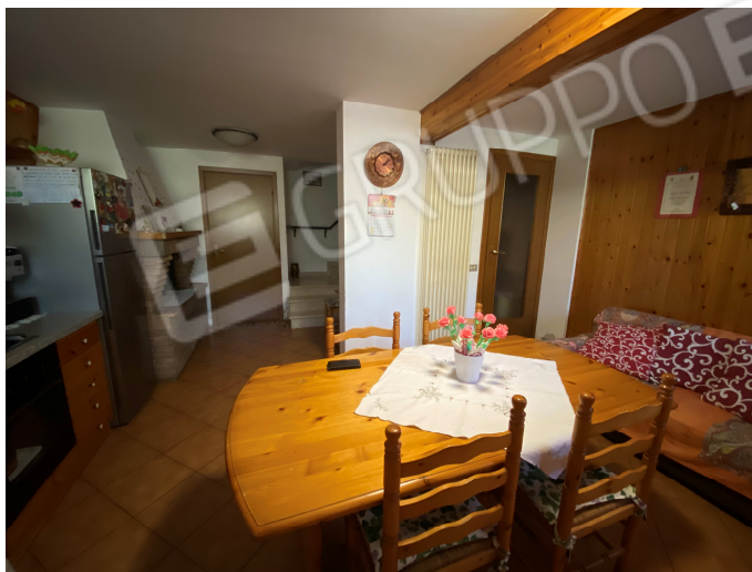
Tavernetta con camino e bagno non conformi

C.T.U. iscritto negli elenchi del Tribunale di Ravenna via Mura Torelli n.1 - Faenza - andrea.gualandri@geopec.it - cell. 348-2617501