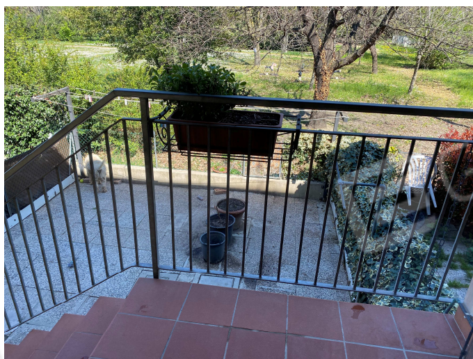
Giardino esterno pavimentato