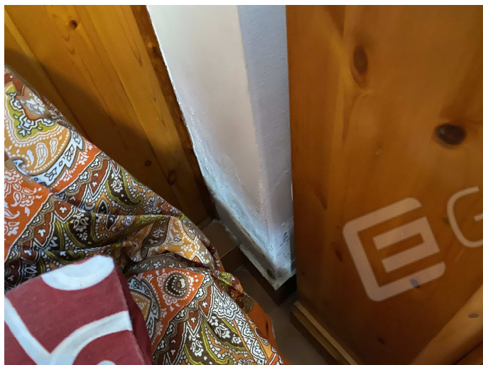
Umidità di risalita nella tavernetta