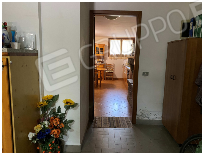
Umidità di risalita nel garage

C.T.U. iscritto negli elenchi del Tribunale di Ravenna via Mura Torelli n.1 - Faenza - andrea.gualandri@geopec.it - cell. 348-2617501