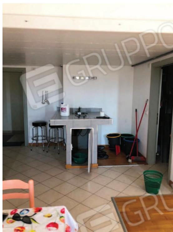
Foto n. 9 angolo cottura