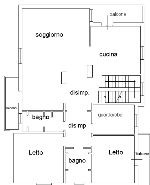
PIANO PRIMO h=2,70