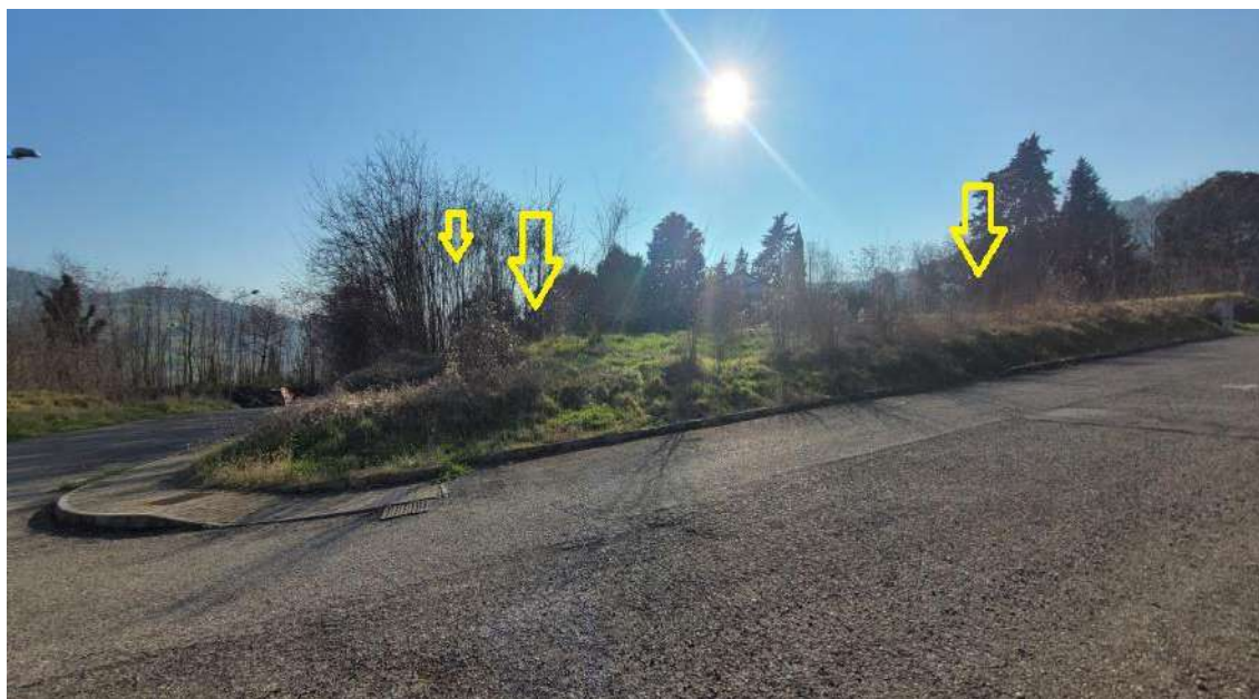
INDICAZIONE UBICAZIONE LOTTI EDIFICABILI IN OGGETTO