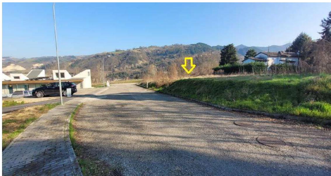
STRADA DI ACCESSO AL COMPARTO E INDICAZIONE UBICAZIONE LOTTI EDIFICABILI IN OGGETTO CON VISTA DEL NUOVO IMPIANTO SPORTIVO COMUNALE