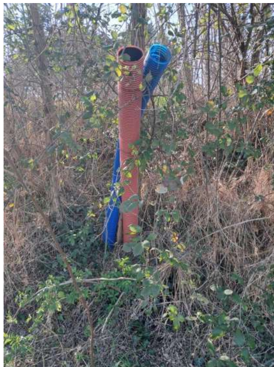
PARTICOLARI DELLO STATO DI AVANZAMENTO LAVORI OPERE DI URBANIZZAZIONE