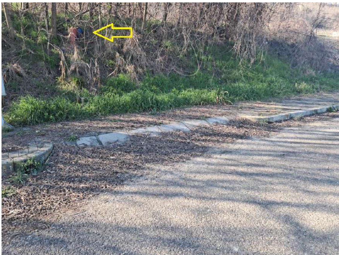
INDICAZIONE DEGLI ACCESSI CARRABILI E DELLE TUBAZIONI CORRUGATE GIÀ PREDISPOSTE PER OGNI LOTTO EDIFICABILE