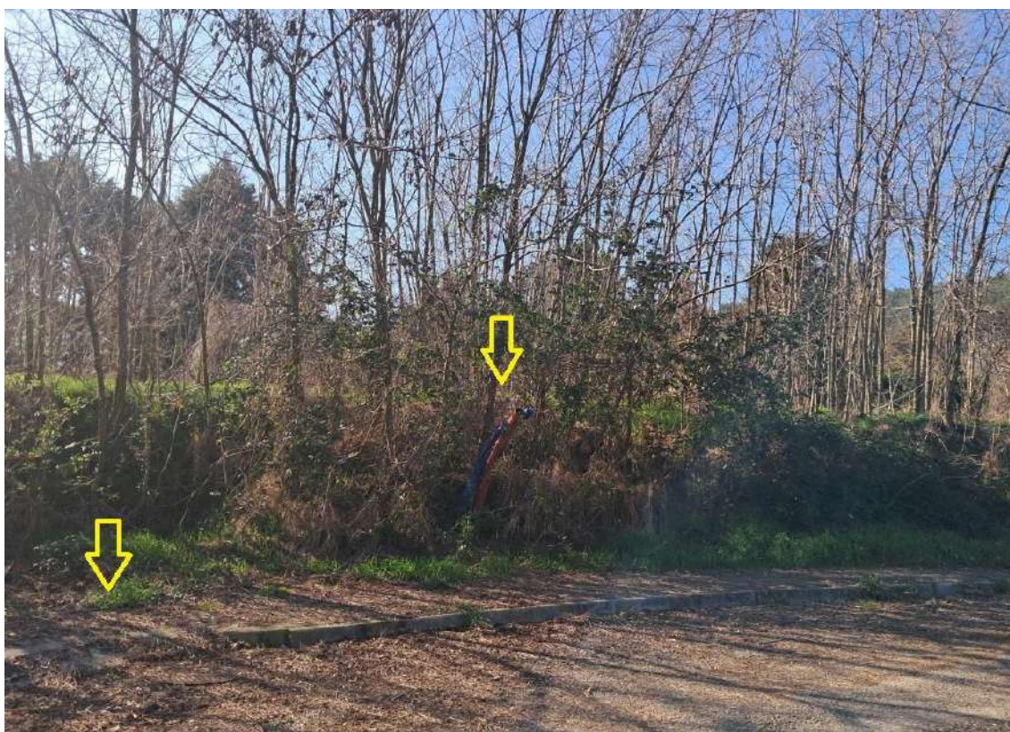
INDICAZIONE DEGLI ACCESSI CARRABILI E DELLE TUBAZIONI CORRUGATE GIA' PREDISPOSTE PER OGNI LOTTO EDIFICABILE