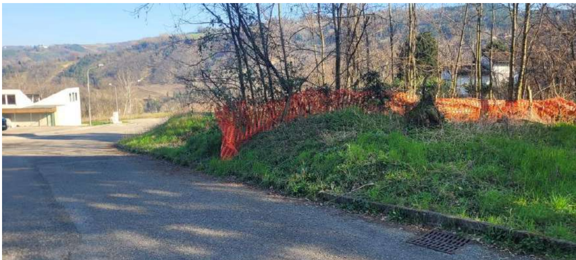
VISTA GENERALE DELL'AREA CON PARTICOLARI DELLO STATO DI AVANZAMENTO LAVORI