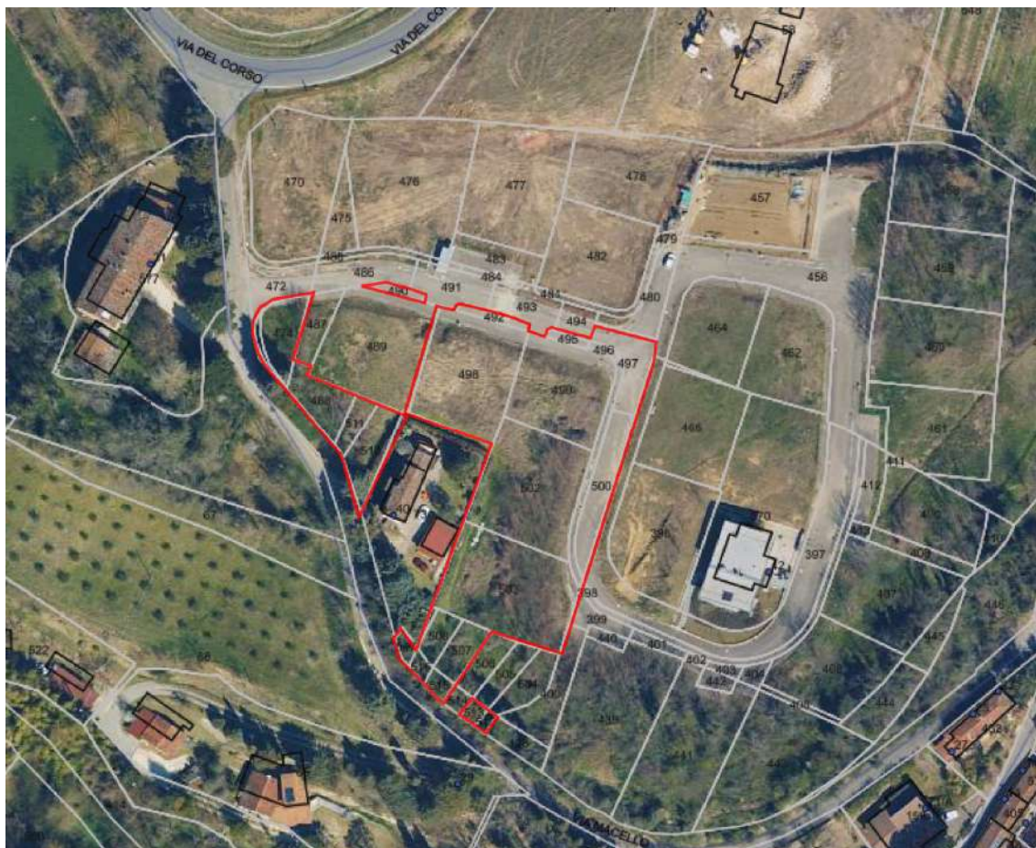
IMMAGINE SATELLITARE CON CARTOGRAFIA PARTICELLARE RIPORTATA E PERIMETRAZIONE DEI TERRENI IN OGGETTO