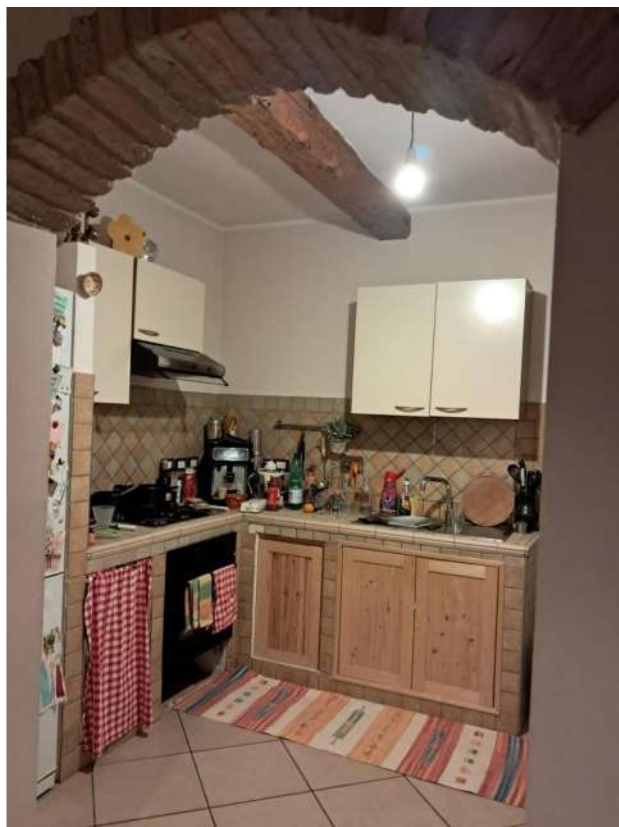
INTERNI PIANO TERRA: LOCALE PRANZO E CUCINA