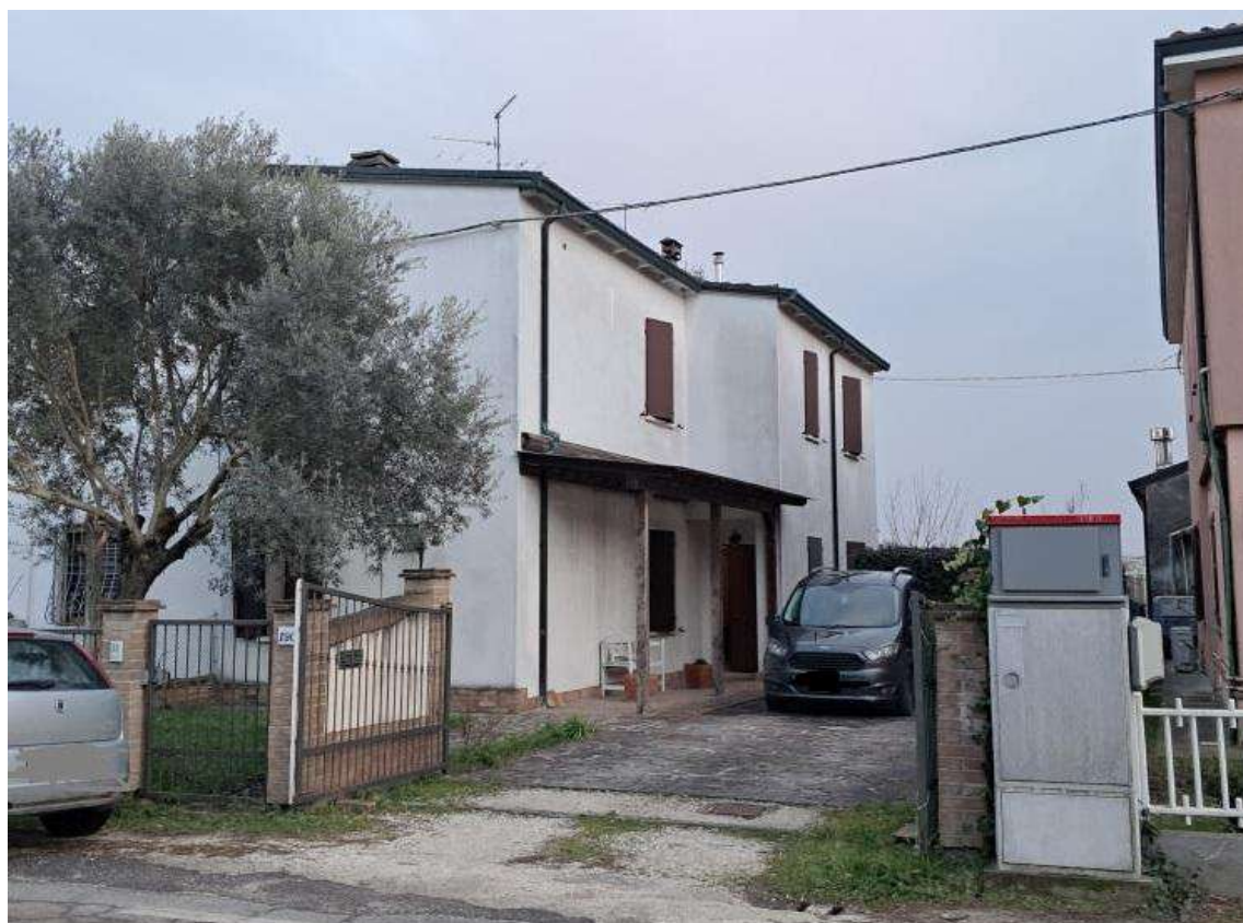
ESTERNI: VISTA DEGLI ACCESSI ALL'ABITAZIONE: CANCELLO CARRABILE E CANCELLINO PEDONALE