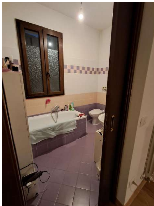
INTERNI PIANO PRIMO: DISIMPEGNO E BAGNO