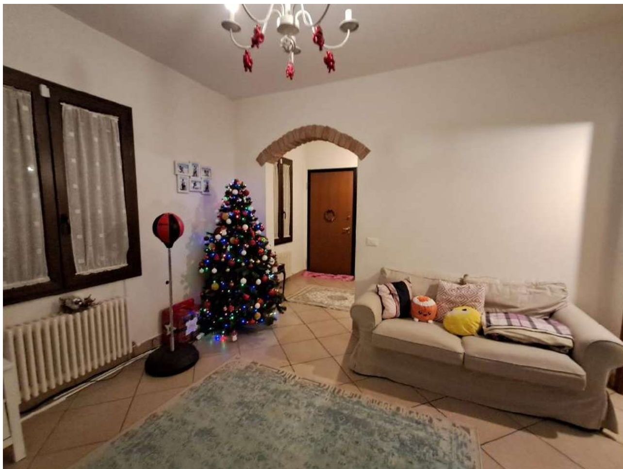
INTERNI PIANO TERRA: LOCALE SOGGIORNO