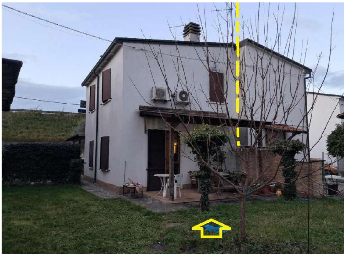
ESTERNI: VISTA PROSPETTO EST – CORTE ESCLUSIVA / GIARDINO