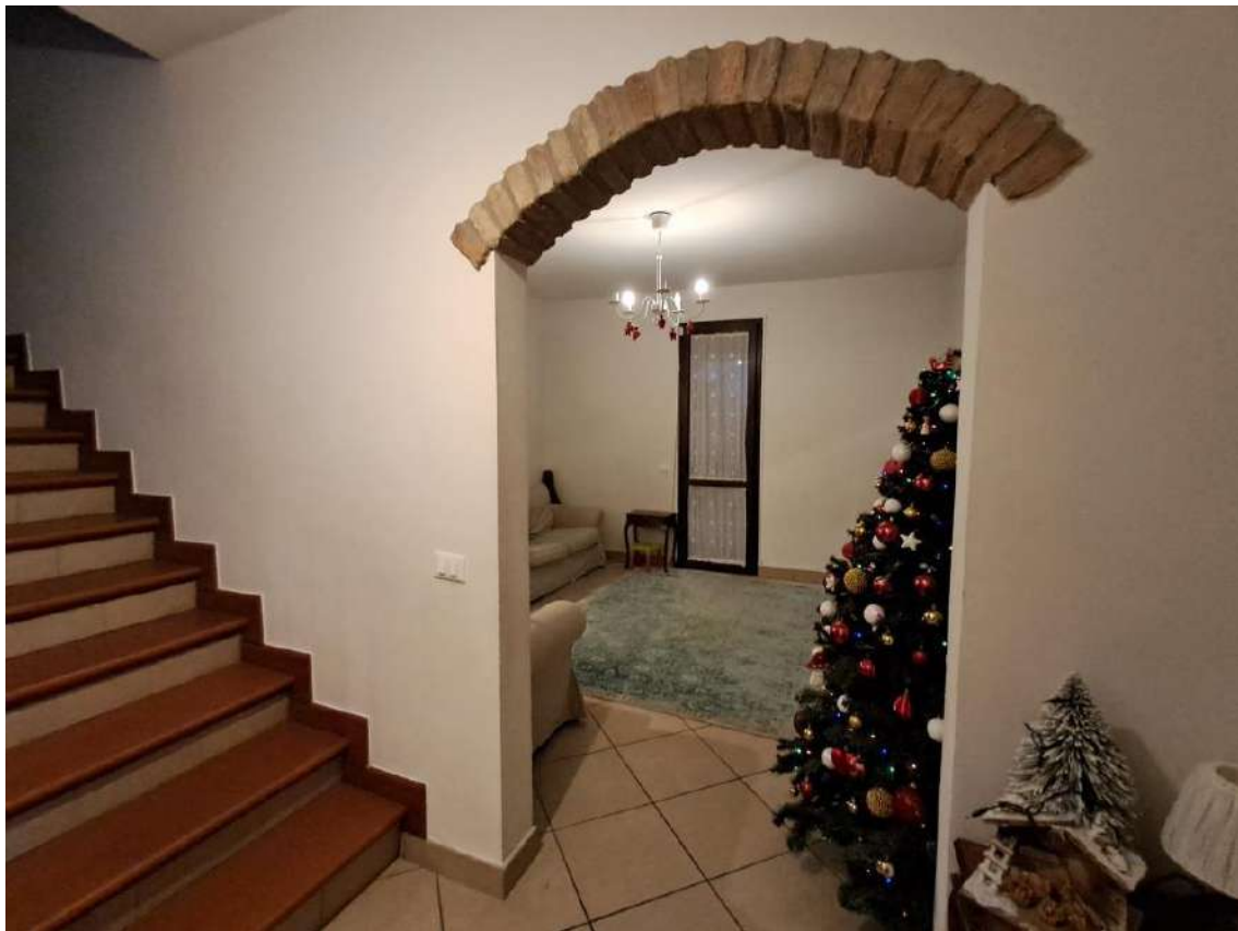
INTERNI: VISTA INGRESSO ABITAZIONE E VANO SCALA