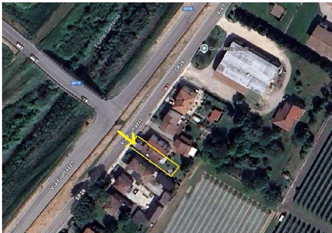
IMMAGINE SATELLITARE CON INDICAZIONE DEL LOTTO E DELL'ACCESSO ALLA VIA FIUMAZZO