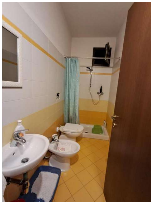
INTERNI PIANO TERRA: DISIMPEGNO E BAGNO