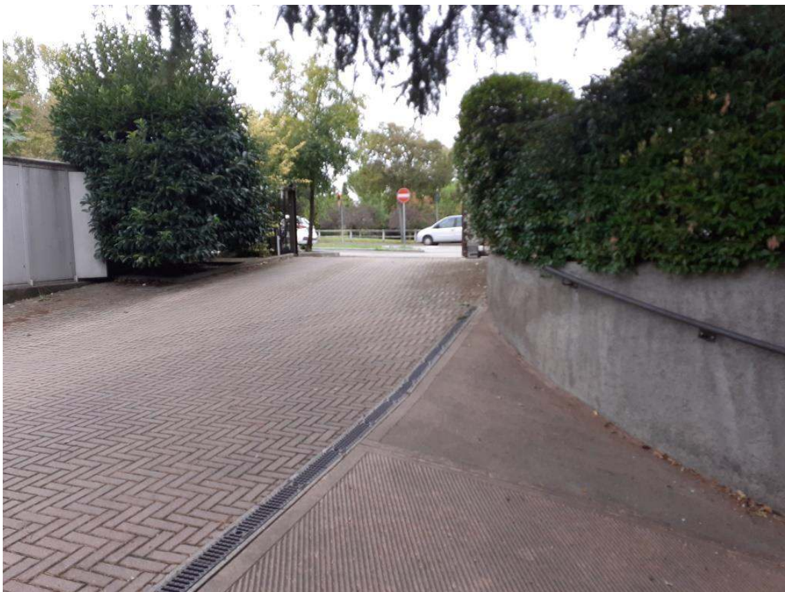
RAMPA DI INGRESSO ALLA RIMESSA INTERRATA