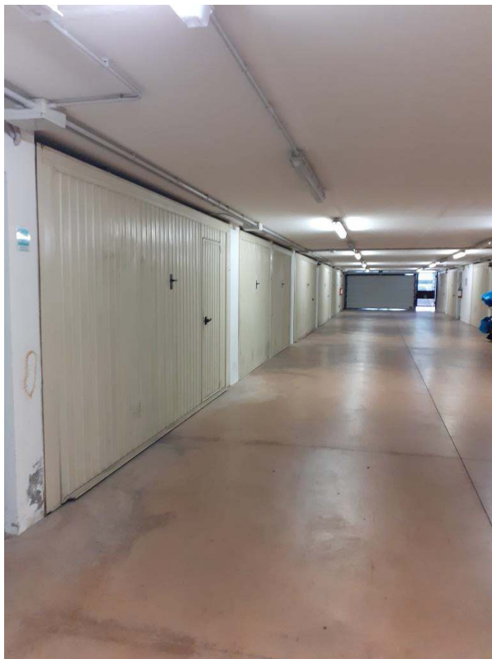
CORSIA CARRABILE ALL'INTERNO DELLA RIMESSA AL PIANO SOTTOSTRADA