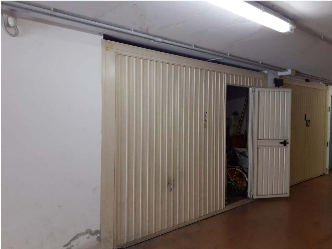
U.I. SUB 18 – PORTONE BASCULANTE DEL GARAGE CON PORTA PEDONALE