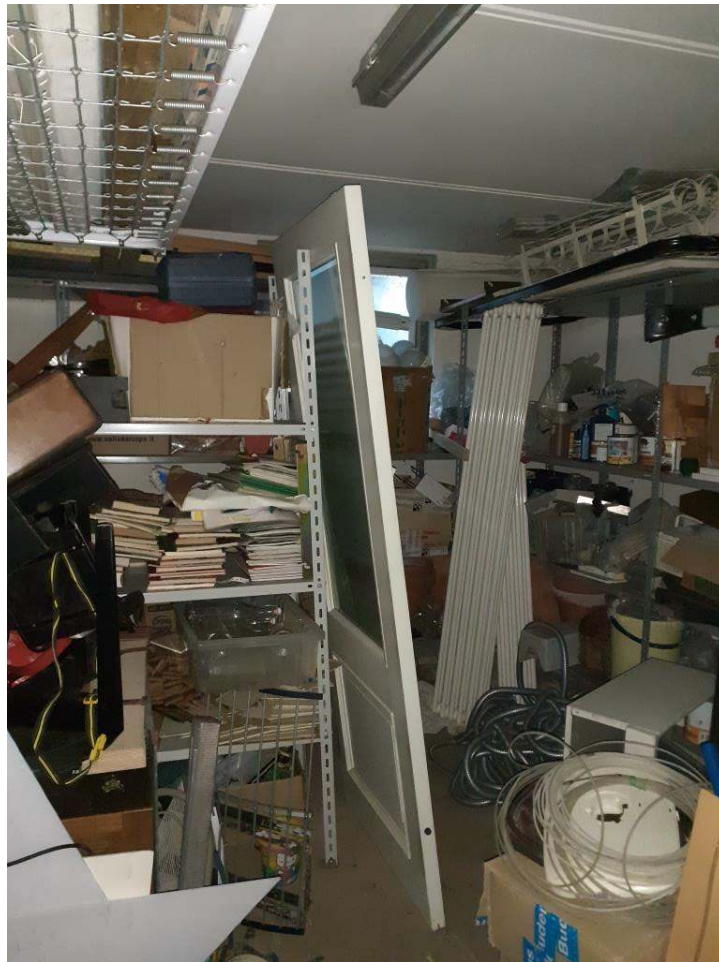
U.I. SUB 18 – INTERNO