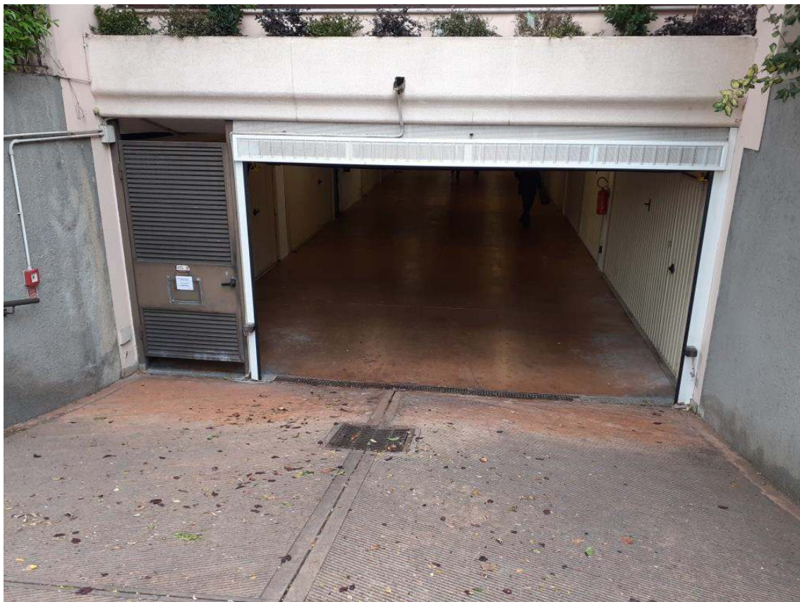
INGRESSO DELLA RIMESSA INTERRATA AL PIANO SOTTOSTRADA