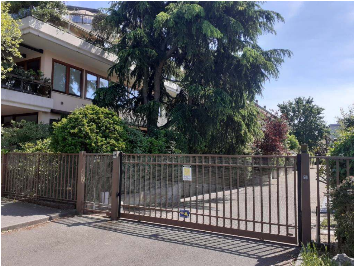
VISTA LATO OVEST DEL FABBRICATO "A" – INGRESSO CARRABILE VIA CILLA N.44 CON CANCELLO MOTORIZZATO