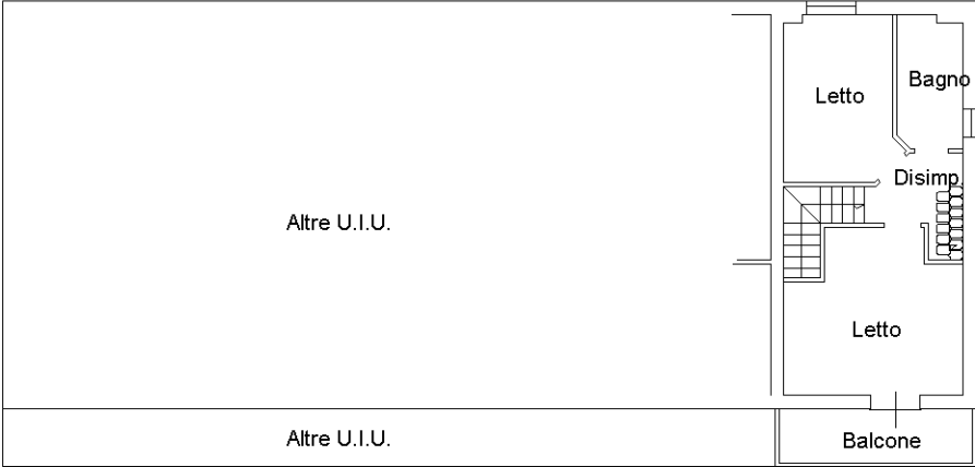
PIANO PRIMO h = 2.70