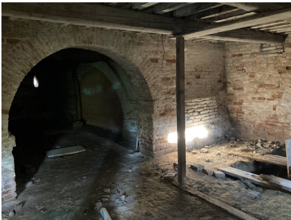
INGRESSO – PARTE COMUNE IDENTIFICATO BCNC SUB. 16