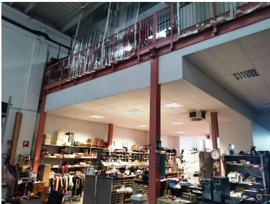
INTERNI: PIANO TERRA E SOPPALCO DESTINATO A DEPOSITO OCCASIONALE E UFFICI