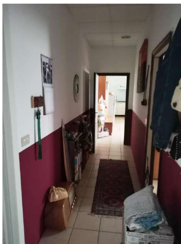
INTERNI: PARTICOLARE SCALA DI ACCESSO AL PIANO PRIMO E DISIMPEGNO AL PIANO PRIMO