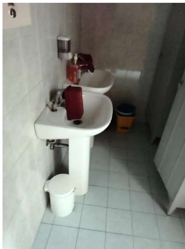
INTERNI: SERVIZI W.C./SPOGLIATOI AL PIANO TERRA