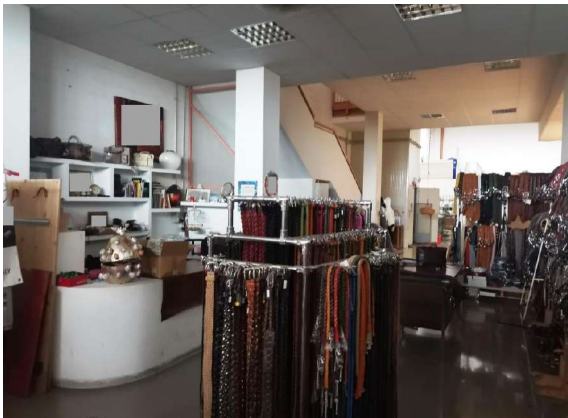
INTERNI: PIANO TERRA – LABORATORIO ARTIGIANALE