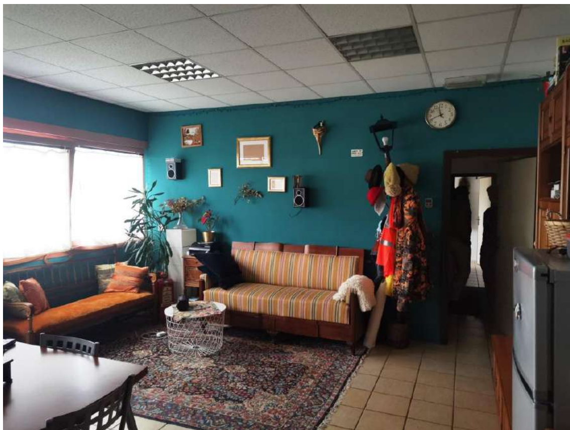
INTERNI: LOCALE TIPO DEGLI UFFICI AL PIANO PRIMO