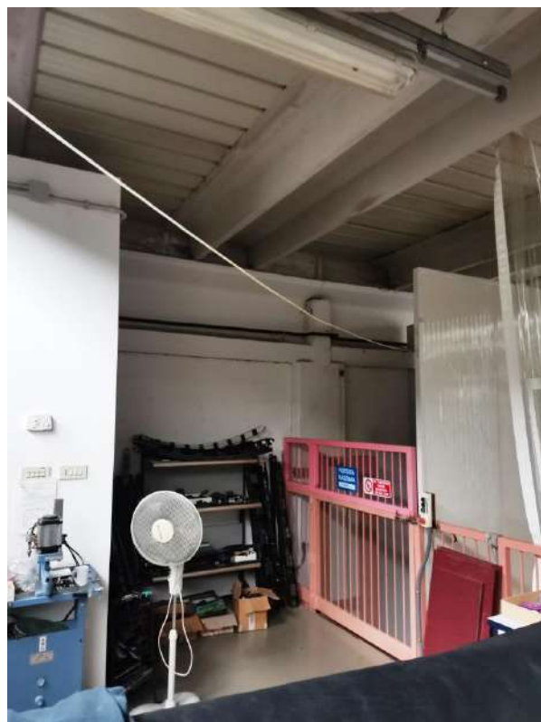
INTERNI: PARTICOLARE ACCESSO AL MONTACARICHI PIANO TERRA E PIANO PRIMO