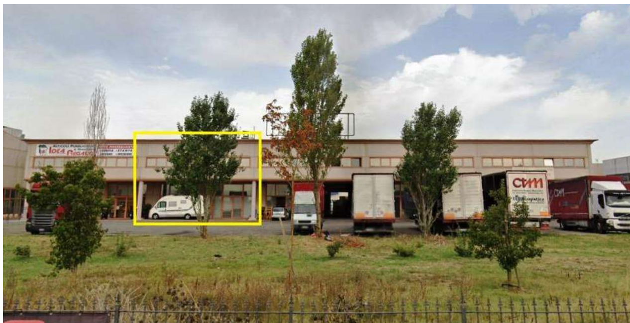
VISTA PROSPETTO SUD DEL COMPLESSO "GIULIO CESARE" DALLA VIA BOLLANA E INDICAZIONE DELL'UNITA' IN OGGETTO