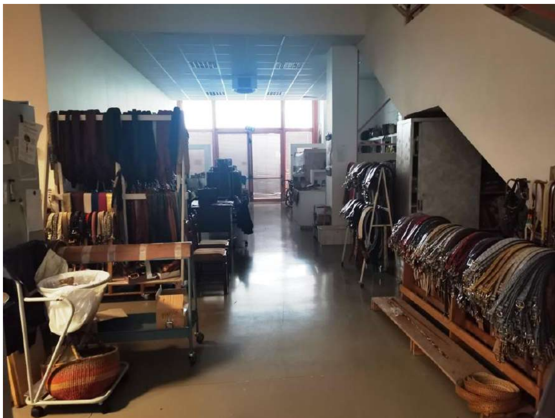
INTERNI: PIANO TERRA – LABORATORIO ARTIGIANALE