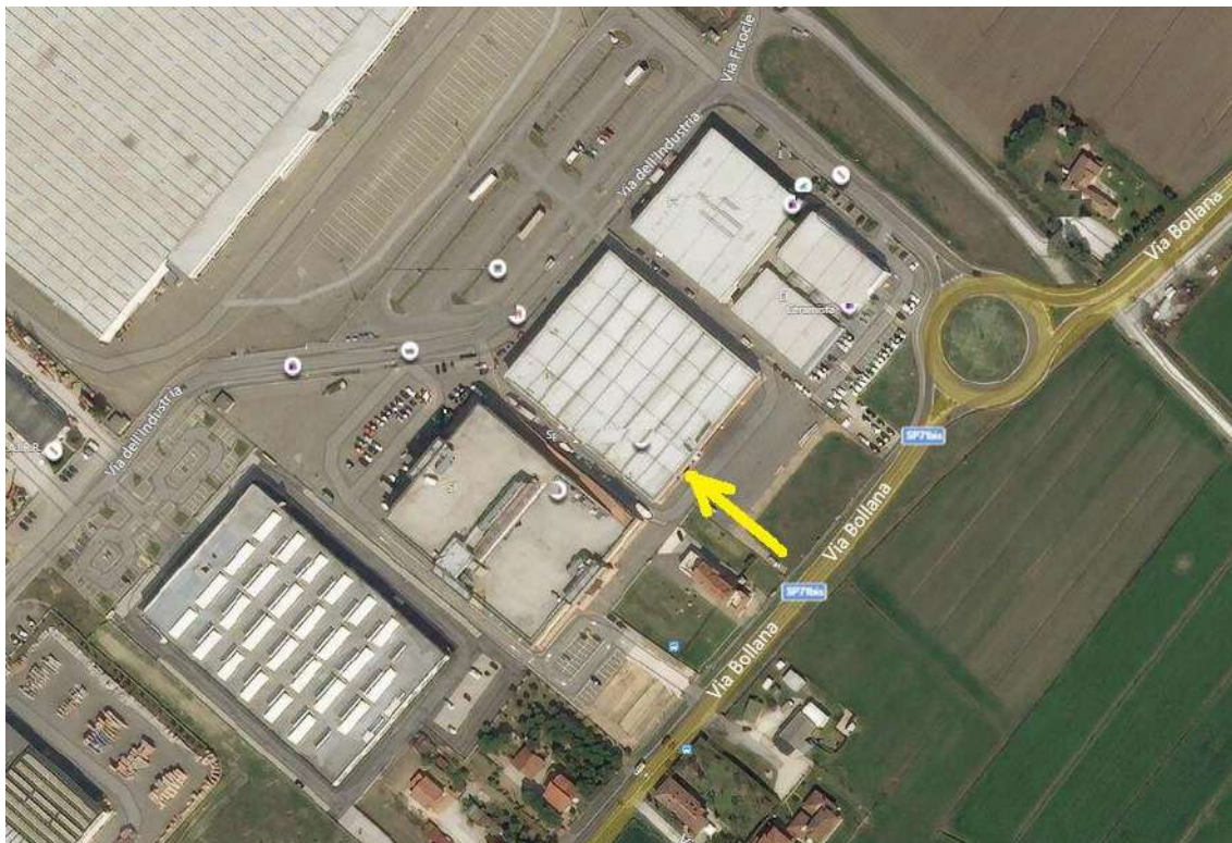
IMMAGINE SATELLITARE UBICAZIONE LABORATORIO ARTIGIANALE (CATASTO CERVIA – FG. 81 MAPPALE 297 – SUB 9) VIA DELL'INDUSTRIA N. 13 INT. 9 – CERVIA - LOCALITA' MONTALETTO