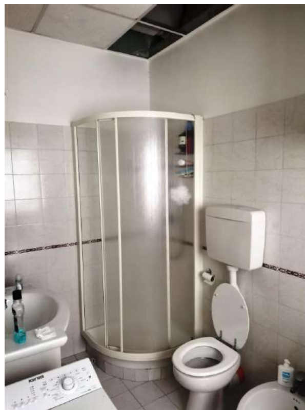
INTERNI: ANTIBAGNO E BAGNO AL PIANO PRIMO