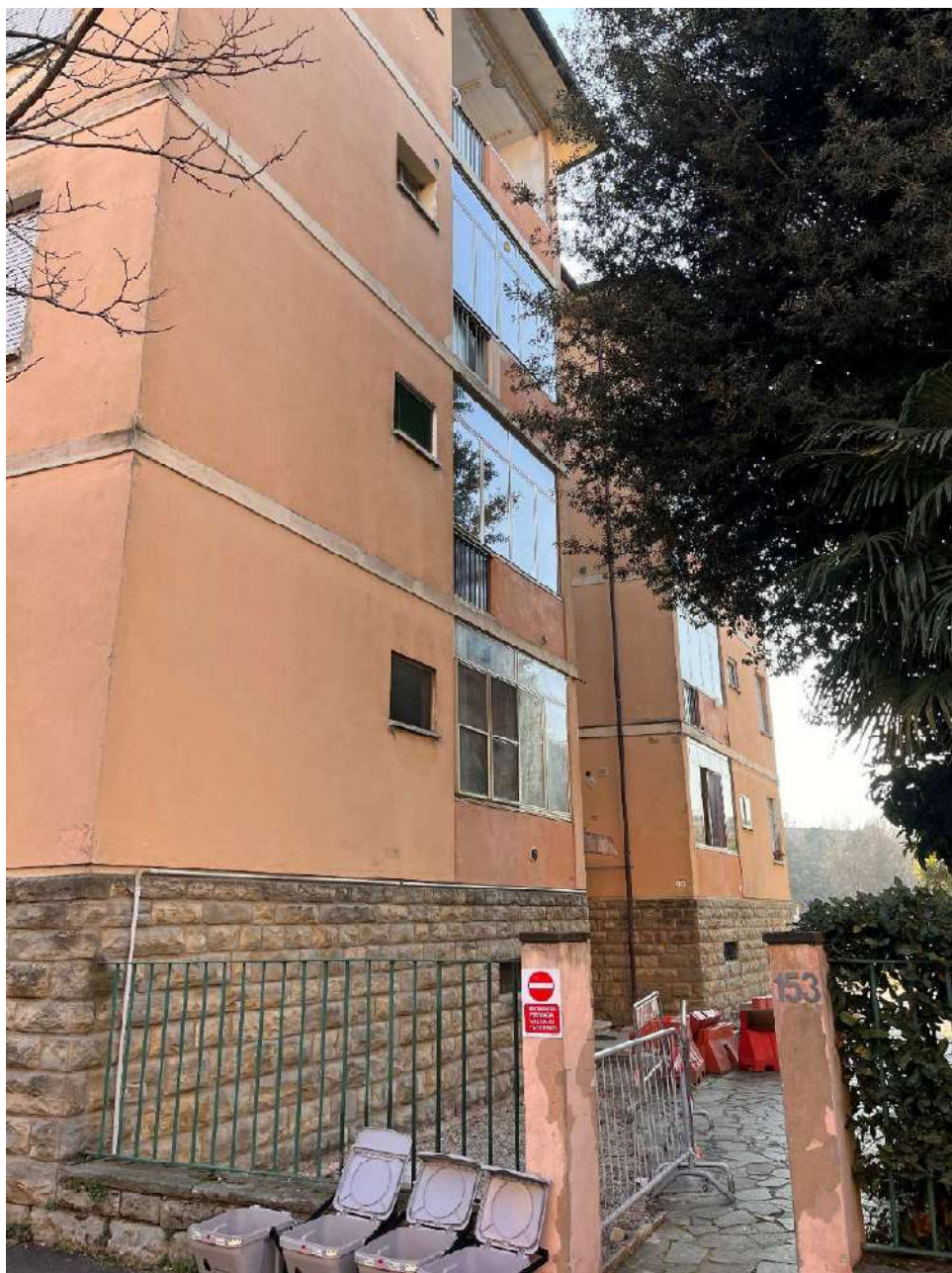
Accesso da via T. Gulli n.153