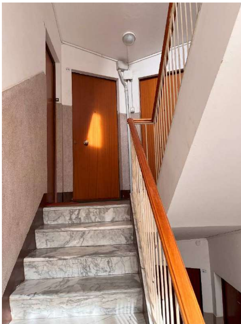
Porta ingresso appartamento