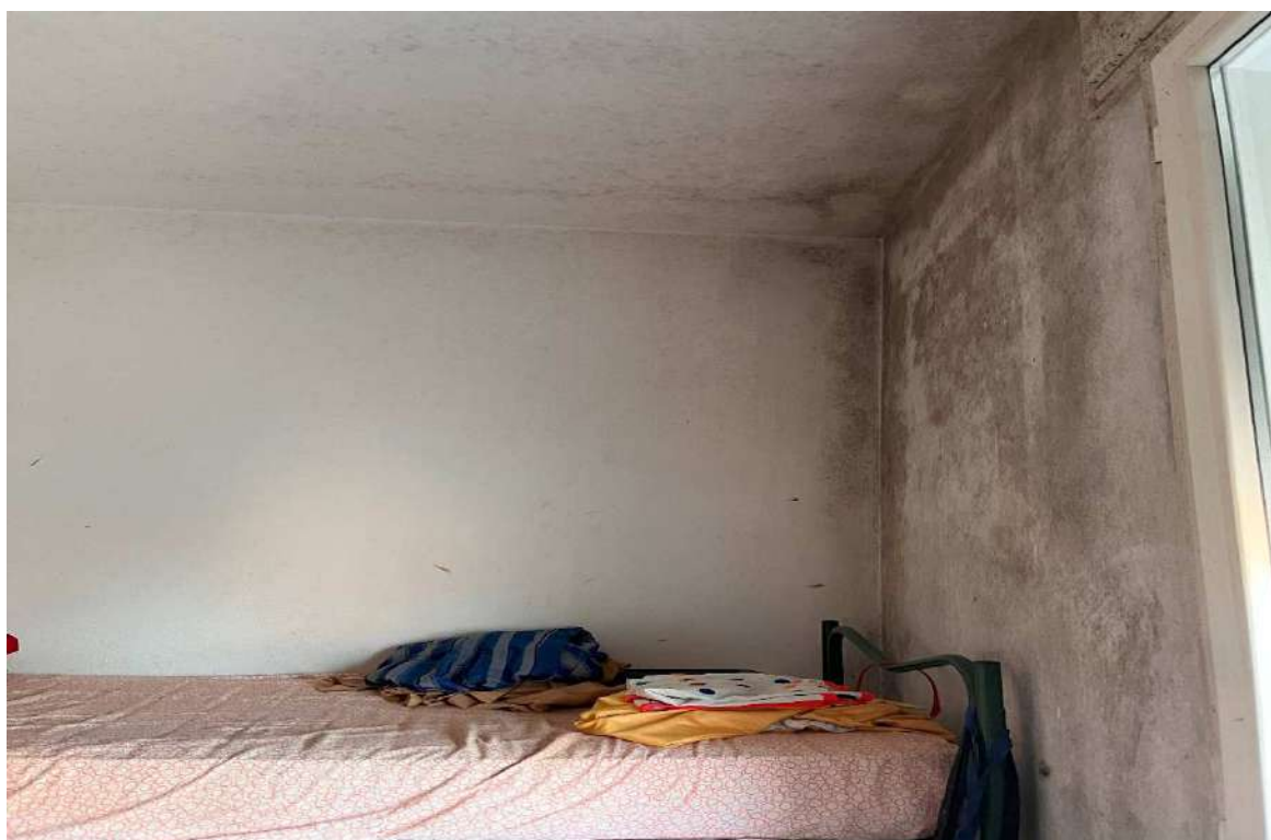
Camera da letto 1