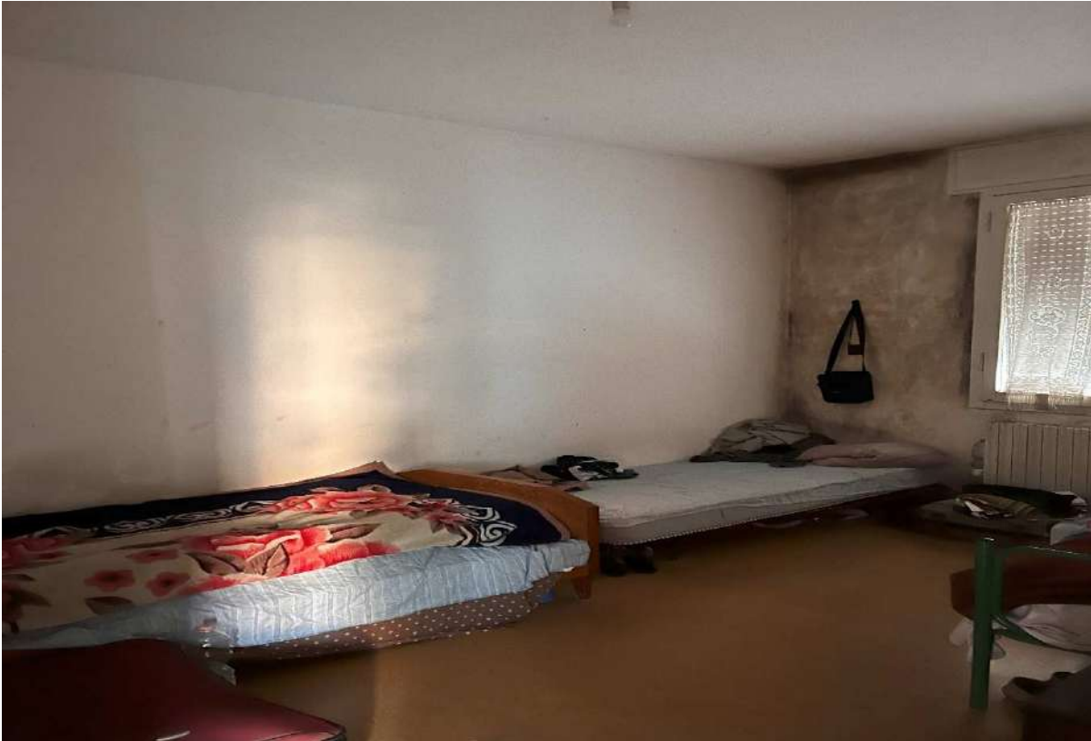
Camera da letto 2