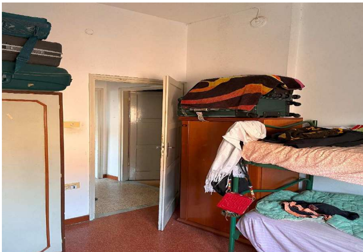
Camera da letto 1