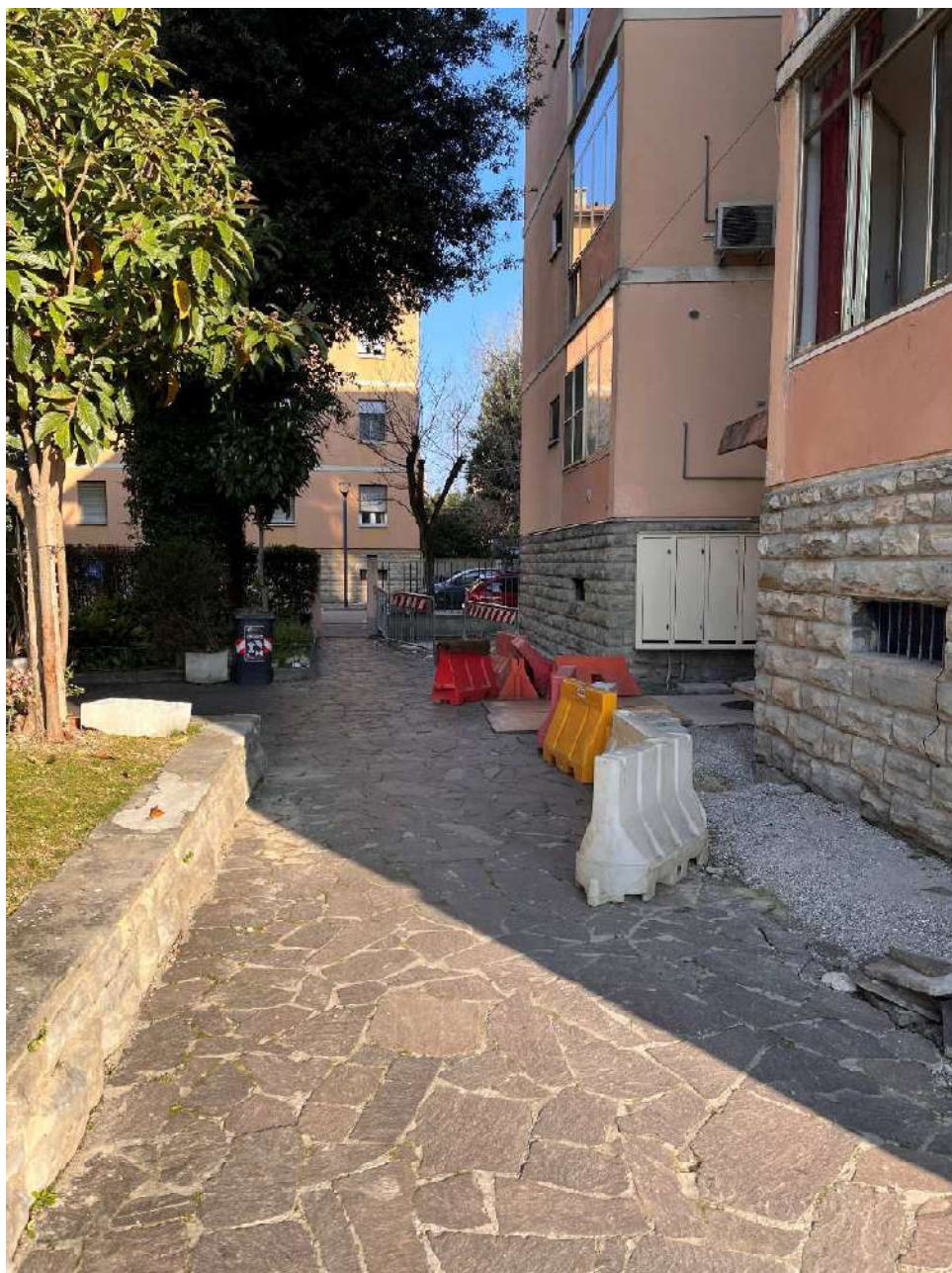
Vista accesso da corte comune interna