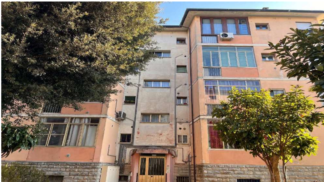
Vista facciata con ingresso condominiale