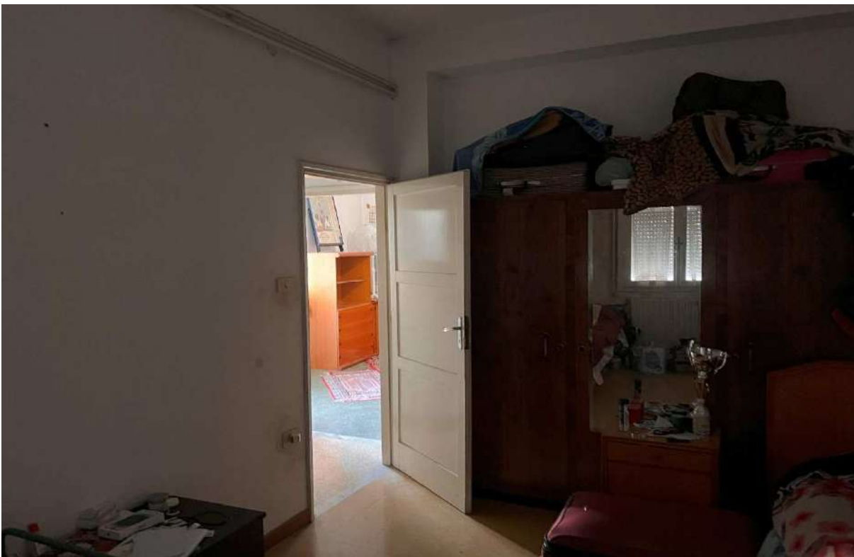
Camera da letto 2