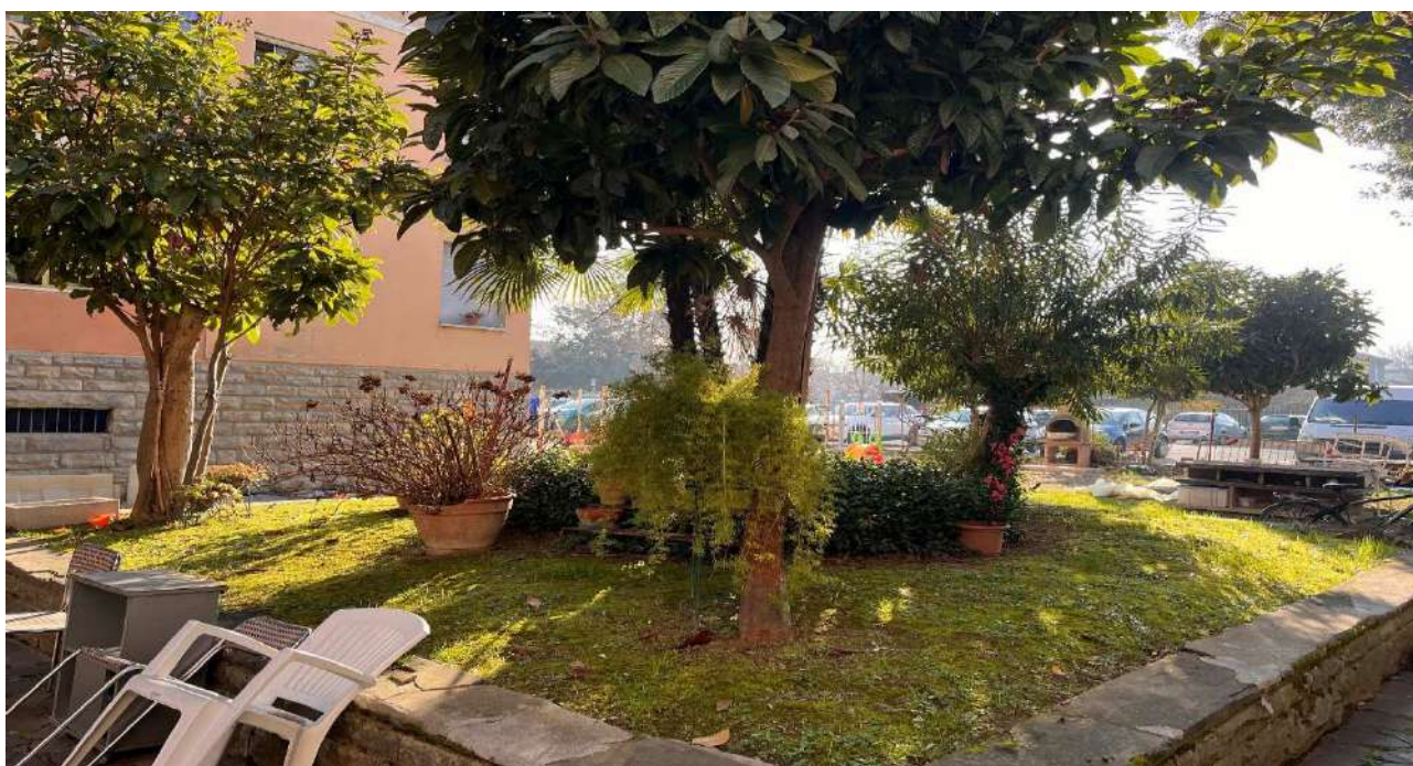
Parte di corte comune interna