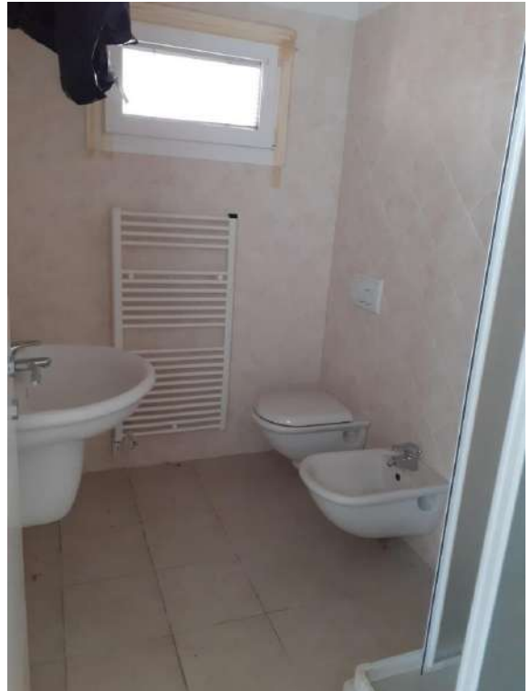
SUB 7 INTERNI: DISIMPEGNO E BAGNO