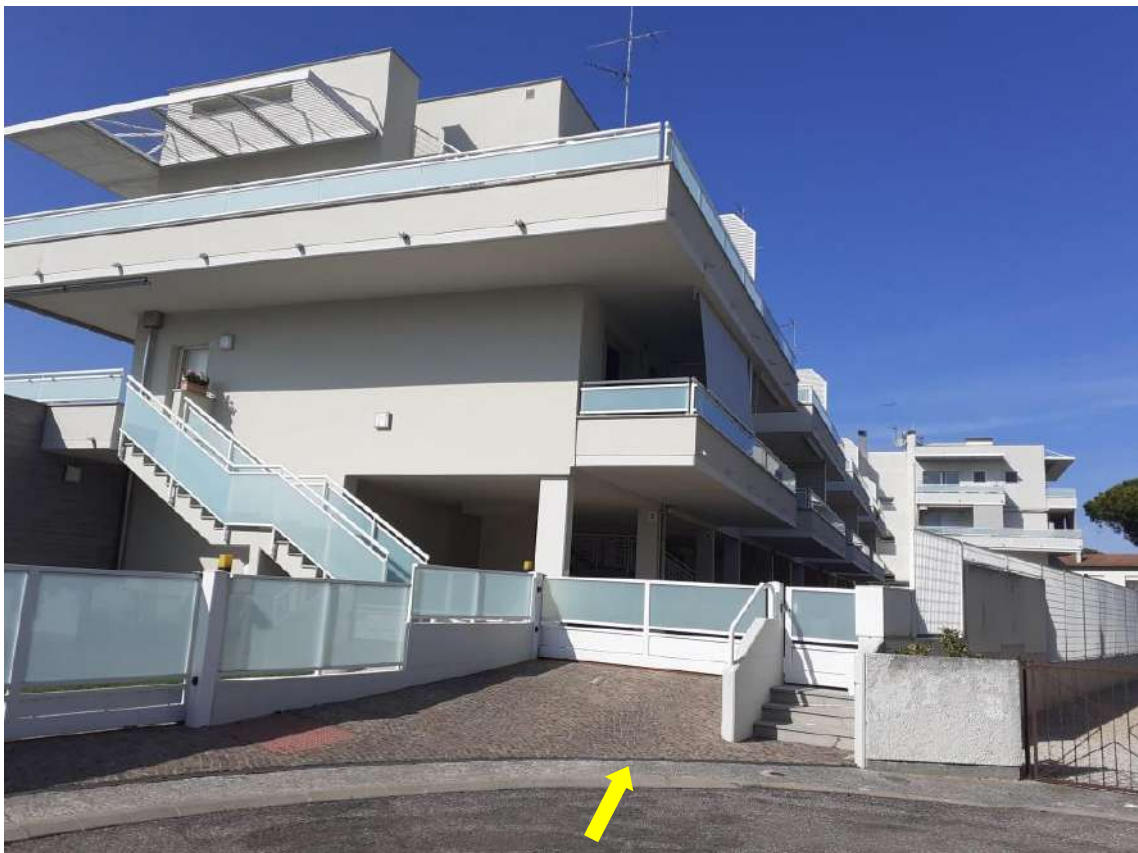
VISTA PROSPETTO SUD E INGRESSI SU VIA C. ABBA E INGRESSO CARRABILE DA VIA G. GARIBALDI