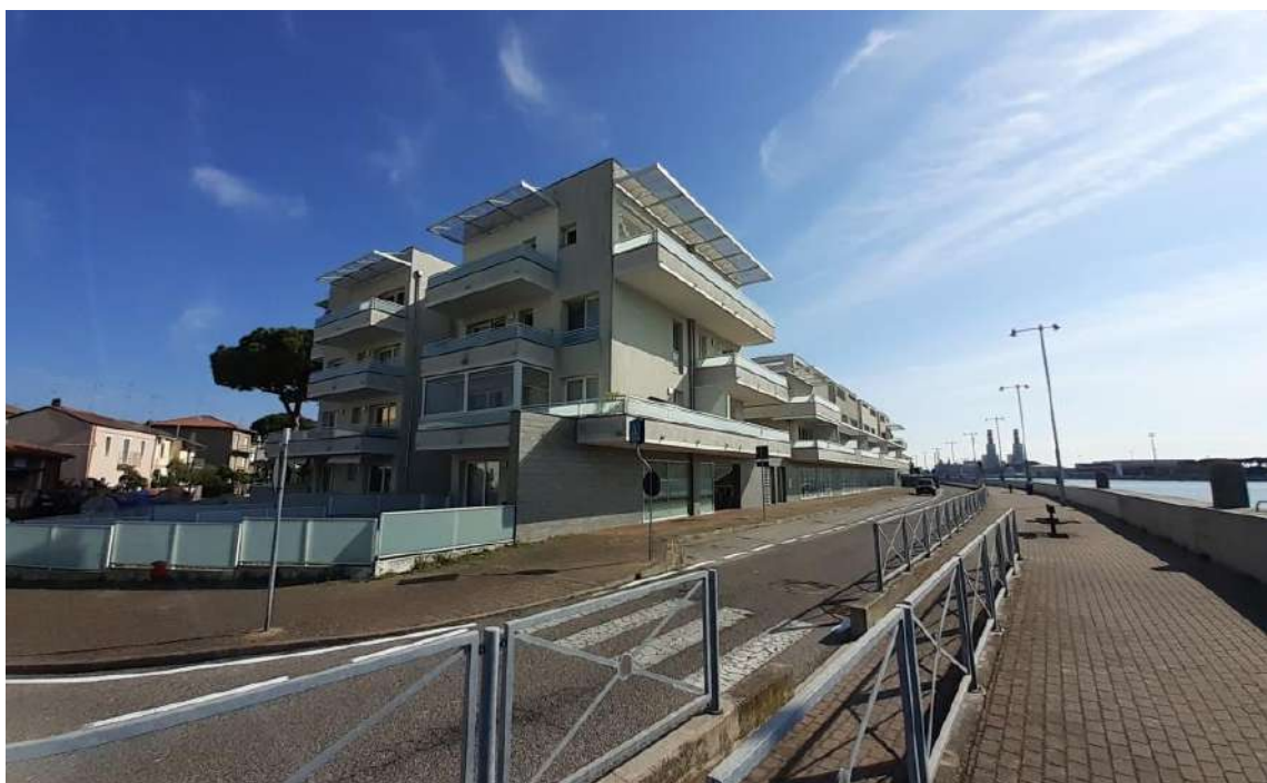
VISTA PROSPETTI NORD E OVEST DALLA VIA FOCA MONICA