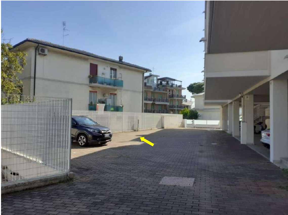
VISTA CORTILE INTERNO E UBICAZIONE SUB 41 POSTO AUTO SCOPERTO