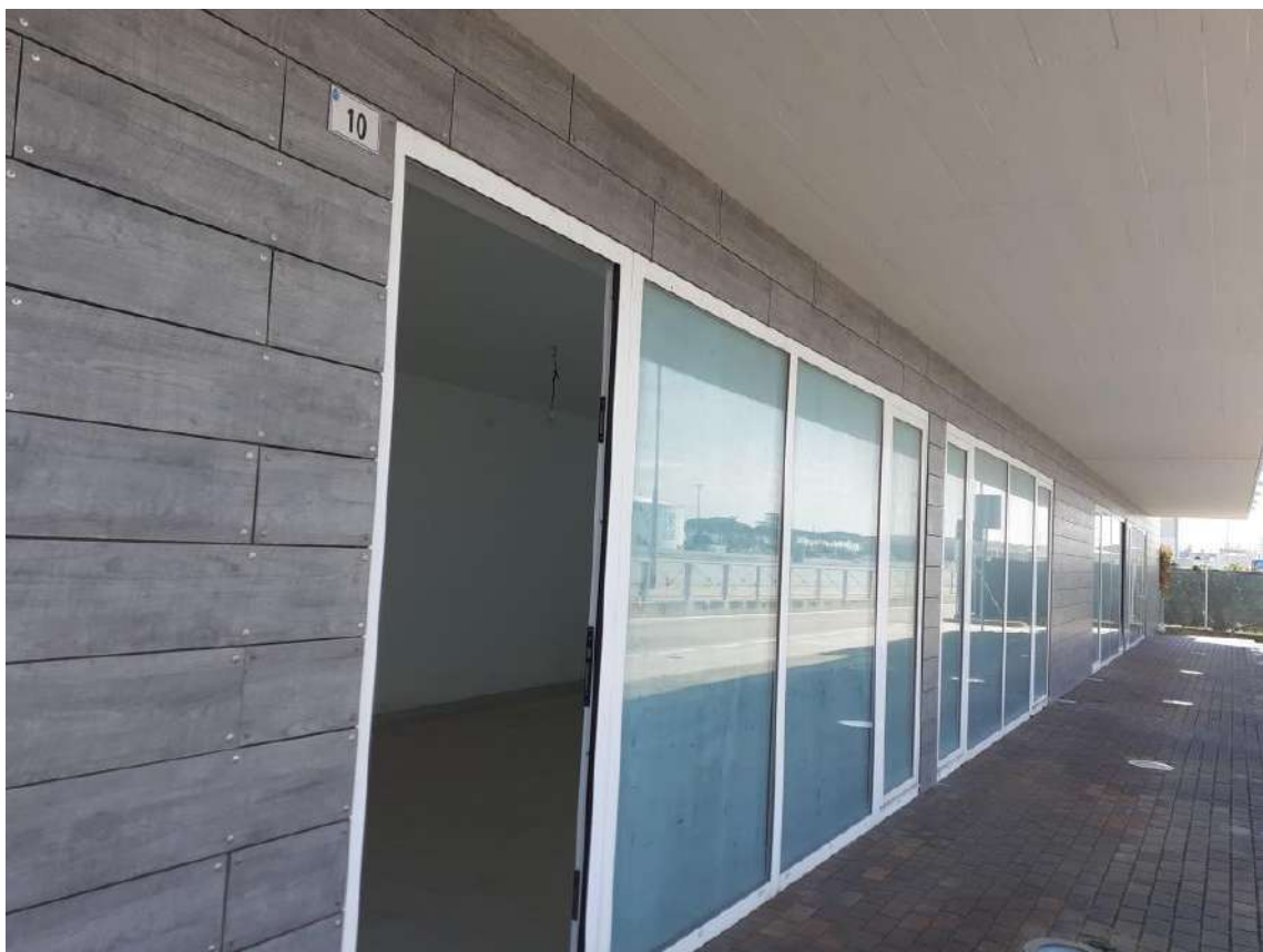
SUB 7 ESTERNO: VETRINE E INGRESSO