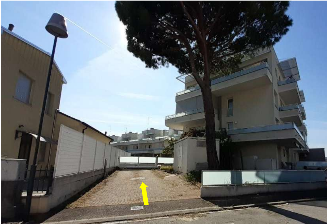
VISTA PROSPETTO NORD-EST DEL FABBRICATO "A" E INGRESSO CARRABILE DA VIA G. GARIBALDI