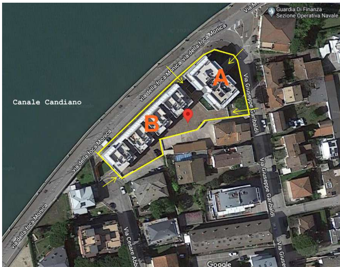
IMMAGINE SATELLITARE UBICAZIONE DEL RESIDENCE "MEDITERRANEO" LOC.TA' MARINA DI RAVENNA INDICAZIONE DEI FABBRICATI "A" e "B" E DEGLI ACCESSI CARRABILI E PEDONALI SU VIA CESARE ABBA E VIA G. GARIBALDI E DELL'ACCESSO PEDONALE AL COMPLESSO SU VIA DELLA FOCA MONICA