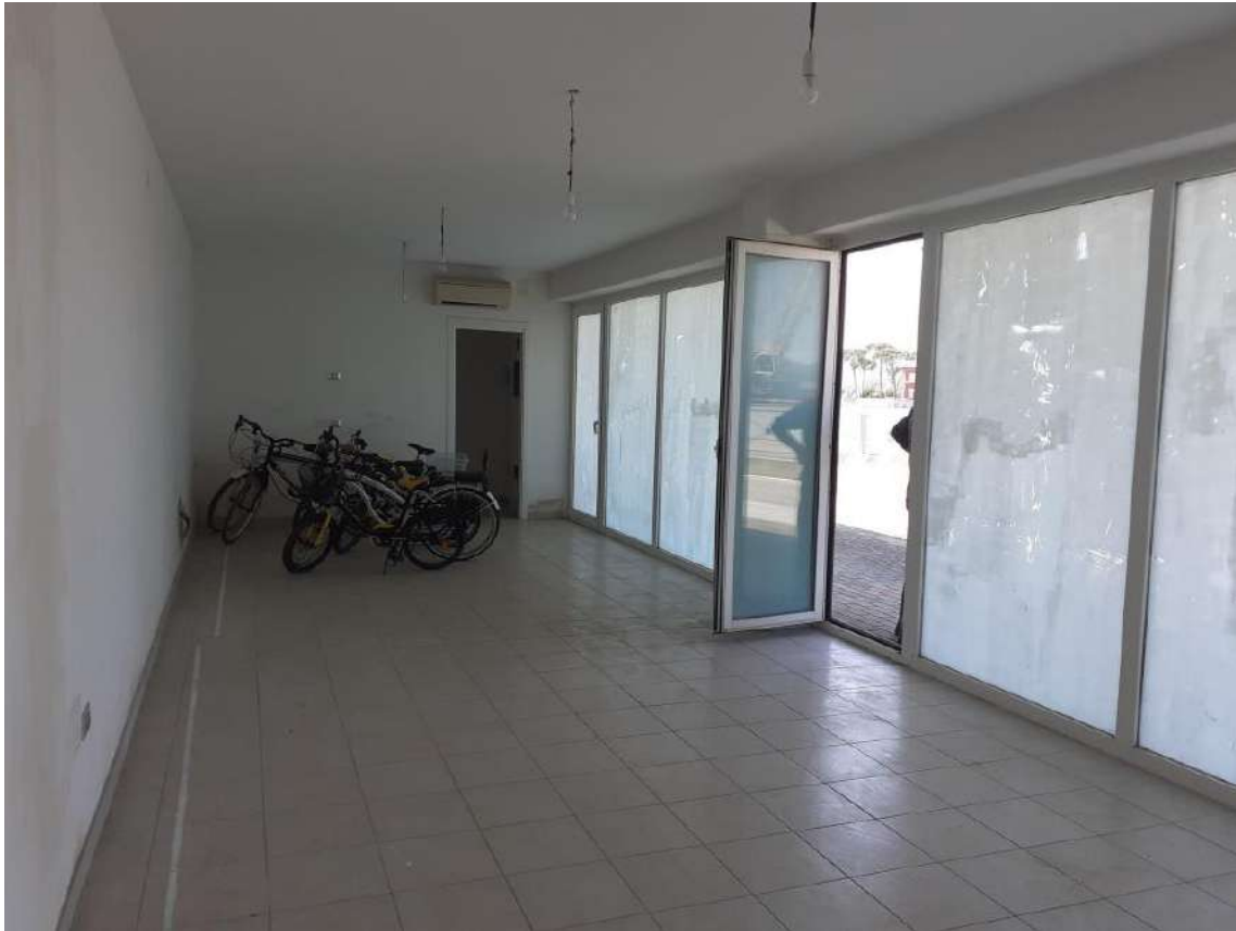
SUB 7 INTERNI: LOCALE PRINCIPALE E PARTICOLARI