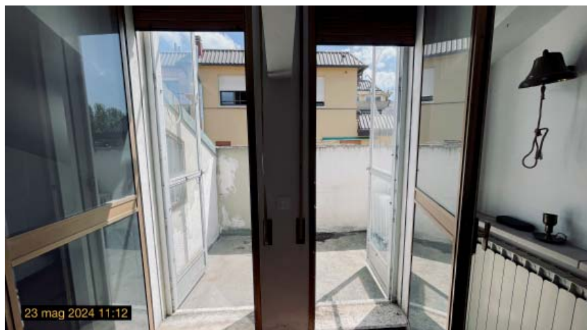
le porte finestre sul terrazzino