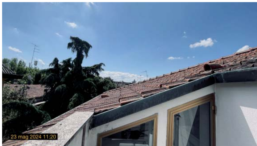
vista del confinante fabbricato a sud est e finestre cucina