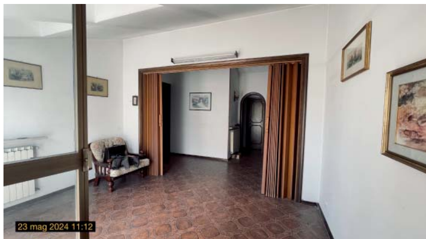
vista soggiorno verso ingresso