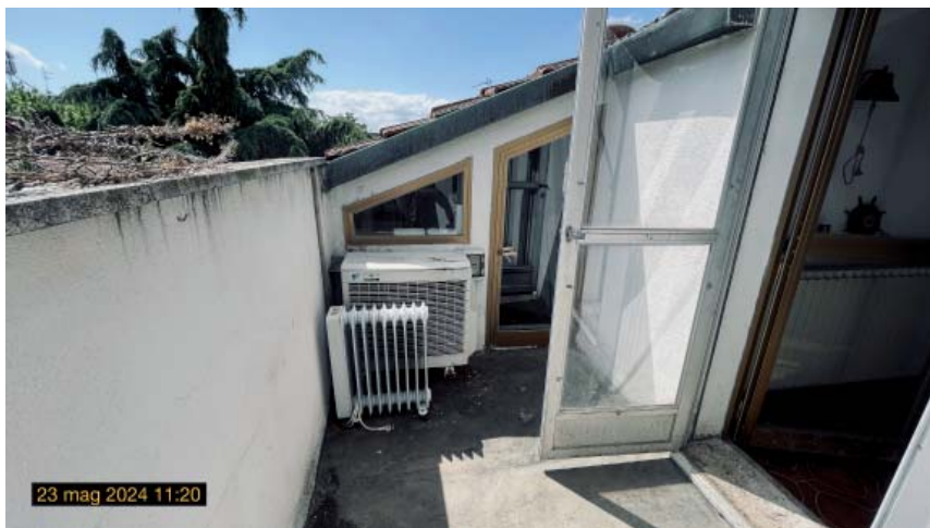
il terrazzino del soggiorno