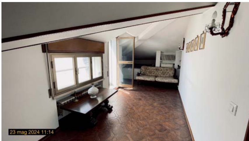
camera da pranzo con le porte finestre sul terrazzino