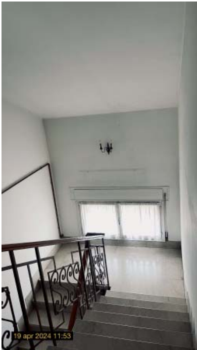
vista delle parti comuni, scala e ascensore