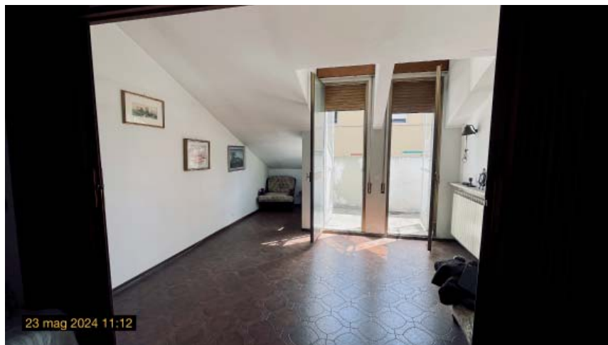
viste ingresso e soggiorno