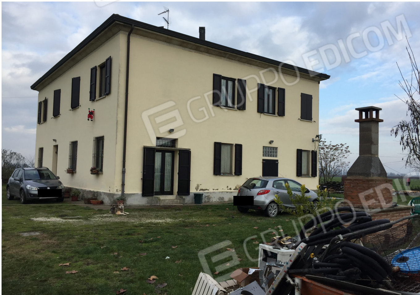
Foto 5 - Prospetto sud-est