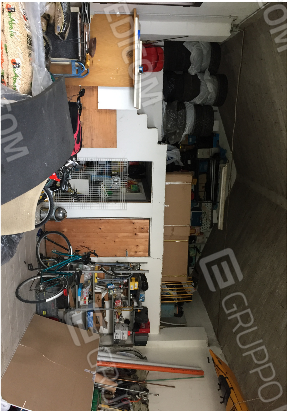
Foto 14 - Interno corpo servizi