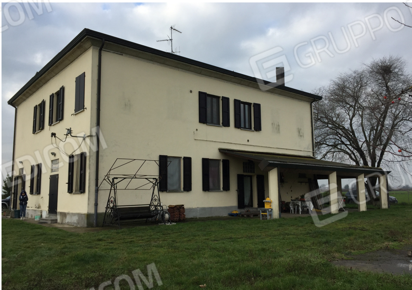
Foto 6 - Prospetto nord-est