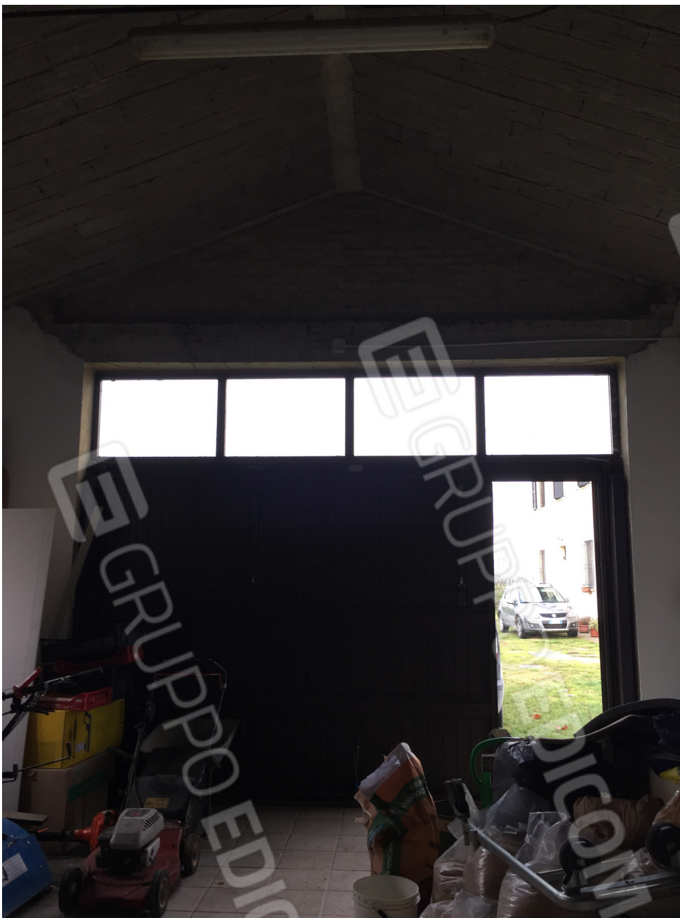
Foto 13 - Portone carrabile/pedonale corpo servizi