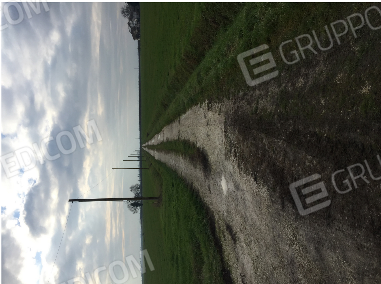
Foto 2 - Strada podereale d'accesso