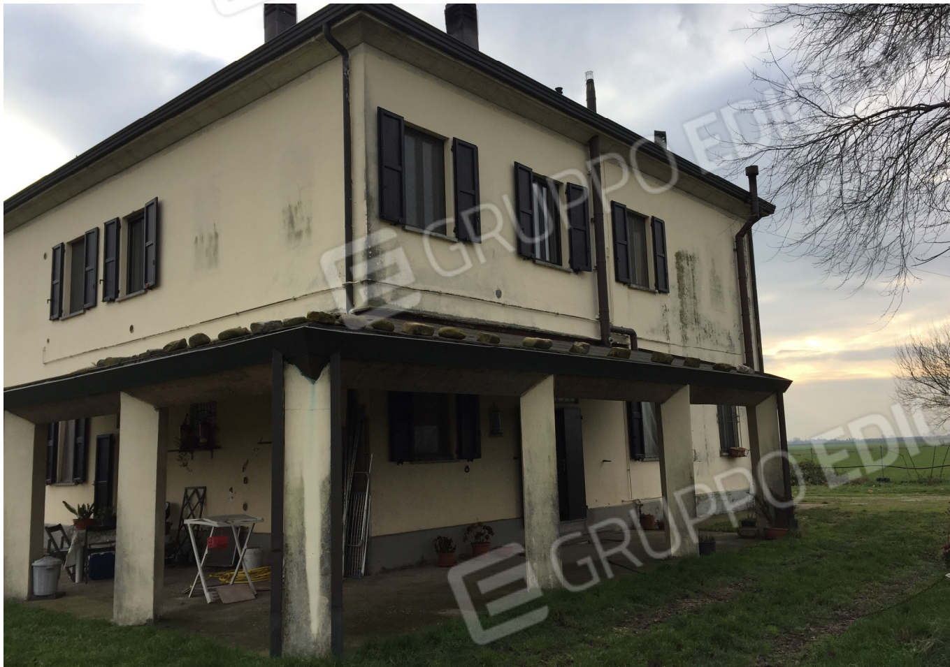
Foto 7 - Prospetto nord-ovest