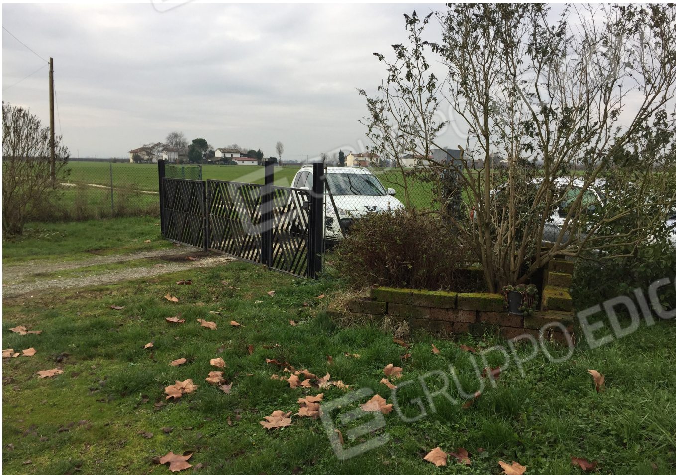
Foto 3 - Cancellone pedonale e carrabile d'ingresso